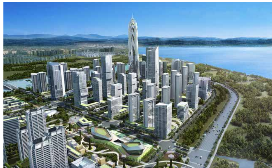
共享绿心公园效果图 Design sketch of the shared Green Park.

青岛是中国沿海重要中心城市和滨海度假旅游城市、国际性港口城市、国家历史文化名城，正乘着“办好一次会、搞活一座城”的东风，加快建设开放、现代、活力、时尚的国际大都市。青岛西海岸新区是 2014 年 6 月国务院批复设立的第九个国家级新区，肩负着海洋