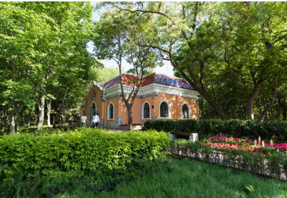
公厕建设管理水平的提高,也是城市综合品质的提升。Improvement in construction and management of public toilets is also an enhancement in the comprehensive quality of the city.

在全省“互联网+医疗健康”便民惠民百日行动期间,改造医院各信息系统,在青岛市首发电子健康卡。居民电子健康卡是国家卫生健康委统一标准、全国通用的电子就诊卡,旨在解决看病就诊“多卡并存、互不通用”的堵点问题。在就诊的过程中,从预约诊疗到签到、就诊、化验、缴费、查询结果,以及出院之后的健康服务等,整个流程的健康医疗信息都可以通过电子健康卡实现自助管理,真正做到居民健康“一卡通(一码通)”,极大简化了就诊流程,提升老百姓就医体验。小小的二维码背后,是复杂和严密的身份认证、数据关联,使得电子健康卡成为通向未来医疗的二维码钥匙。