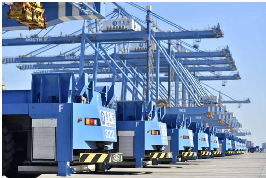
青岛港自动化码头 The automated terminal of Qingdao Port.

为推动青岛市产业转型升级和新旧动能转换，不断引导创新要素向青岛集聚，青岛市每年组织开展“百所高校千名博士青岛行”活动，并连续多年举办“蓝洽会”，搭建国际人才项目对接洽谈平台，在海内外高层次人才中形成较好的知名度和美誉度，多年入选国家“海外赤子为国服务行动计划”。先后建成高层次人才创业中心、博士创业园、院士创新创业园等多层次、宽领域的创业孵化载体，其中，在青岛国际院士港建