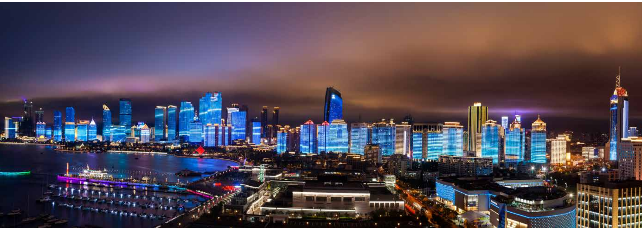
自上海合作组织青岛峰会成功举办以来，青岛沿海一线的灯光秀一直备受人们关注。 Since the successful holding of SCO Qingdao Summit, the light show on the coast has attracted many people's attention.