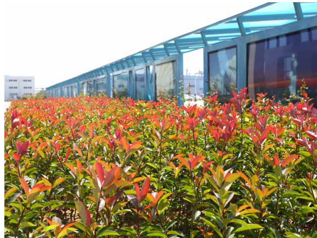
绿树蓝天白云下，掩映的智能化管理系统。 The intelligent management system is under the green trees, blue sky and white clouds.

接下来的每一步，海湾化学都秉承着绿色环保的理念，稳扎稳打的阔步前进，按照“四化”和“一体化”的要求，海湾化学先后引进英国英力士专有工艺技术，生产VCM及通用型、特种PVC树脂产品。目前，烧碱、PVC、VCM、偏硅酸钠等产品的各项能耗指标均居行业领先水平；废水、废气、噪声排放达标率100%，固废合规处置100%；引进美国德西尼布石伟公司的乙苯脱氢法清洁生产工艺生产苯乙烯；引进日本氯工程先进的离子膜电解技术，生产高品质