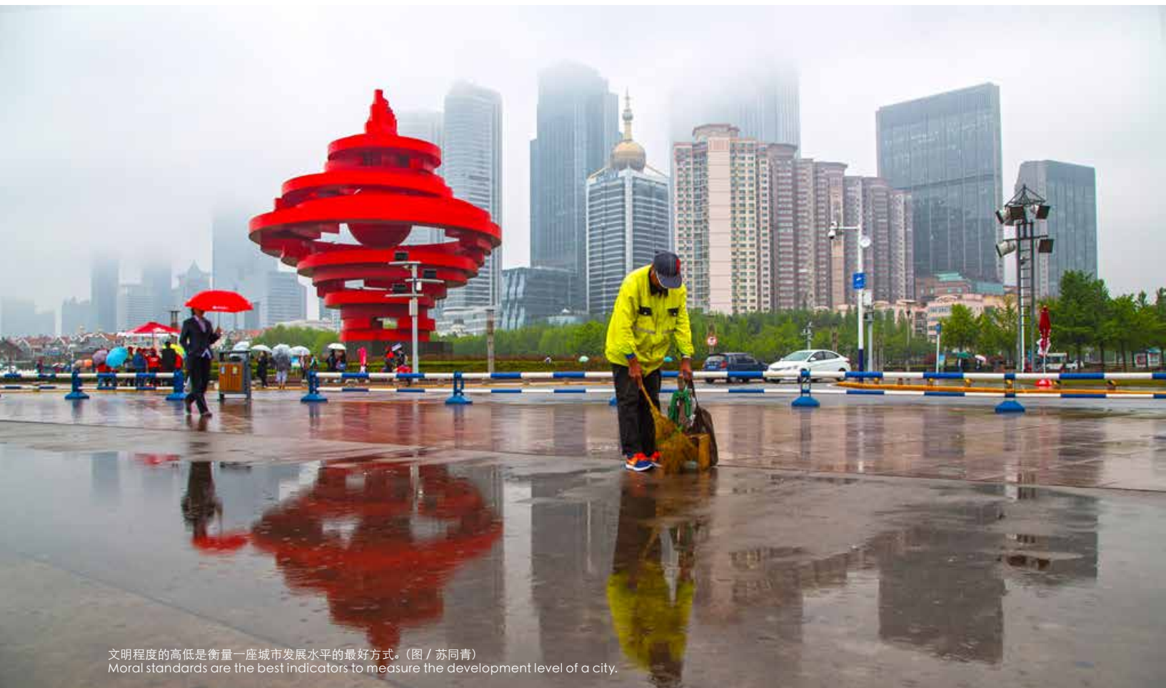
文明程度的高低是衡量一座城市发展水平的最好方式。 Moral standards are the best indicators to measure the development level of a city.

Higher moral standards make a happier Qingdao