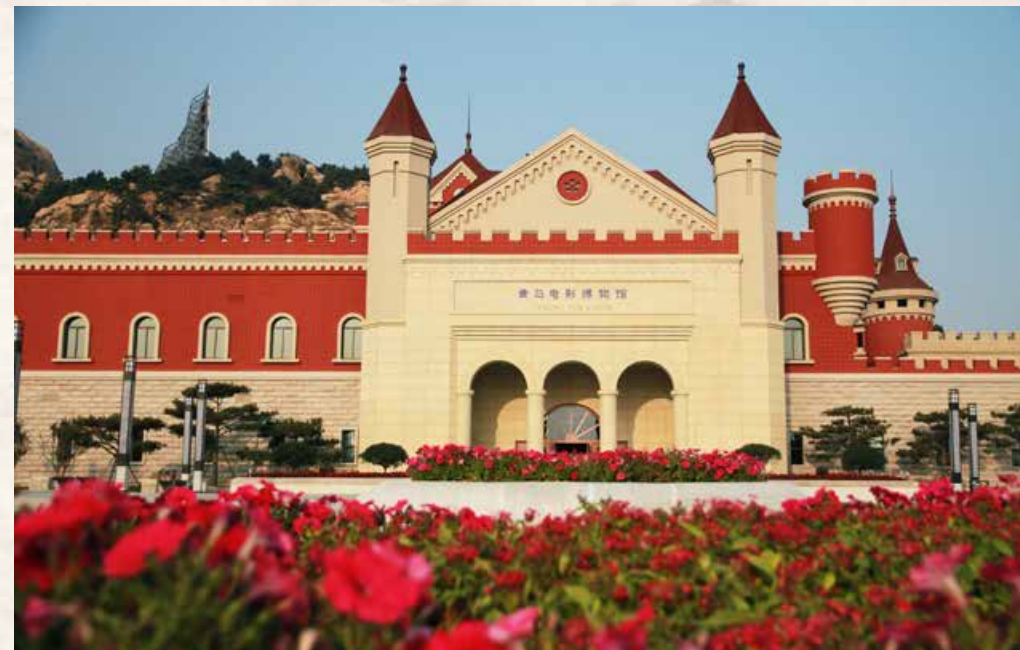
红色城堡的模样让青岛电影博物馆如梦如幻。 The architectural style of a red castle makes Tsingtao Movie Museum look like a fancy dream.

那些与“电影”相伴而行的电影人，都“住进”了青岛电影博物馆的“心”中。1935年，由洪深编剧的《劫后桃花》在青岛拍摄外景，此后明星影片公司出品的影片，把青岛选为除上海以外首映地，作为中国电影开拓者之一的洪深，其身影成为了青岛厅一道亮丽的景观，以百年记忆诉说青岛与电影的情缘，珍存那些岁月的纪念。从人灵地杰的青岛走出的众多优秀电影人，镌刻在了青岛电影博物馆的一面“影人墙”，这是利用 mapping 影像的技术展示出了青岛本土著名电影人、艺术家们的风采，他们脍炙人口的经典代表作品也为中国电