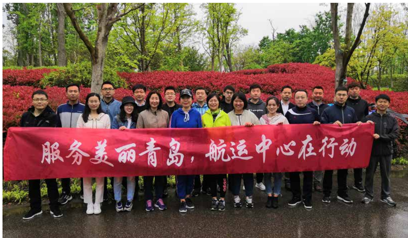
青岛港航服务中心的设立为港航产业的发展适时的注入了新鲜血液。 The establishment of Qingdao International Shipping Service Center timely injects new blood to the development of the port and shipping industry.

究、打造国家级高端航运智库以及航运指数研究工作为主，先后创新性发布了中韩、中日、东北亚、一带一路、中欧、美洲、综合集装箱、邮轮经济发展、青岛干散货9支青岛特色航运指数，成为青岛及周边航运市场的晴雨表和风向标。并搭建国际港航智库，定期举办高峰论坛，积极引进和培训高端港航人才，建立了上海海事大学研究生青岛实训实践基地，推进上海海事大学青岛研究生院落地。通过开展《青岛现代航运服务业建设发展研究》《加快港航新旧动能转换，推动青岛建设区域性国际航运中心》等多项课题研究，探索政策与制度创新，为全国创建“一带一路”枢纽型港口提供实践案例与政策解读平台。