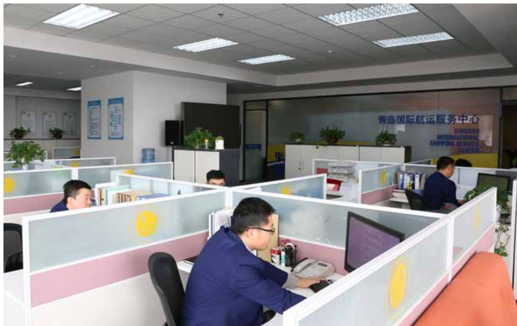
青岛国际航运服务中心立足集聚航运要素资源、沟通航运动态信息、规范航运交易行为、激发航运市场活力4项基本功能。 Qingdao International Shipping Service Center is based on 4 basic functions: gathering shipping element resources, communicating dynamic shipping information, standardizing shipping transactions, and inspiring shipping market vitality.

2019年，为深入贯彻落实习近平总书记关于经略海洋的重要指示，按照省委推进海洋强省建设的部署要求，根据青岛市委主要领导在全市海洋经济发展座谈会上提出的“发起新旧动能转换的海洋攻势”指示要求，青岛国际航运服务中心积极担当作为，拓展工作新思路，实现新突破。围绕新旧动能接续转换事项，青岛国际航运服务中心在上级部门的带领下，多次与交通部、省交通厅等衔接沟通，目前，争取国家批复国际航运中心等7项政策已落地。根据近期自贸区申建部署，围绕“干什么、怎么干”要求，按照工作分工，不等不靠，在总结和复制上海、广东、天津、福建等自由贸易试验区经验基础上，多次与上海海事大学和青岛航运发展研究院进行了研讨，面对自贸区建设带来的新机遇，多次对接国家交通部、省交通厅等相关部门，在扩大国际海运领域对外开放方面探索进一步突破，全力推进国际船舶运输、国际船舶管理、国际船舶代理、国际海运货物装卸、国际海上集装箱站和堆场等各项国际海运及辅助业务。探索建立交通运输与自贸区对接的点、线、面融合，形成构建国际航运中心与自贸区正向叠加效应。此外，针对上海、广州、天津、宁波等地国际航运中心建设情况进行专题调研，起草了《关于青岛建设国际性港口城市的政策分析和建议》《关于青岛港航短板分析及发展建议》等工作报告。参与由市发改委牵头编制的《国际航运中心建设路径研究》等课题研究，