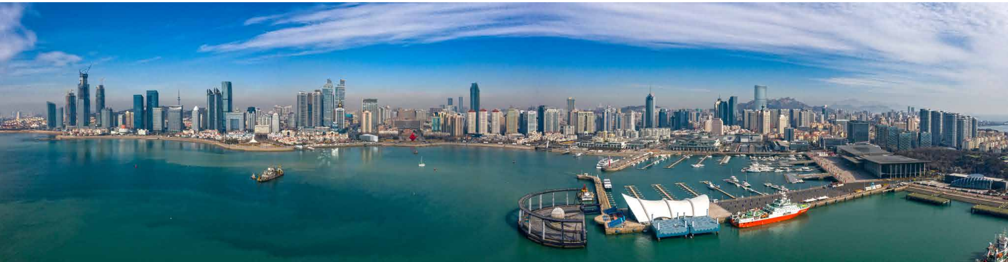
青岛越来越有现代化国际大都市范儿。 Qingdao gradually become a modern international metropolis.

New wings propel Qingdao towards deeper internationalization