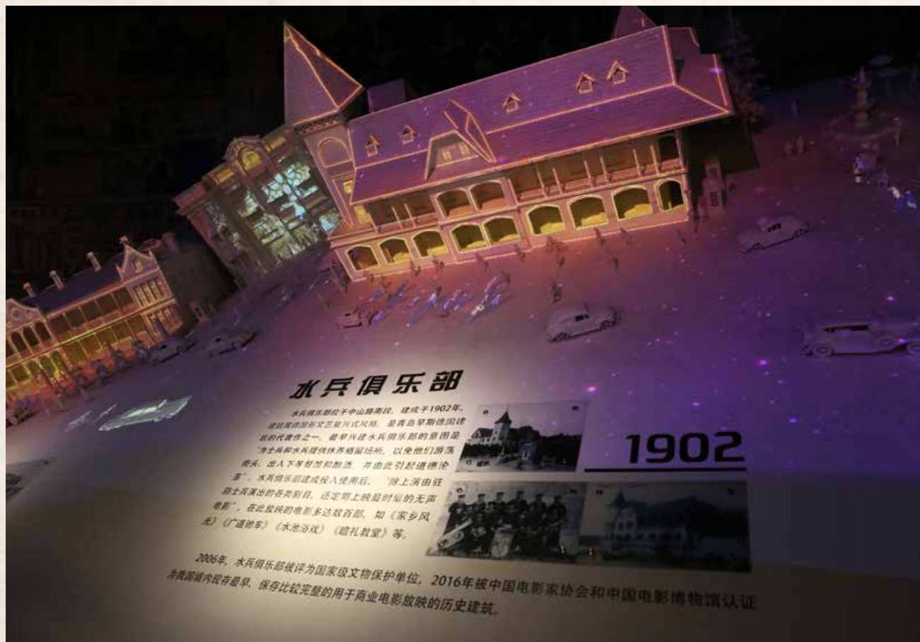
博物馆中，以电影蒙太奇的手法打造出一条景观街，立体生动地介绍了青岛几所著名的电影院。 In the museum, a scene street is created by the use of montage, vividly introducing several famous cinemas in Qingdao.

技”“儿童”“美式乡村”“好莱坞”“老上海”6个风格不同的主题包间。以个性化的影片点播形式提供极具灵活度及私密性的舒适观影空间，增强自主体验感。“胶囊影院使用影院专业级放映点播及服务系统，片源库收录多达6000部的正版影视资源，国内外经典大片随时看，定期进行资源内容的更新。服务人员进行影视类知识及影视实时讯息等内容的定期培训和考核，提供极具专业化的配套服务及影视内容讲解。不定期开展‘主题影片展映活动’，例如影视音乐、动画、体育、电影节获奖影片等。”王柳说道。