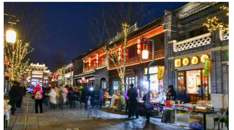
一座座建筑无声胜有声，默默传递着悠悠千古风韵。 The buildings silently present the profound historical and cultural deposits.

Like a kind of inheritance of history, Jimo ancient city leaves a deep historical and cultural mark in people's mind the moment it was unveiled to the public. On the one hand, it inherits the rich color of the business capital with a thousand years of history; on the other hand, it continues to hold the open and inclusive urban attitude. Ballad festival, Spring Festival gala and other festival activities amaze people with brilliance; the integration of culture and tourism obtains numerous favorable comments. Jimo ancient city gradually becomes a new landmark of cultural tourism in Qingdao, as well as a desirable