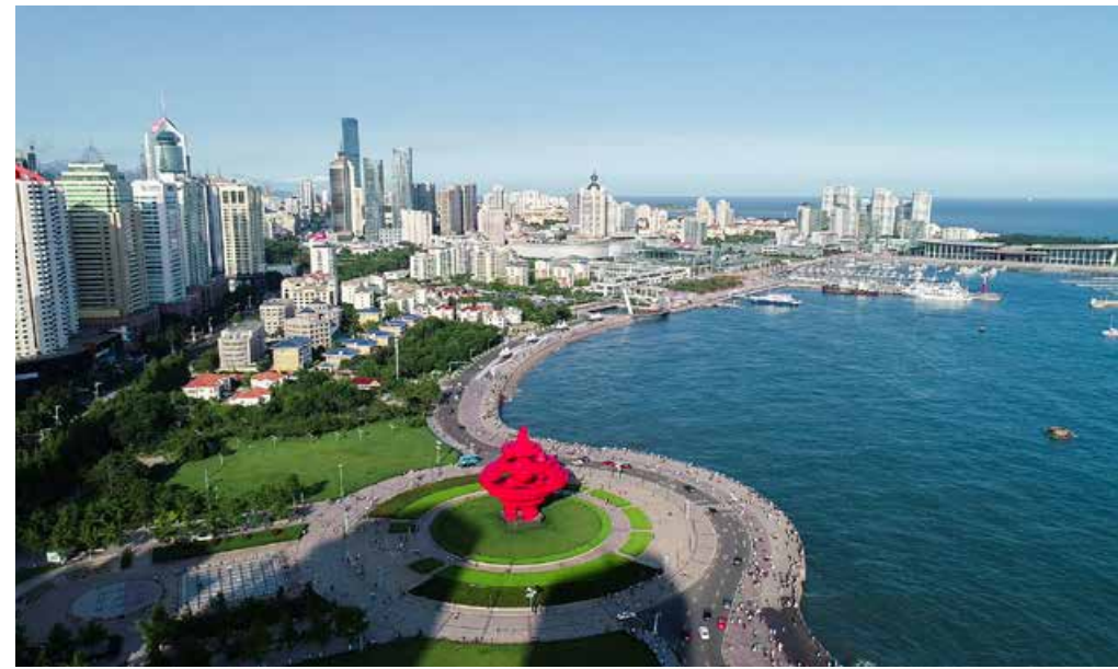
俯瞰浮山湾区域 Top View of Fushan Bay Area

全会强调，要认真贯彻落实省委关于开展“工作落实年”的决策部署，聚焦高质量完成各项经济指标、扎实推进新旧动能转换重大工程、坚定不移抓好“双招双引”、加快建设海洋强市、深入推进乡村振兴战略、推进军民融合创新发展示范区加快发展创新发展、坚定不移打造开放发展桥头堡、实现创新驱动发展新突破、深化重点领域改革、坚决打好三大攻坚战、深入开展扫黑除恶专项斗争、扎实扩大有效投资、做大做强民