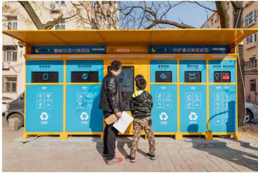
公益环保项目“智能垃圾分类回收”走进小区。 The public welfare project of environmental protection — "intelligent garbage classification and collection" comes to the residential areas.

除了公交，新能源私家车也越来越多。最新数字显示，自2014年9月1日新能源汽车免税政策实施以来，青岛作为全国首批28个推广应用示范城市之一，2015年新能源汽车销量出现了井喷式增长。截至2017年年底，青岛市新能源车数量达到5.4万辆，位居山