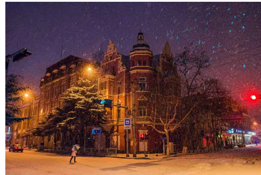
雪夜 Snowy night.

过去，青岛的夜晚是璀璨的，星星点点的灯光装扮着深夜的青岛，每一处灯光都透露出家的温暖，而如今，青岛夜晚是绚丽的，华灯初上便让整个青岛明亮有深意，那一方璀璨仿佛展示着人们的幸福生活。青岛的夜，恢宏绚烂，成为“网红”再正常不过了。