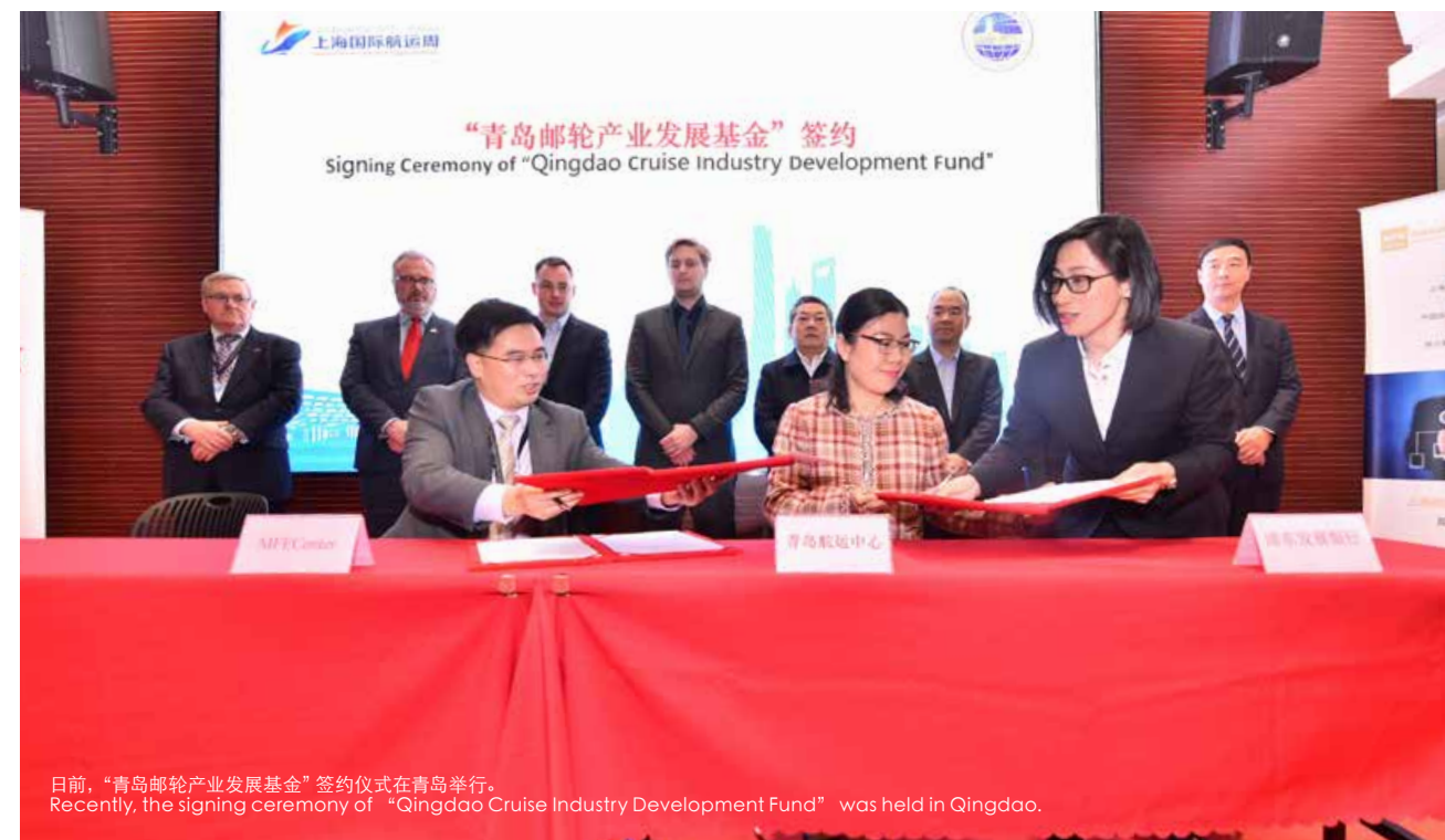
日前，“青岛邮轮产业发展基金”签约仪式在青岛举行。 Recently, the signing ceremony of “Qingdao Cruise Industry Development Fund” was held in Qingdao.

在这里，还有一道靓丽的风景线——青岛国际航运服务中心工作团队，他们年轻、朝气、敬业、奉献，是一支能吃苦、重团结、讲奉献、打硬仗的青年队伍。团队牢记中共山东省委常委、青岛市委书记王清宪在参加青岛代表团对山东省政府工作报告时所指出