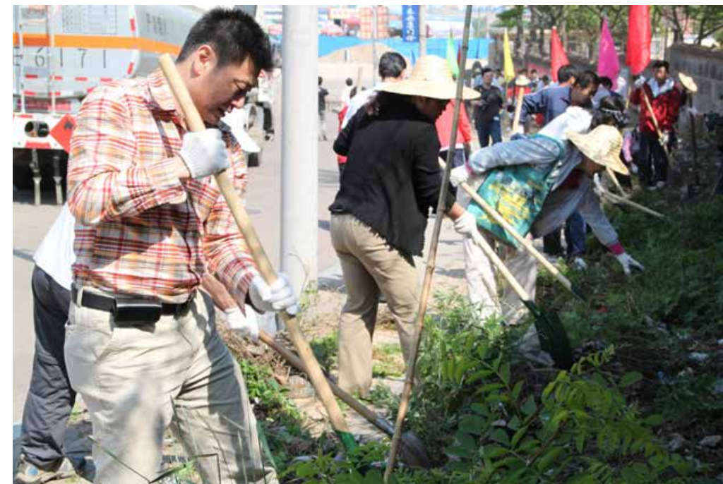
城市环境氛围的提升，让青岛变得更加美丽 The improvement in the city environment makes Qingdao become more beautiful.

据了解，即墨区针对青岛蓝谷、地铁11号线沿线等重点区域，实施市容环境秩序专项治理，排查整改违法建设、