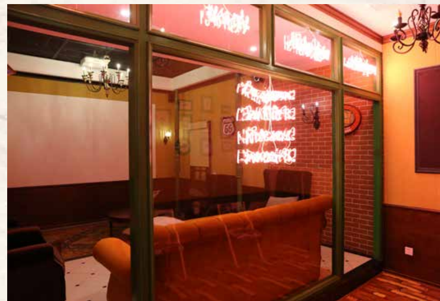
胶囊影院里面还原知名美剧《老友记》的场景。 In the capsule cinema, the scene of the famous American TV series Friends is restored.

T singtao Film Museum, located in the core region of Lingshan Bay Film and Television Culture Industry Area, and adjacent to the Oriental Movie Metropolis, is invested and operated by the West Coast Development Group, which aims to build a high point of the core culture for Qingdao as the “City of Film”. Now, it has become a landmark as well as a benchmark project in the West Coast New Area. It is also an important cultural site in the area.