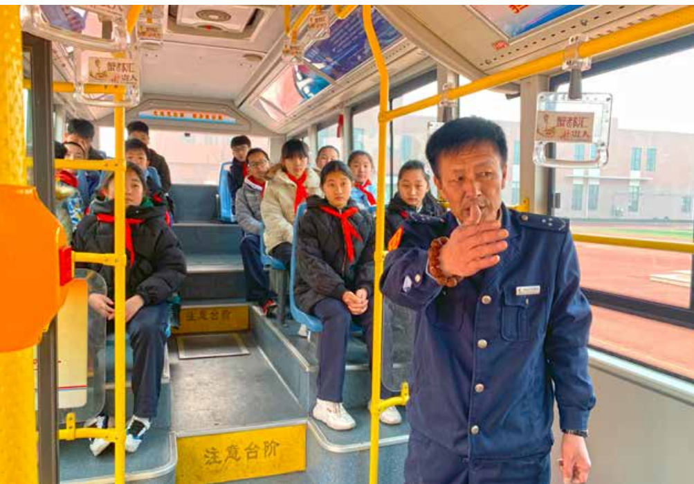
青岛市城阳区春雨小学的同学们在公交车厢内上了一堂生动的安全文明乘车知识课。 The students of Chunyu Primary School had a vivid class of safe and civil bus ride knowledge on a bus.

超市里的卖相好，但口味不太甜，更加适合老年人吃。这次学会了做元宵，以后家里再也不买了，自己做的干净卫生又好吃。”