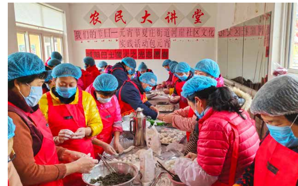
青岛公交集团城阳巴士有限公司“萤火之光”的志愿者们来到了城阳区河崖社区，和老人、孩子们共同制作元宵来庆祝元宵节的到来。The volunteers of “Firefly Light” from Qingdao Public Transportation Group Chengyang Bus Co., Ltd. came to Heya Community in Chengyang District, and made sweet dumplings with the elderly and children.

在元宵节前夕，青岛公交集团城阳巴士有限公司“萤火之光”的志愿者们来到了城阳区河崖社区，和老人、孩子们共同制作元宵来庆祝元宵节的到来。对此，城阳区河崖社区的王大姨高兴地说：“我们自己做的这些元宵虽然不如