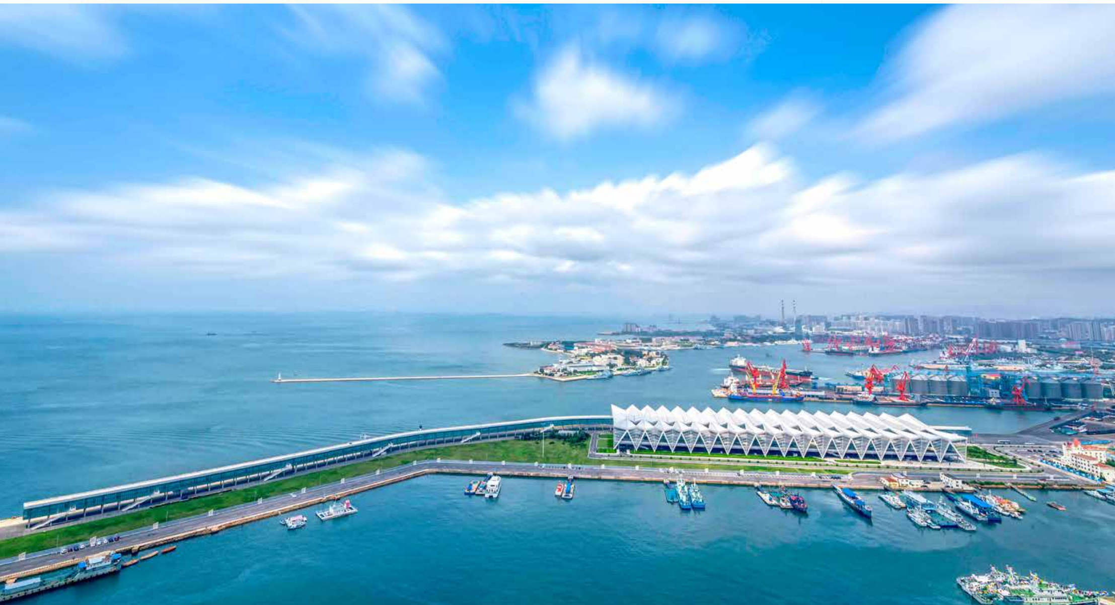
俯瞰青岛邮轮母港 A bird's eye view of Qingdao cruise ship home port