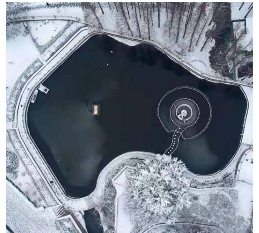
雪中的小西湖美景。Beautiful scenery of Xiaoxihu Lake in snow.

What makes Qingdao an internet celebrity? It is the magnificent light show by the seaside, the unparalleled wonderful night view, the winter scenery after snow as good as that in the Forbidden City, the dialect that sounds interesting to the foreigners while intimate to the local people, and the landmarks where you can get a feast for your appetite. For Qingdao, it is not difficult to become an internet celebrity because the city is endowed with exceptional natural advantages and the witty people there can easily become celebrities. Let's see the development of Qingdao as an internet celebrity and feel the unique charm of Qingdao.