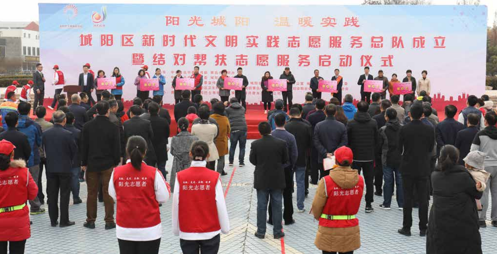
近日,以“阳光城阳 温暖实践”为主题的新时代文明实践志愿服务总队成立仪式在青岛市城阳区人民广场举行。 Recently, the establishing ceremony of the New Era Civilization Practice Volunteer Service Team themed with “Sunshine Chengyang, Warm Practice” was held in People’s Square in Chengyang District.

Dedicate to the people with sincere services