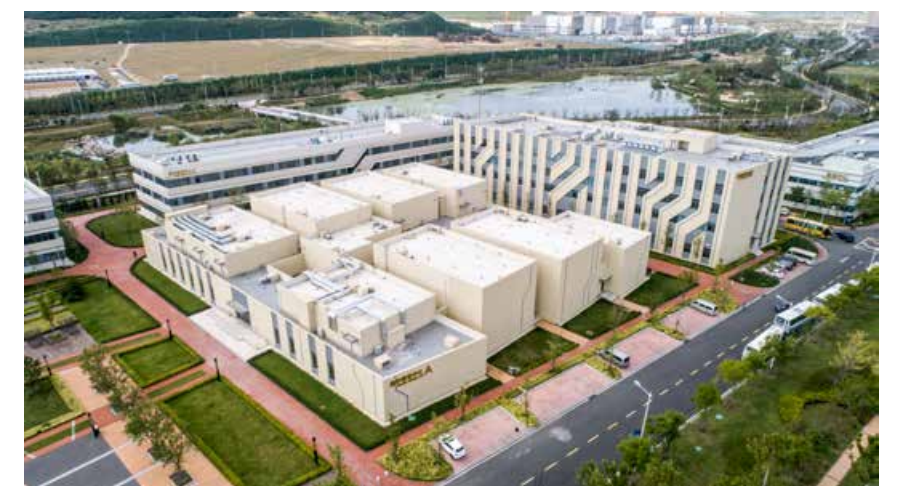
鸟瞰影视产业园数字影音中心 A bird's eye view of the Digital Audio and Video Center in the Film and Television Industry Park.

Qingdao West Coast with its own strength is contributing to the development of Chinese film.