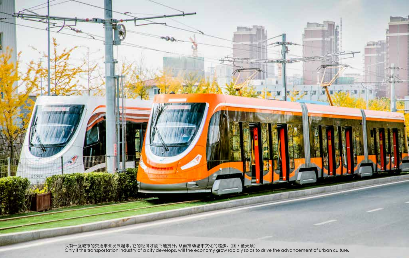
只有一座城市的交通事业发展起来，它的经济才能飞速提升，从而推动城市文化的越步。Only if the transportation industry of a city develops, will the economy grow rapidly so as to drive the advancement of urban culture.