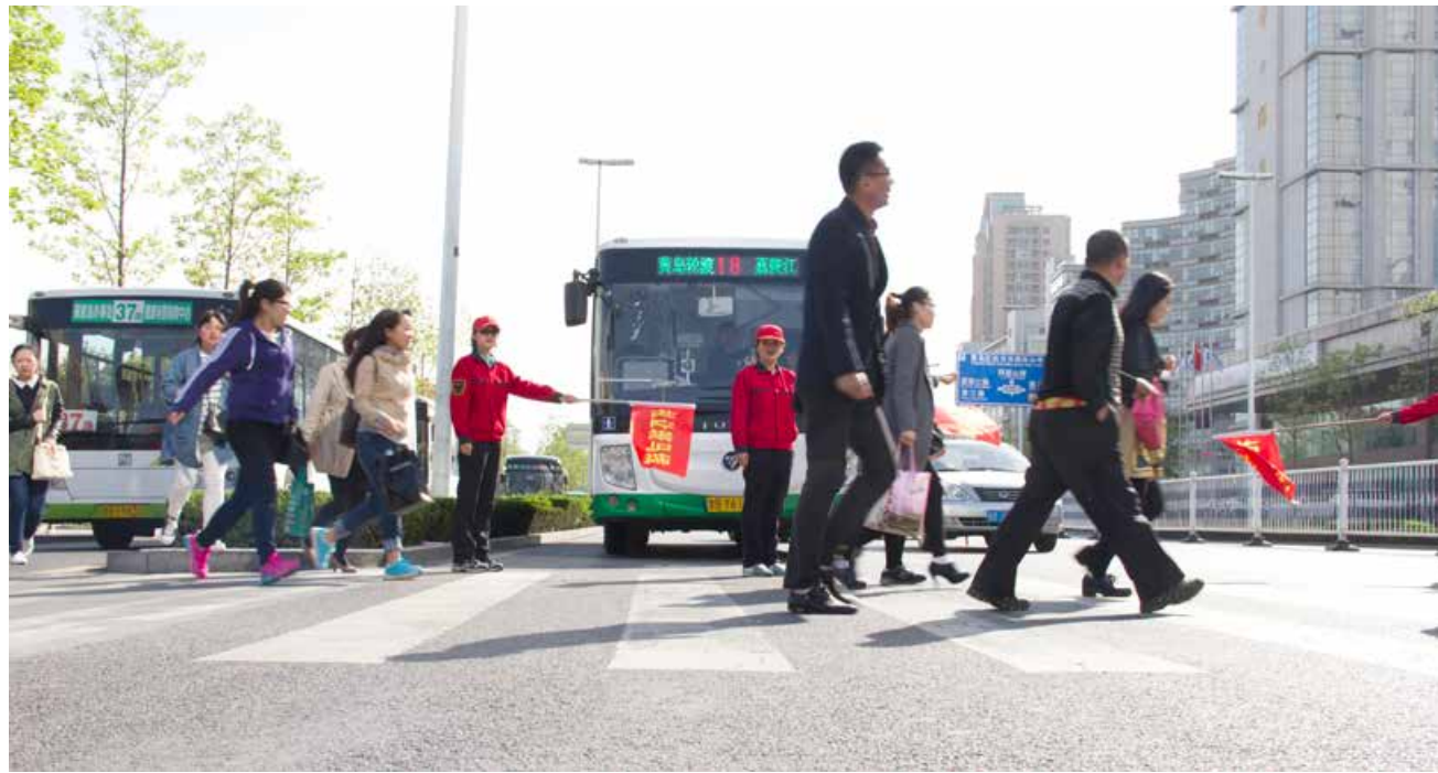
“礼让斑马线”在青岛蔚然成风。“Let others go first at zebra crossings” has become a common act in Qingdao.

违规广告等8类5120项问题，整治区域城市品质显著提升。小商品城、厨具商城等“五城”周边是展现“千年商都”风采重要区域，对鹤山路、佳乐家路口等重点商圈周边实施区域性综合整治，拆除违规广告牌匾2.59万平方米、私搭乱建1.2万平方米；升级改造门头牌匾1.4万平方米，整饰粉刷建筑立面3.69万平方米。落实即查即拆措施，健全新生违建网格责任监管机制。10.4万平方米新生违建实现“早发现、快清理”，存量违建实施分类稳妥治理，累计拆除6000余处167万平方米。