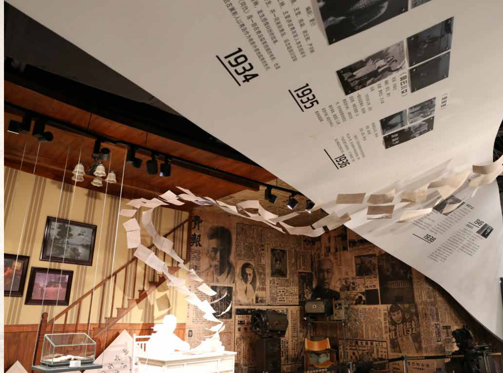
博物馆用浪漫展陈的手法还原了洪深在青岛构思故事、伏案写作的场景。 With a romantic display technique, the museum reappears the scene that Hong Shen wrote stories in Qingdao.

步入博物馆的二层，“拾光里”的名字赫然出现，而他们的理念——“你的每一刻，都是首映礼”，也十分有新意。王柳介绍，“拾光里”艺术空间，面积约5923平方米，结合了电影中的经典