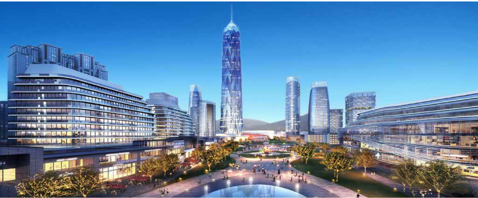
休闲商业街区效果图 Design sketch of the leisure and commercial district.

能力。青岛西海岸新区将与融创中国一起，集聚优势资源、高端人才，以世界眼光、国际标准，高水平开发建设，着力打造活力无限、引领西海岸未来发展的海洋活力区。