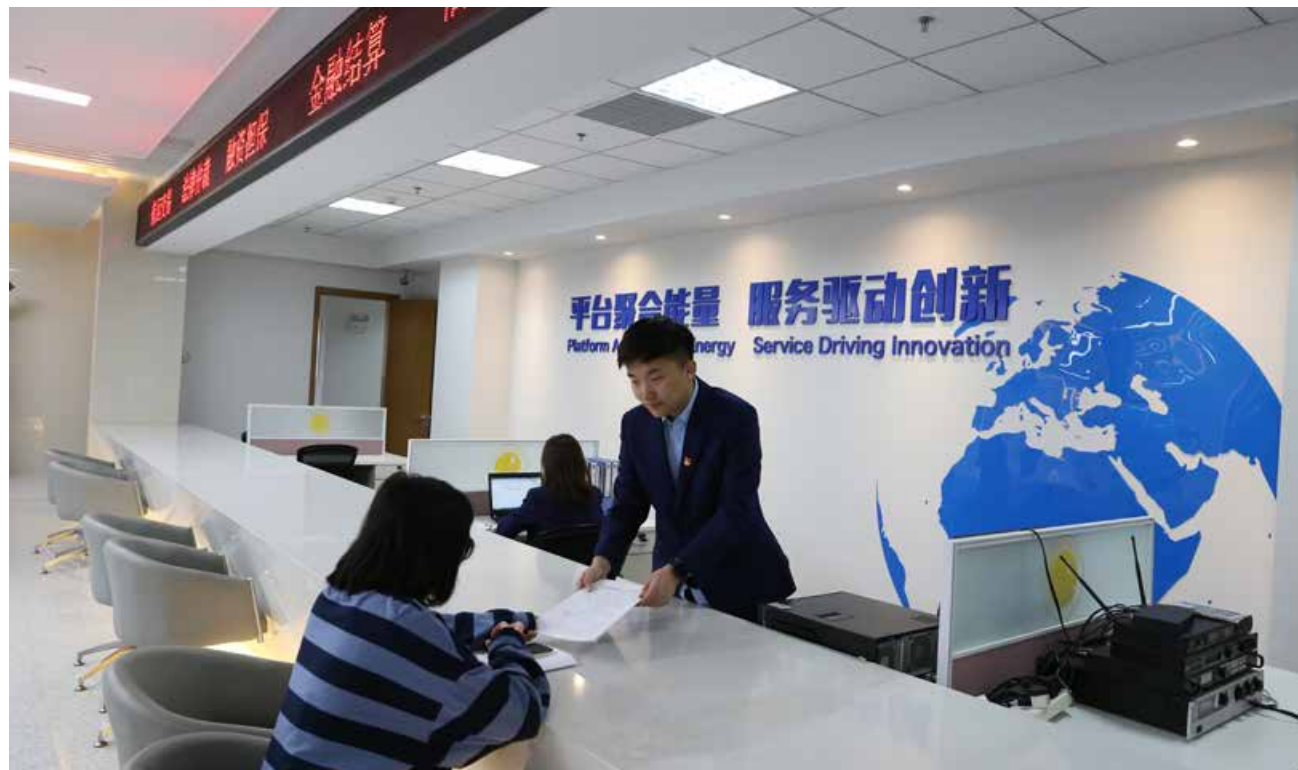
中心依托青岛城市优势，推进青岛港航发展的新旧动能转换，推动青岛港航业的转型升级。(图/杜永健) By virtue of the advantages of Qingdao, the service center promotes the replacement of old growth drivers with new ones in the port and shipping development in Qingdao, and propels the transformation and upgrading of port and shipping industry in Qingdao.

目前，青岛国际航运服务中心正全力搭建现代港航综合信息平台。据了解，该项目是“互联网+港航”的创新性实践和应用，平台致力于运用大数据、互联网+、物联网的理念，实现政府部门、港口、企业之间的信息交换共享。项目分两期完成，一期主要建设内容为“三个平台，一个中心，一套体系”（港口航运综合大数据公共服务平台、港口航运公共资源交易服务平台、智慧港航公共服务平台、港口航运数据中心和标准规范体系）。项目（一期）将于近期开工建设。接下来，将与青岛海洋科学与技术国家实验室、新华（青岛）国际海洋资讯中心等知名机构深度合作，共建“青岛国际港航大数据中心”，为信息化与港航业的融合发展奠定良好基础。与此同时，青岛国际航运服务中心成立的港航发展研究院，以开展港航战略研