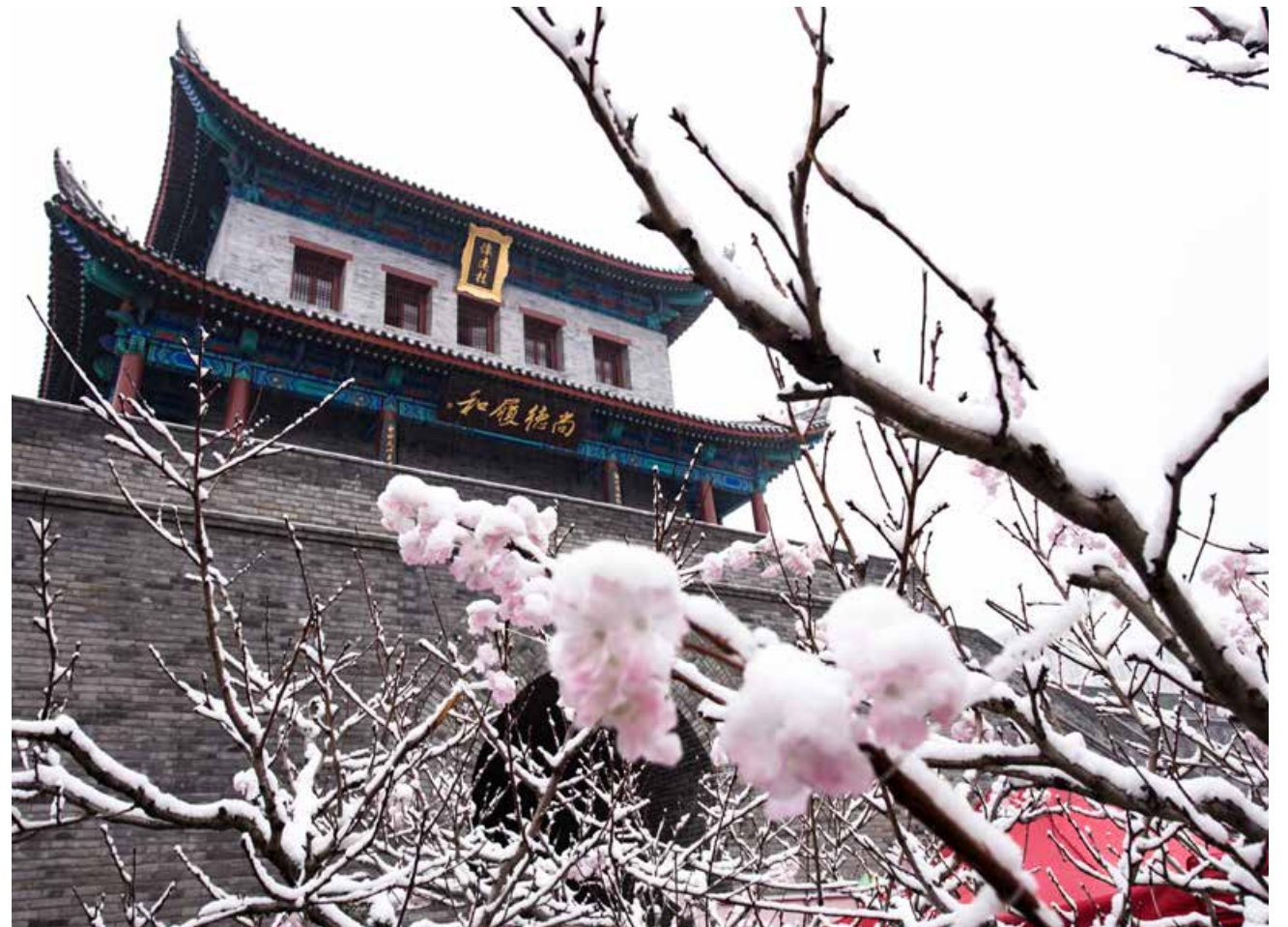
须臾之间，即墨古城已然成为青岛新晋网红、游客必逛之地，成为青岛文化旅游的新地标。 In an instance, Jimo ancient city has become a new internet celebrity, a must for tourist to visit, and a new landmark of cultural tourism in Qingdao.

的惊人“一鸣”，使即墨之名昭彰天下；稍后，田单借此一座孤城，巧用火牛阵大破燕军，又进一步提高了即墨的知名度。秦一统天下，实行“郡县制”，即墨始定为县；然而这个新生事物在随之而来的一场改朝换代的纷乱中似乎有些动摇。汉初，高祖刘邦的孙子刘熊渠被封到这里称“胶东王”。继之，景帝刘启的儿子刘彻、刘寄也被封于此。此后，刘姓的子孙先后有六七位王子在胶东王的封地里坐享荣华富贵，他们的权力笼罩着大半个山东半岛。兼做着“国都”的即墨县城，也成为胶东国政治、经济、文化的中心。王莽“新”了一阵，即墨被改名“即善”，但这个新名称很快随着新莽政权的垮台而被取缔，当然，