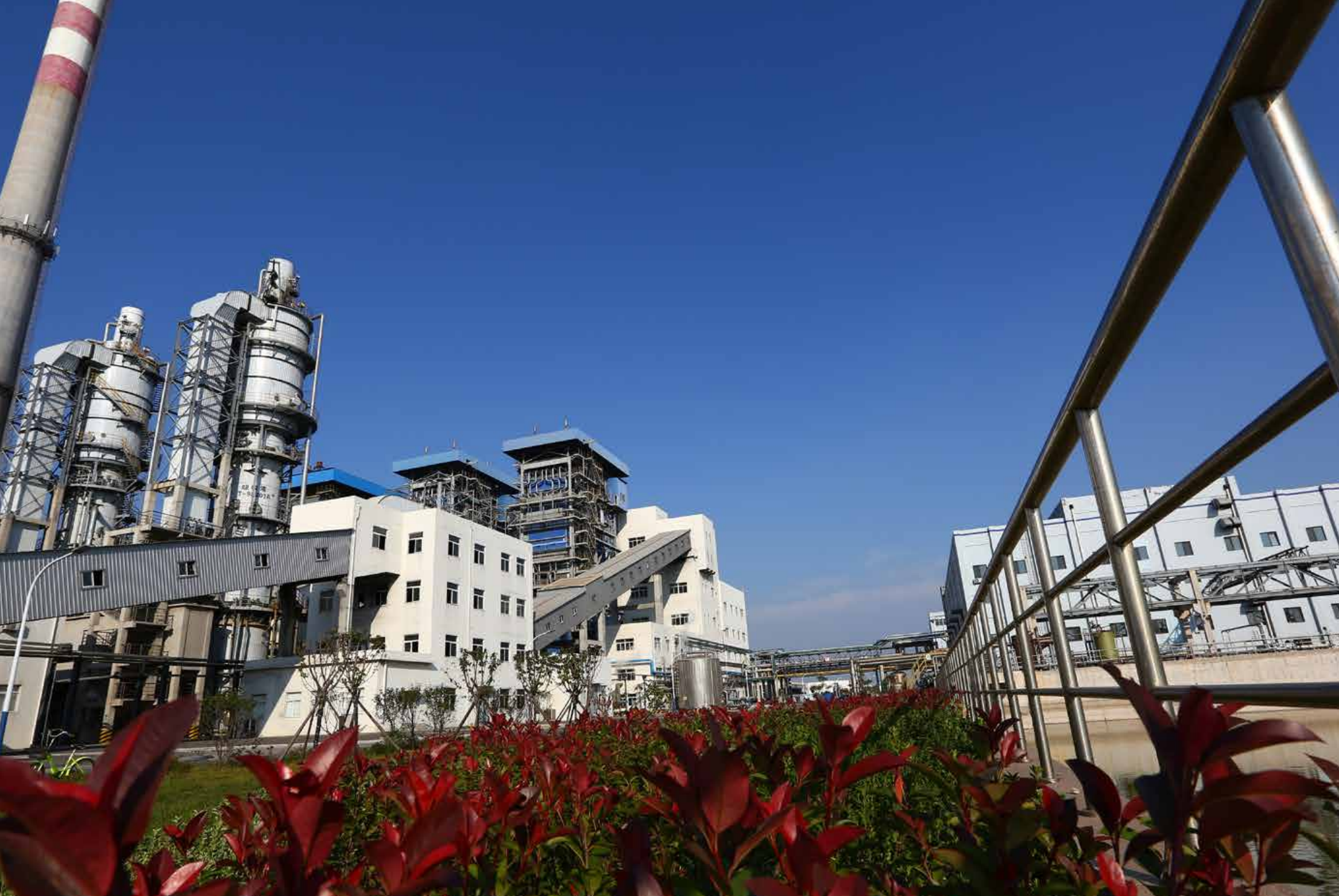
海湾化学的园区内宽阔而整洁的厂区一角。 A corner of the large and clean plant in the park of Haiwan Chemical.