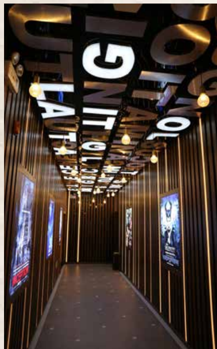
胶囊影院一景。 A scene of the capsule cinema.