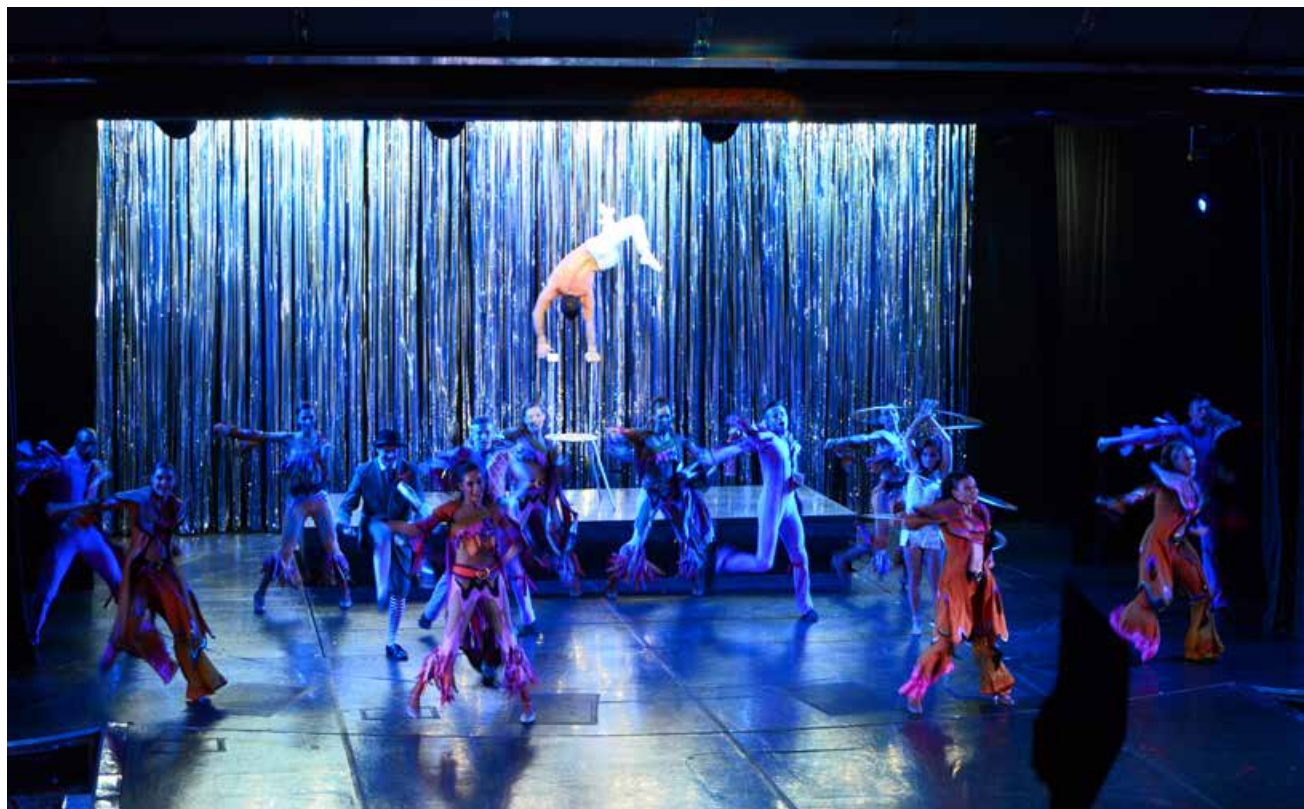
一次邮轮旅行，拥有始发港、访问港和邮轮本身至少3个“目的地”。There are at least 3 "destinations" during one cruise travel, including the departure port, the stopover port and the cruise ship itself.

海洋特色优势的重视，让邮轮旅游产业迎来全新的发展机遇。面对机遇与挑战，青岛市文化和旅游局干劲十足。