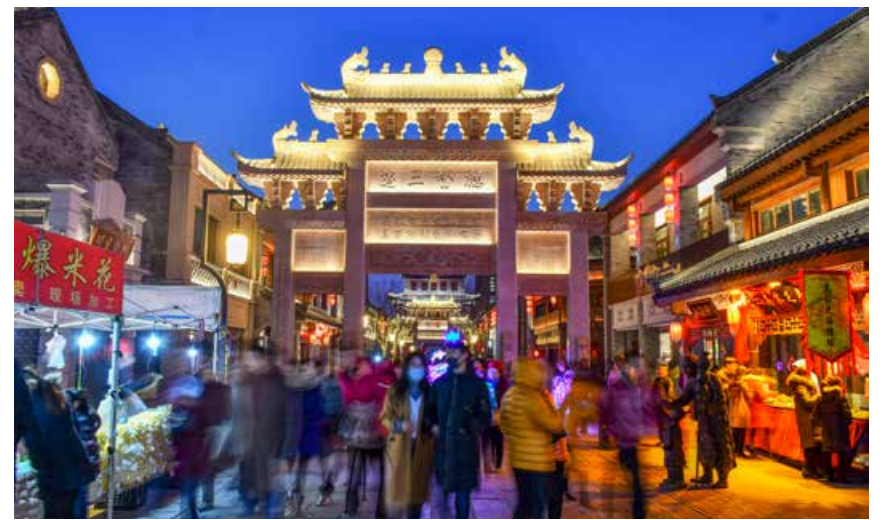
民谣节、过大年等节庆活动大放异彩，文旅融合频获好评，即墨古城成为人们心中念念不忘的向往之地。 Ballad festival, Spring Festival gala and other festival activities amaze people with brilliance; the integration of culture and tourism obtains numerous favourable comments; Jimo ancient city has become a desirable destination that people can not forget.

即墨古城建筑为体、文化为魂、商业为脉，这一座有生活温度的古城，从一开始就定位清晰，将现代城市生活与古城密切结合，有温度、有生活气息。到古城过大年，运游结合交通更加便捷，吃喝玩乐文化非遗样样精彩，千年古城厚重古朴又温暖开放，有历史有文化有民俗有韵致更有人情味，这样散发着浓浓韵味的即墨古城如何不让人寤寐思服、心心念之。