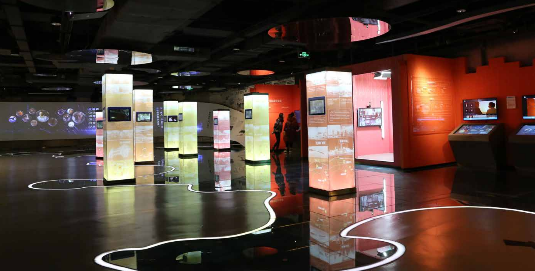
在地面的青岛地图上，一根根代表着电影在青岛取景地的光柱显得尤为突出。 On the ground map of Qingdao, the light pillars representing many film shooting locations seem rather eye-catching.