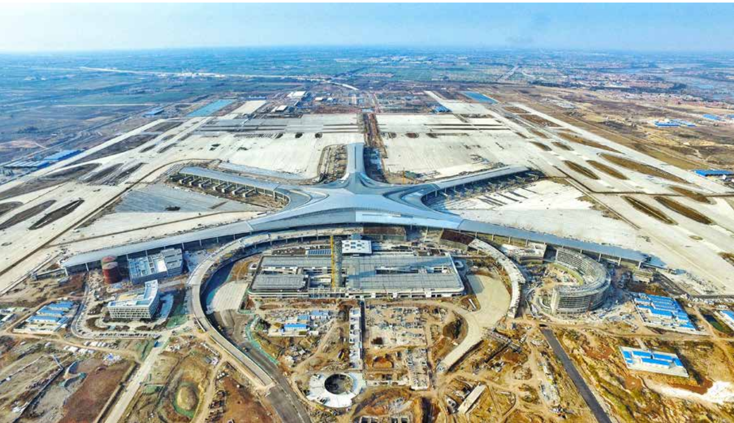
青岛胶东国际机场建设已进入“决战期”。 The construction of Qingdao Jiaodong International Airport has entered into the final stage.

战略推进工作组织积极借鉴国内外先进经验，推动青岛国际城市战略各项工作取得了积极进展。