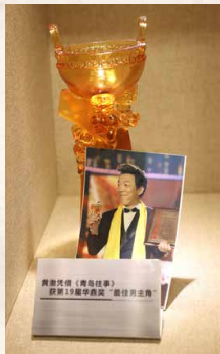
黄渤将自己的奖杯捐赠给博物馆。 Huangbo donated his trophy to the museum.