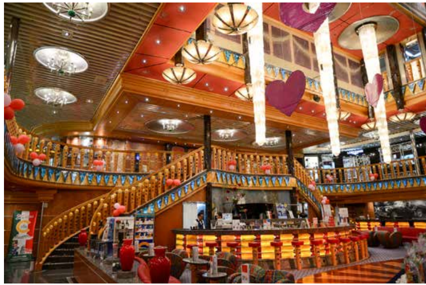
邮轮是座移动的海上城堡。(图/ 郦新军) Cruise is a moving castle on the sea.