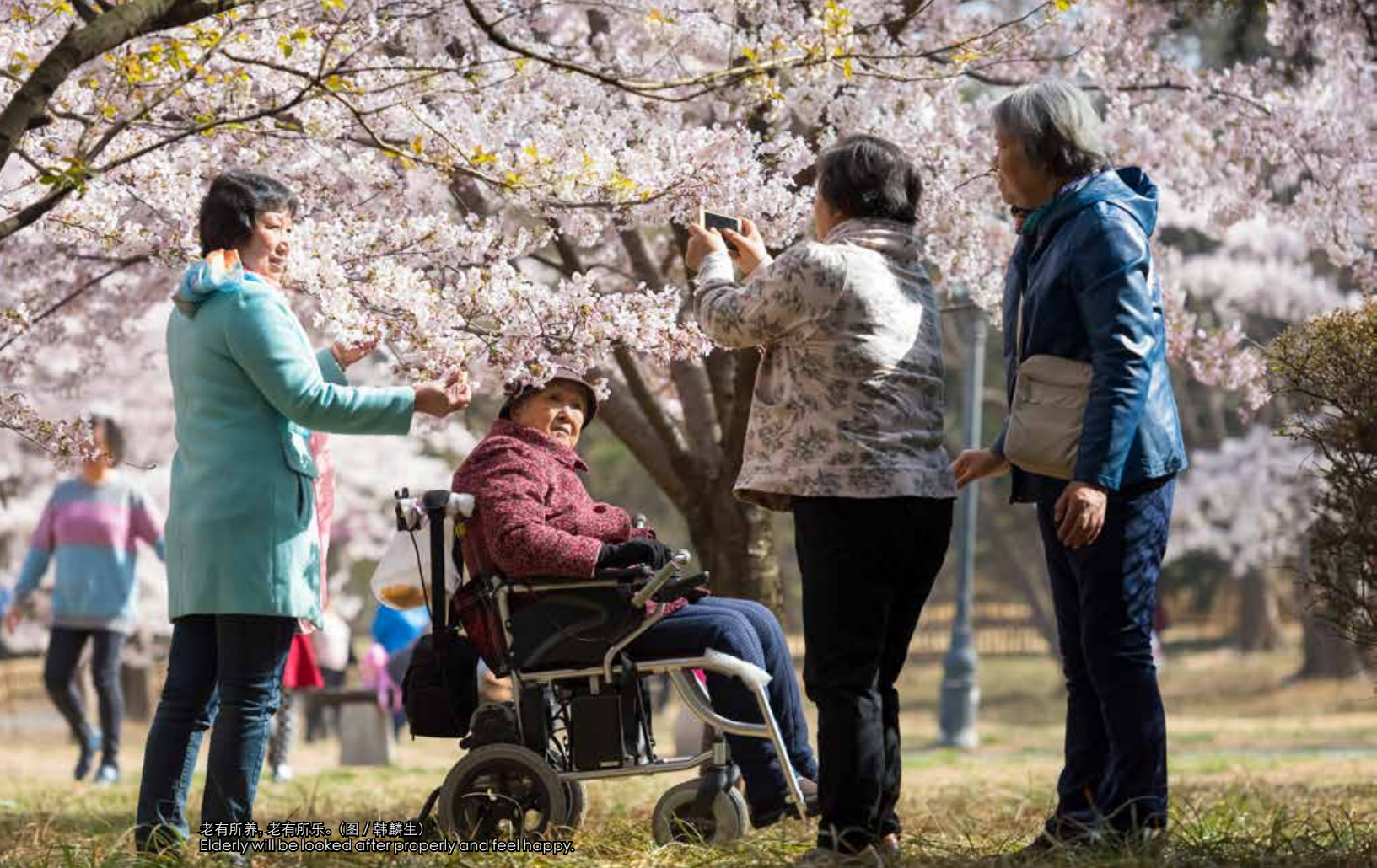
老有所养，老有所乐。 Elderly will be looked after properly and feel happy.

A series of practical work improves Qingdao people's livelihood