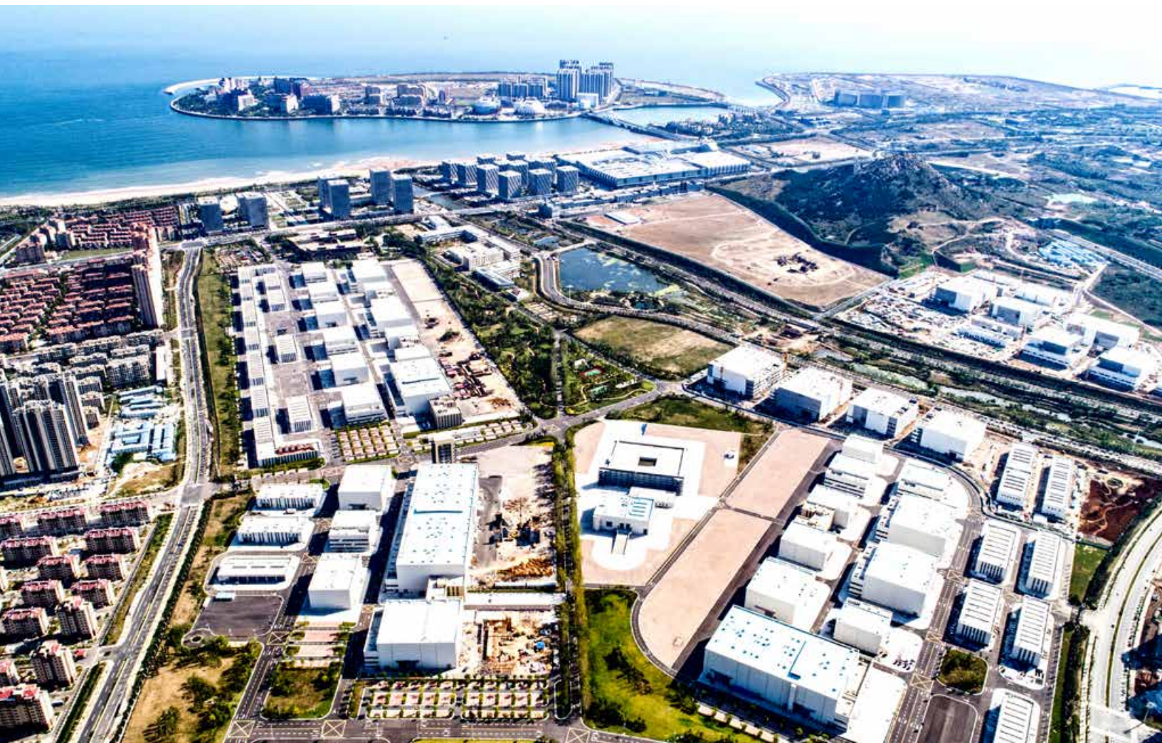
俯瞰青岛东方影都融创影视产业园。 A bird's eye view of Qingdao Oriental Movie Metropolis SUNAC Film and Television Industry Park.

A visit to the Oriental Movie Metropolis: blockbuster incubator