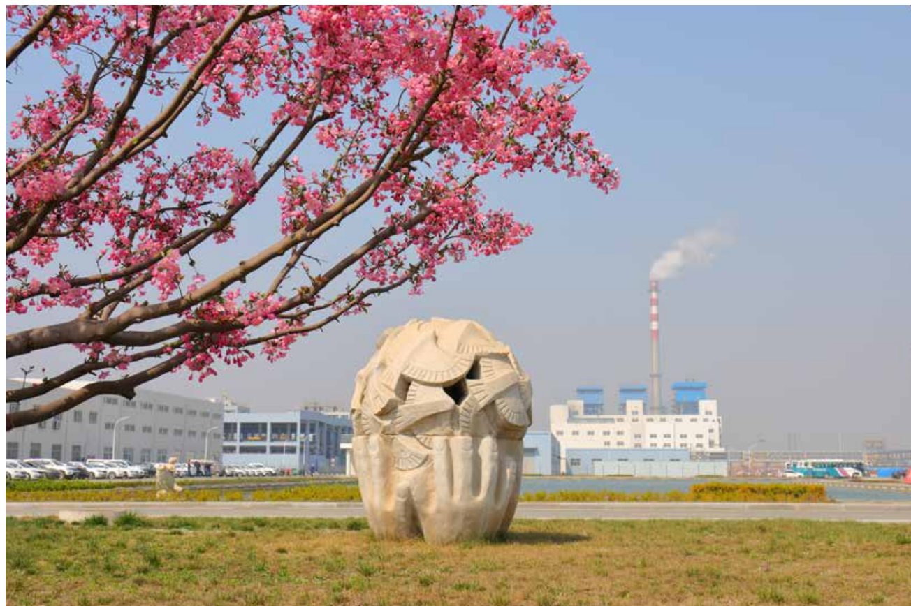
每一个角落都彰显着“绿色”工厂的品质。 Every corner is manifesting the quality of a “green” plant.

湾领导班子所拥有的智慧和眼光。老厂区所处地域早已无法满足企业寻求更大发展的需求，导致一些好的项目无法引进；电石法制PVC，受原料价格波动影响因素大，且物流半径过长，而致每年比同行企业多背负上千万元成本……这些制约公司做大、做强的问题无时无刻不在困扰着公司决策者。当更多的人似乎对已有成绩怡然自乐时，公司决策者却已在筹划着未来公司长远的战略布局。