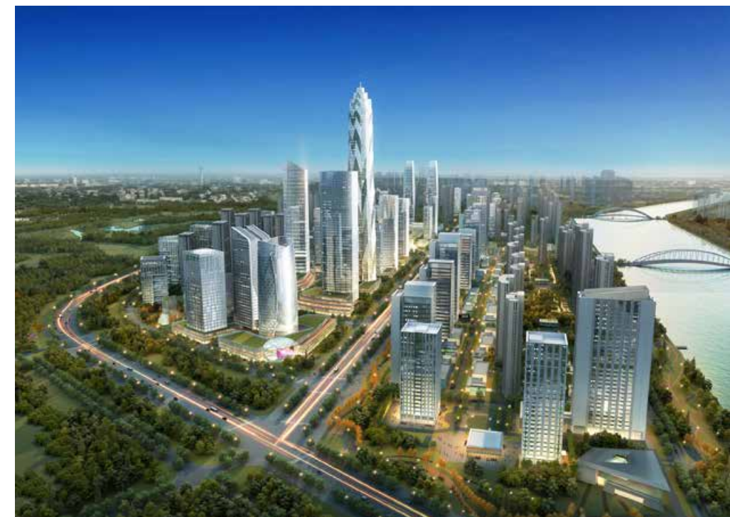
青岛海洋活力区鸟瞰效果图 Design sketch of Qingdao Marine Activity Zone from the overhead perspective.

融创中国是国内最大的持有型物业及文化旅游地产投资商，拥有丰富的城市开发运营经验，具备强大的资源整合