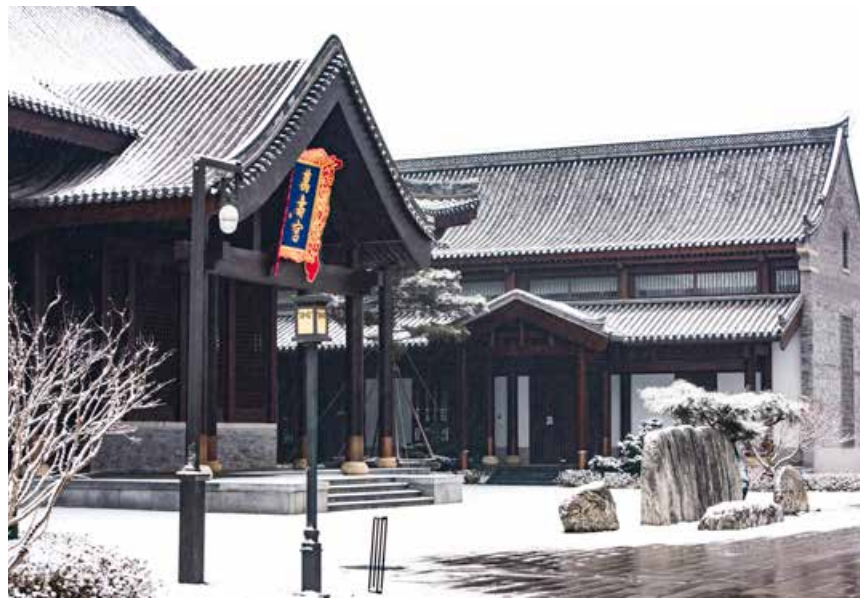
仿佛是一种历史的传承，从即墨古城一揭开面纱，就在人们的脑海中留下了深刻的历史人文印记。 Like a kind of inheritance of history, Jimo ancient city leaves a deep historical and cultural mark in people's mind the moment that it is unveiled.

说到古城，当然离不开那段历史。即墨，春秋战国时期为齐国名邑，秦代置县，隋朝建城，即墨大夫刚直不阿、田单破燕、田横五百士、郭琇三疏等典故让即墨昭彰史册。即墨县治自公元596年迁至现址，至今已有1400多年历史。战国时期，即墨已巍然屹立在齐国的东方，与西面的临淄遥相对峙，并夸富饶。即墨大夫的辉煌业绩，齐威王