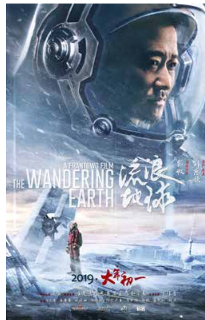
电影《流浪地球》海报 Poster of The Wandering Earth.

“东方影都拥有一流的影棚，设施先进，国外也没有这么好的设施。”经过全方位考量，中国科幻追梦人郭帆将《流浪地球》拍摄地定在青岛西海岸，开始了国内前所未有的置景尝试。青岛东方影都，成为中国科幻电影的摇篮。