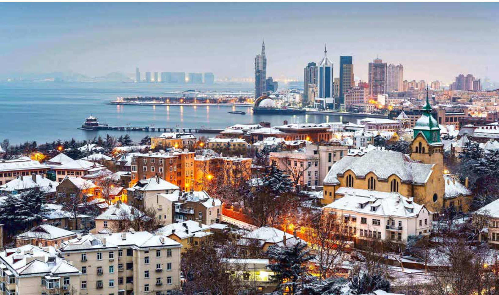
雪后的青岛，也成为了“网红景色”。Qingdao after snow becomes a famous scene on the internet.