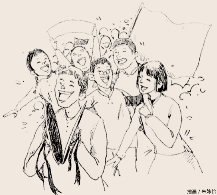
插画 / 朱姝怡

辅导老师，全靠“自悟”。可能受学理工科舅姨们的影响，哥哥对数理化情有独钟。有段时间，我们家订阅过《数学学报》《物理学报》，投递员惊讶又佩服地直打听，什么“高人”在看这种顶端学术杂志？在上海内燃机研究所工作的三舅每次来青岛看望母亲，同哥哥谈得最多的是数学。我记得当时他给哥哥推荐了一本日本数学家写的专著，后来哥哥去上海时居然在旧书店淘到了这本封面已经泛黄的“奇货”。文革末期，上高中的我赶上批林批孔，考试全部开卷，而且不在教室里答卷。考卷发给学生，带回家去做。我对数理化很“头疼”，脑子基本不开窍。即便是拿回家答题，也觉得很“痛苦”。这时哥哥帮我解了围，卷子由他负责做。高中两年，我的数理化考试实际都是哥哥帮着完成的。