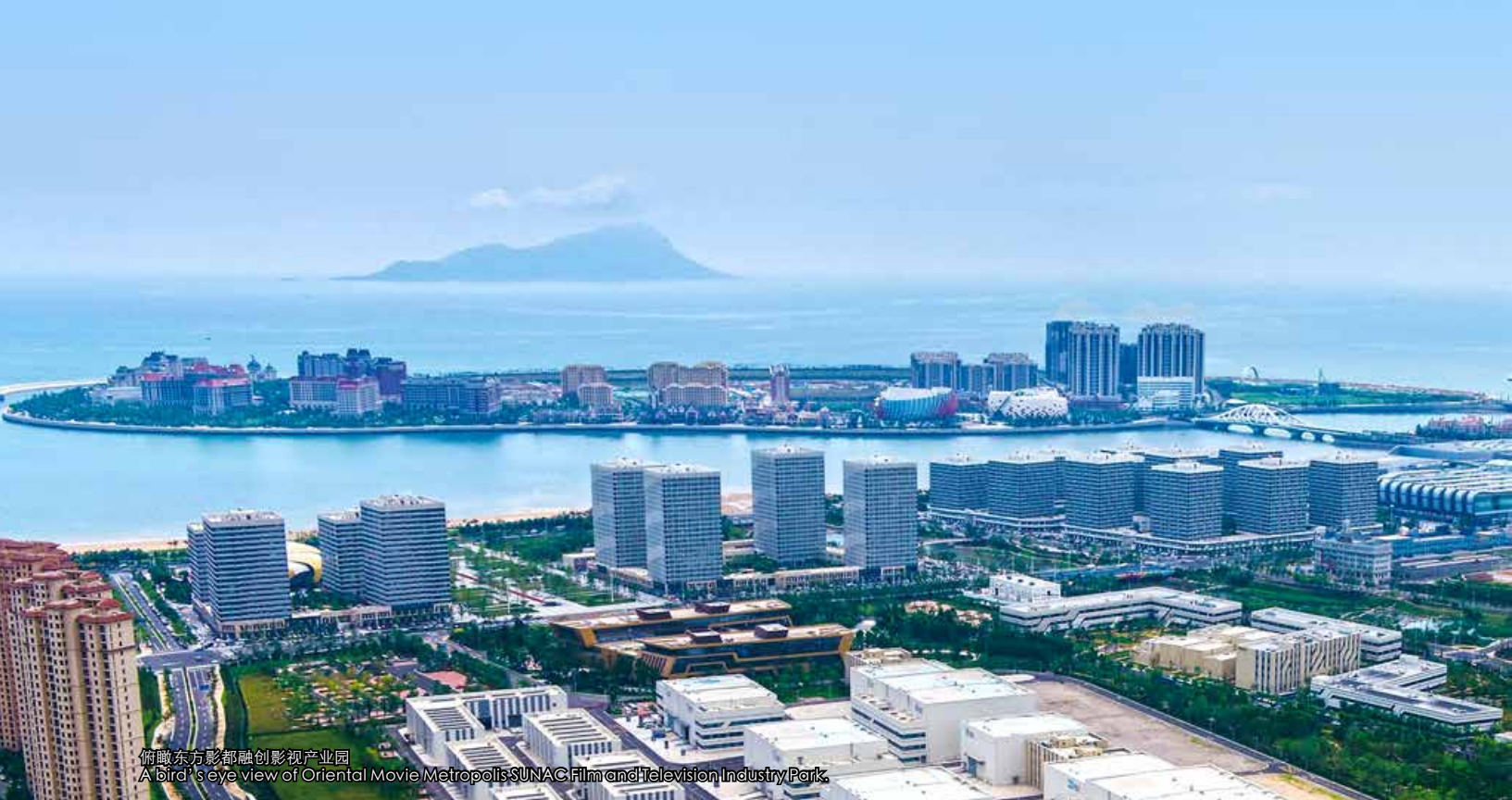
俯瞰东方影都融创影视产业园 A bird's eye view of Oriental Movie Metropolis SUNAC Film and Television Industry Park.