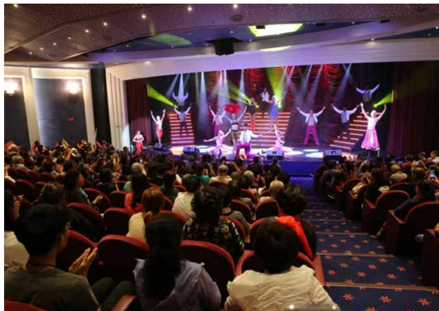
越来越多的人注重有品质的出游，集食住行游购娱于一身的邮轮旅行渐渐成为人们理想选择之一。 More and more people prefer "high-quality travel", and cruise trip that integrates catering, accommodation, travel, shopping and entertainment services gradually becomes one of the ideal choices for people.

在码头，前沿配套建设国际标准的邮轮母港客运中心，总建筑面积6万平方米，最高通关能力可达每小时3000至4000人次，年接待能力达150万人次。青岛邮轮母港出入境联检大厅配备了先进的检测设备，可同时满足两船同进同出。截至目前，青岛邮轮母港累计接待包括歌诗达邮轮、地中海邮轮、丽星邮轮、皇家加勒比邮轮、嘉年华邮轮等在内共290个航次，出入境邮轮游客34万人次。2018年，青岛还接待了星之传奇、维京邮轮、荷美邮轮等多个访问港航次，为邮轮游客提供了便捷的靠泊、通关和岸上观光服务，并在靠泊期间组织丰富多彩的活动。