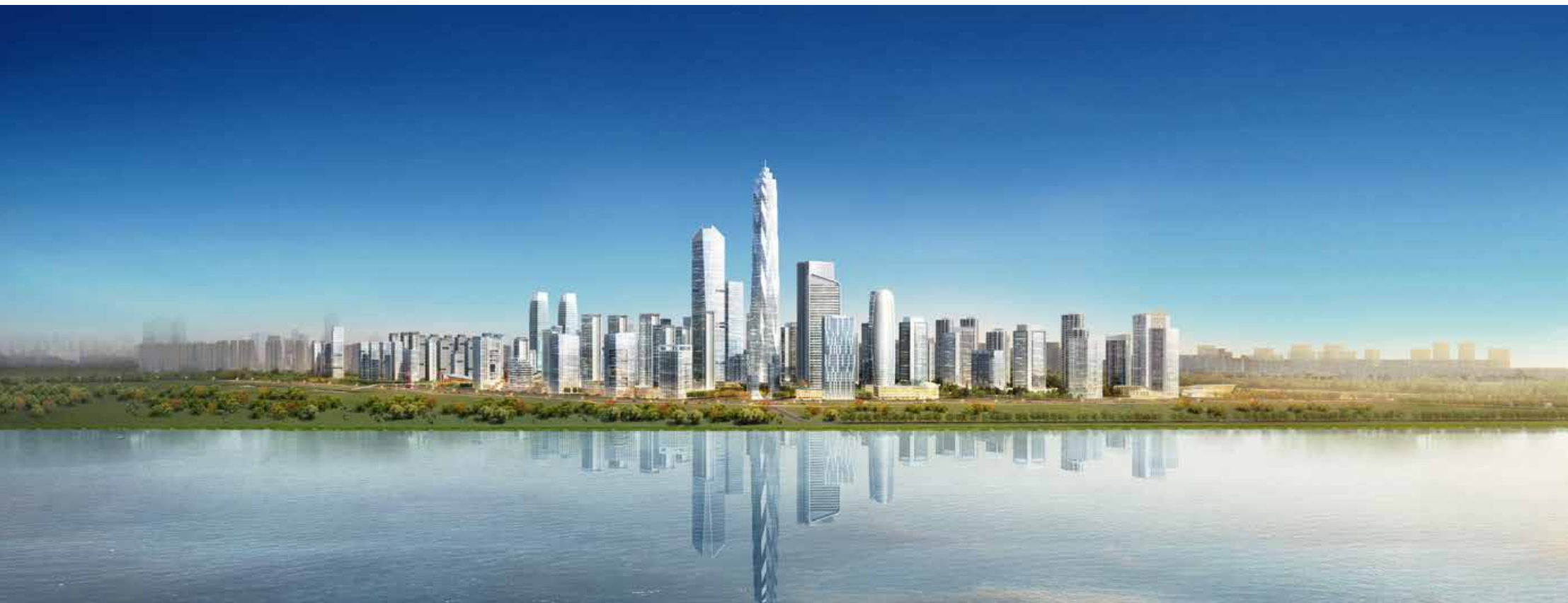
青岛海洋活力区效果图 Design sketch of Qingdao Marine Activity Zone.

Marine Activity Zone, "Future City" in Qingdao