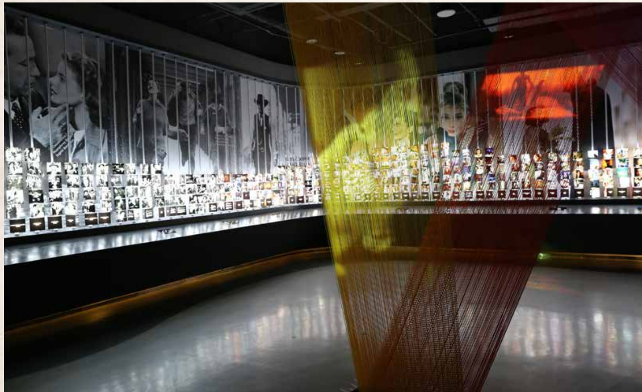
由彩色丝线组成的投影屏幕上，放映着从黑白到彩色时期的著名电影片段。 Famous movie clips, from black and white films to color films, are played on the projection screen made up of colorful silk threads.

元素，打造成为集展览空间、新闻发布、图书文创、影视餐饮、艺术影院等多种业态为一体的文化综合体。不定期更新展览内容，成立“影人俱乐部”，开设影视文化讲堂，是一处着力打造环境舒适、可供休闲娱乐与科教一体的新型艺术空间。