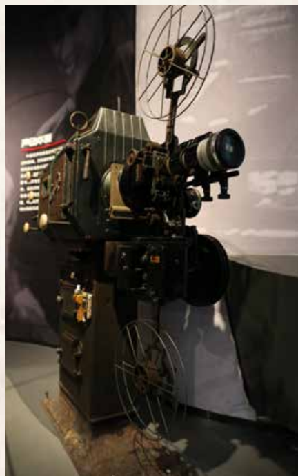
老式放映机。 Old-style projector.