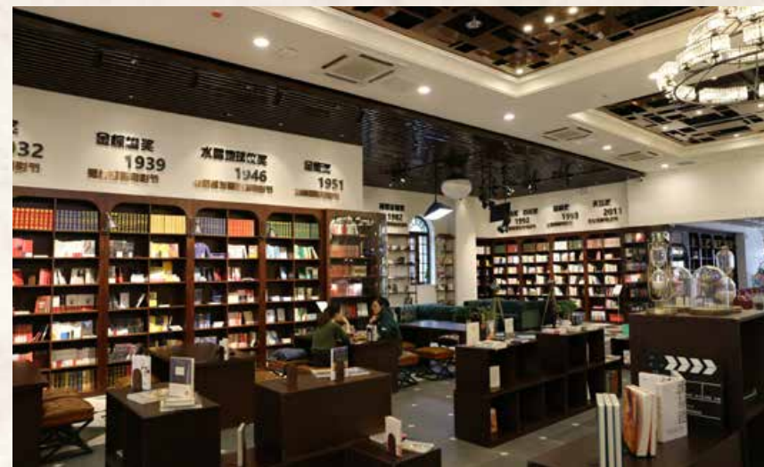
“拾光里咖啡”让人不禁想在这里小憩一下。 People cannot help stopping at “Shiguangli Cafe” and having a rest.

早在电影诞生之初，青岛就作为电影艺术的东方摇篮，沐浴了中国电影史上的魅力曙光。而今，青岛以“电影之都”的身份大放异彩，青岛电影博物馆不仅仅是参观电影经典记忆的场所，更是一场穿越历史走向未来的时光隧道。在此基础上，明星演员、导演在这里接受采访，参与活动，越来越多的孩子走进这里参加研学活动、一个又一个有层次、有内涵的展览在这里展出。电影博物馆，将“电影”的优势无线放大，通过这种媒介吸引更多的人。当代中国电影产业的发展势头强劲，厚积薄发的青岛也登上更广阔的舞台，作为灵山湾影视文化产业区汇聚电影文化的场馆，青岛电影博物馆将铭记镌刻每一个关于电影、关于青岛的珍贵瞬间。