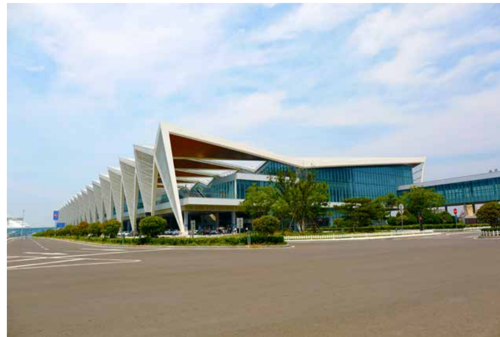
青岛邮轮母港配套建设国际标准的邮轮母港客运中心 Qingdao International Cruise Port is equipped with a passenger transport center of international standards.

青岛邮轮母港位于青岛港老港区6号码头，由青岛港集团投资建设，总投资约10亿元，共建有3个邮轮泊位，岸线总长度966米。其中，新建超大型邮轮泊位长490米，纵深95米，吃水-13.5米，可全天候停靠目前世界最大的22.7万吨级邮轮；2个原有泊位长度约476米，吃水-8米，可同时停靠2艘中小型邮轮。