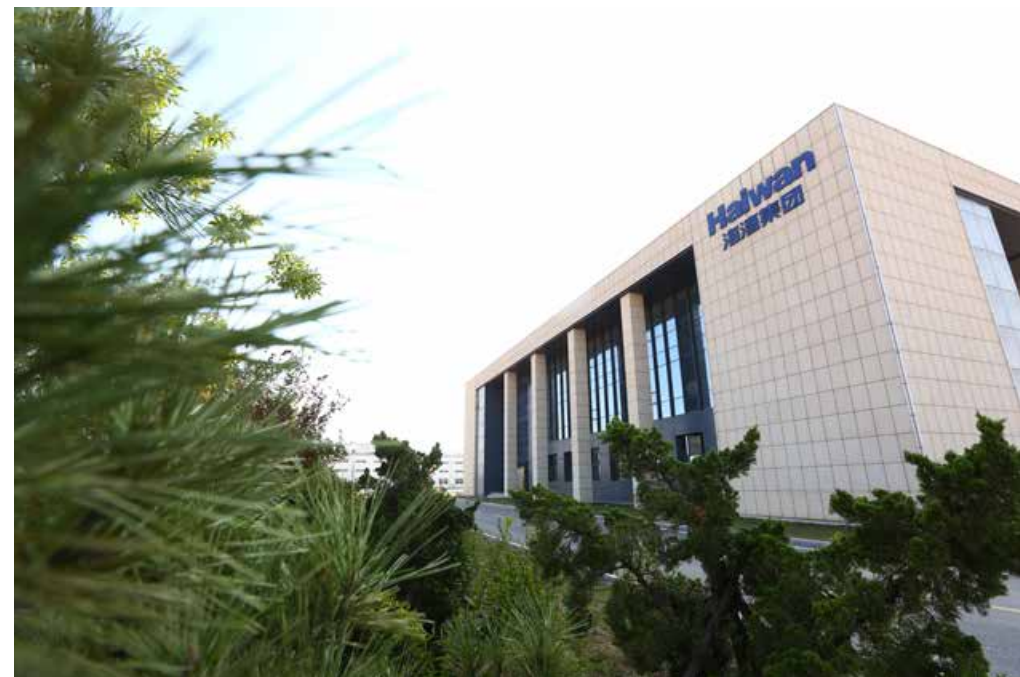
舒适而现代化的办公楼。 The comfortable modern office building.

谈及化工化学企业，你是否很难将其与“绿色”二字相连？但在青岛，有一个“例外”，它是海湾化学。走近位于青岛西海岸新区董家口经济区内海湾化学的园区，给人最直观的感受是宽阔而整洁的厂区、智能化的管理系统以及舒适而现代化的办公楼——似乎在每一个角落都彰显着“绿色”工厂的品质。