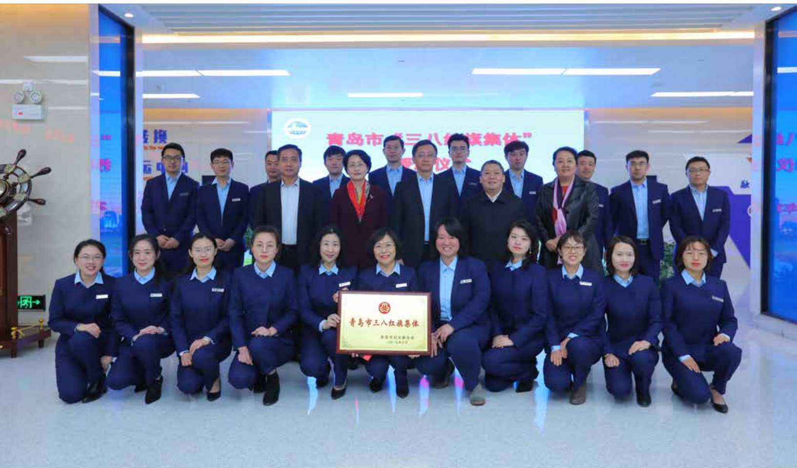
青岛国际航运服务中心工作团队以过硬的业务素质获各界赞誉，并获得青岛市“三八红旗集体”等荣誉称号。 By virtue of the excellent professional competence, the work team of Qingdao International Shipping Plaza has obtained praises from all circles and won many honorary titles including Qingdao "March 8th" Red-banner Group.

Qingdao International Shipping Service Center: Compile a new chapter for Qingdao's port and shipping industry, and start a new future for port development