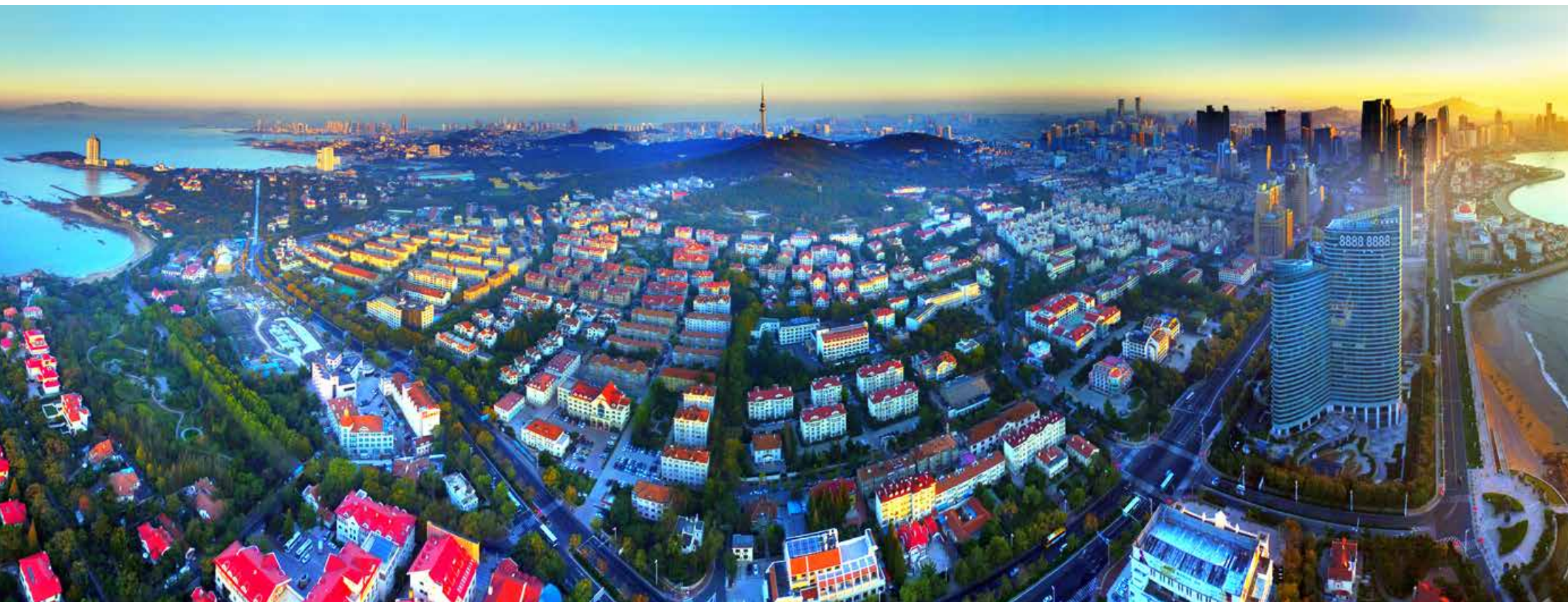
山海之城青岛 Qingdao — a city nestling under the mountain and beside the sea

Build an "Ecological Qingdao" and create a more livable environment