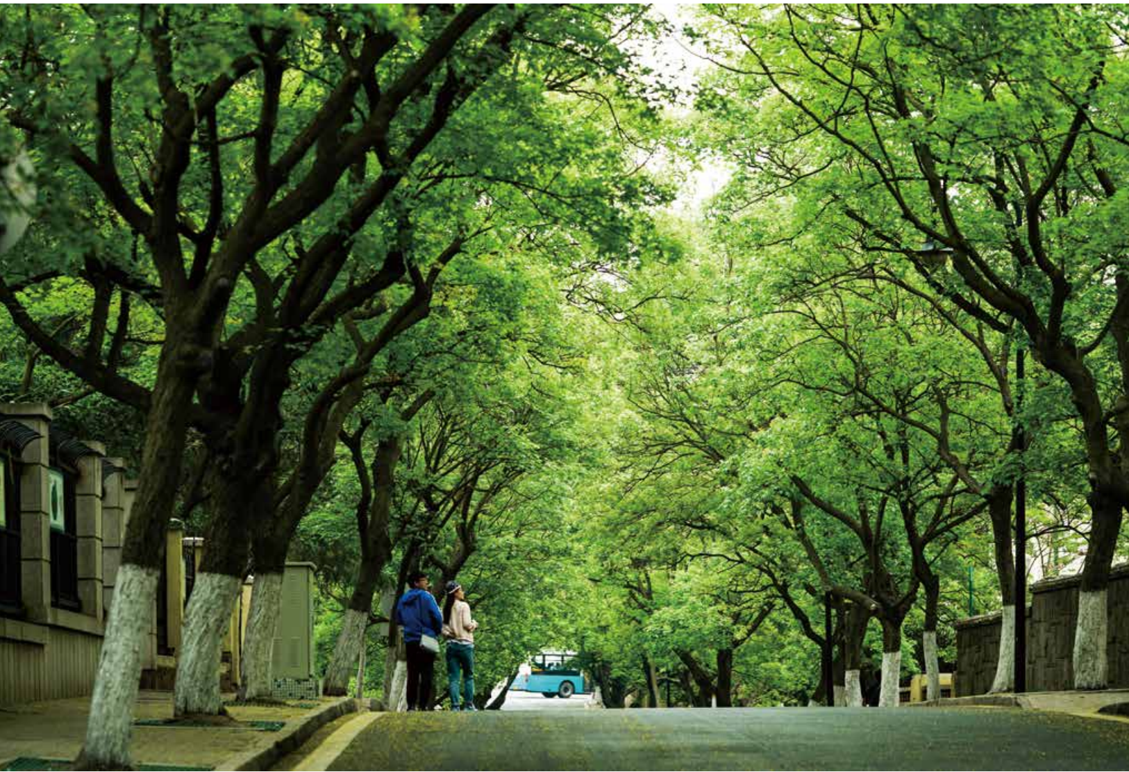
绿树成荫的八大关。 Badaguan with lines of trees.

科学技术合作奖, 15人受聘为青岛市政府特聘专家, 9人入选国家“千人计划”外专项目。