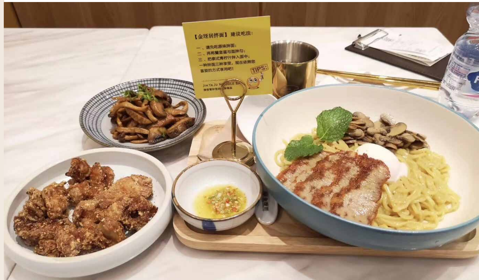
老面馆，是一座城市最温暖的底色，一碗面，是一座城市最原始的味道。 Old noodle shop is the warmest background color of a city, and a bowl of noodles is the most original taste of a city.

改变意味着进步、成长、兴盛。城市发展是如此，人生经历也一样。很多时候不单纯在于自身的实力大小，关键要有好运。我时常在想，好运从哪里来？如果当初没有“春天的故事”、没有一个个的禁区“突破”、没有一次次的改革与探索，人们身边会有那么多的好运相约而来吗？会有今天无数人的唏嘘、感慨和激动吗？