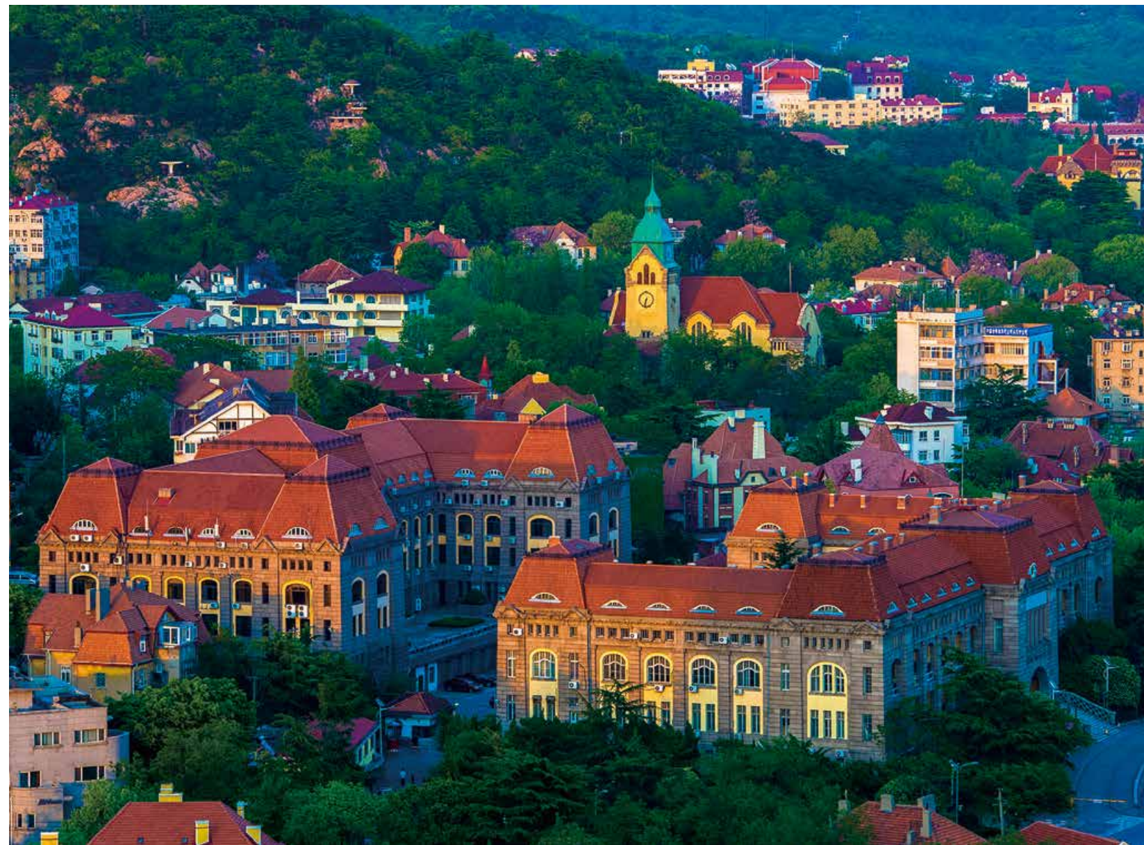
红瓦绿树的青岛，总令人不禁沉醉。 The red tiles and green trees in Qingdao always fascinate people.

第十六届中国国际人才交流大会在深圳会展中心落下帷幕。会上揭晓了2017“魅力中国——外籍人才眼中最具吸引力的中国城市”评选结果，青岛位