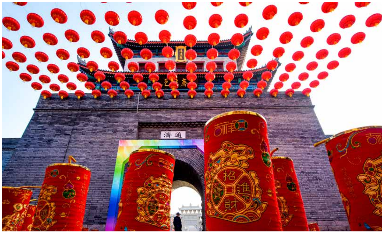
即墨古城不只是一座城，更是一座文化交流的平台，市民公共的会客厅。Jimo ancient city is not just a city any more, It is more a platform for cultural exchange and a public reception room for the citizens.

隍庙、财神庙、真武庙、牌坊街（21座牌坊）、教堂等公共建筑，打造“一城、两街、十景、十三坊”的整体格局，这些古建筑的复建都是参考史料记载，建筑的规格、模样力求全部还原，精益求精。一城：即古城：包括古城门楼、城墙、县衙等；两街：即牌坊街（东西门街）和南门街；十景：即淮涉八景：水阁临风、古寺塔影、锁龙泉石、长桥卧波、平沙清流、岸柳含烟、淮涉春浣、高堤垂钓等；十三坊：齐王田横坊、山海名邦坊、恩宠宪臣坊、总督三边坊、四世一品坊、亚魁坊、父子御史坊、世步青云坊、湖广总督坊、齐王田横坊、琅琊王氏祖脉坊。