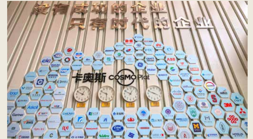
截至目前，卡奥斯已汇聚了4.3万家企业和390多万家生态资源，并孕育出建陶、房车、农业等15个行业生态。Up to now, COSMOPlat has gathered 43 thousand enterprises and more than 3.9 million ecological resources, and bred 15 industrial ecosystems, such as building ceramics, RV and agriculture.

陶、房车、农业等15个行业生态，在全国建立了7大中心，覆盖全国12大区域，并在全球20多个国家跨文化推广，助推全球企业的数字化转型。