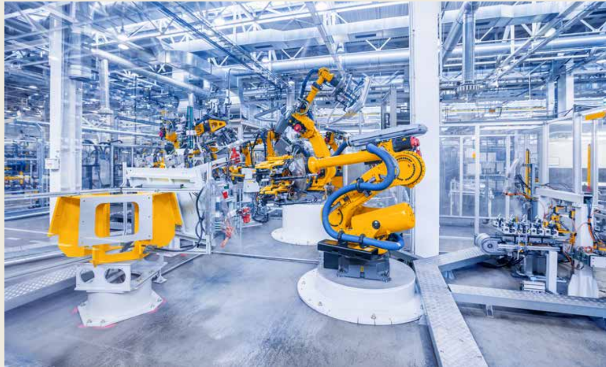
在未来，工业互联网的市场规模将迅速扩大，参与者也会越来越多。 In the future, the market scale of industrial Internet will expand rapidly with more and more participants.

价、建设和推广，工业互联网标准化体系建设，工业互联网标识解析节点建设以及工业互联网安全工作等一系列关键和基础环节都加大了支持。