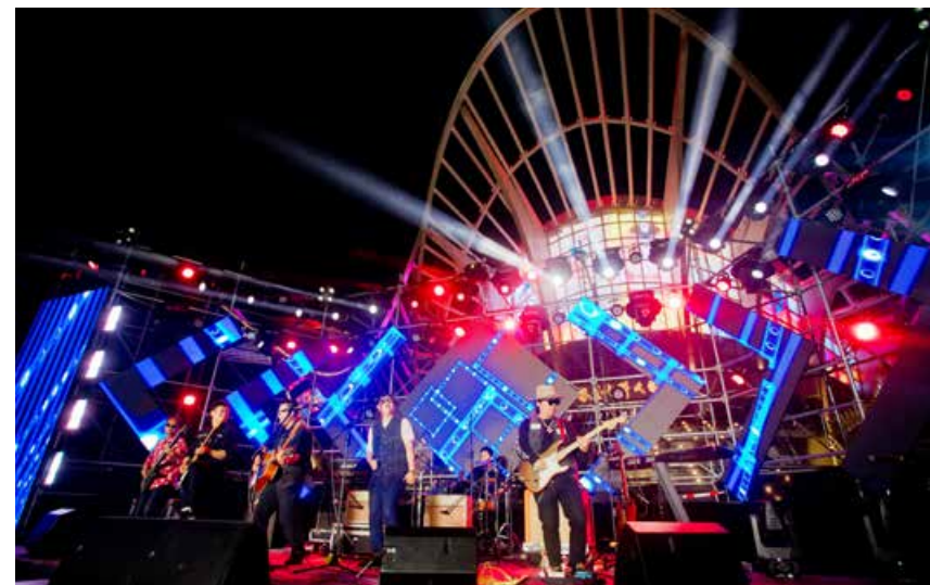
“在路上乐团”表演现场。 Scene of On the Road Band's Performance.