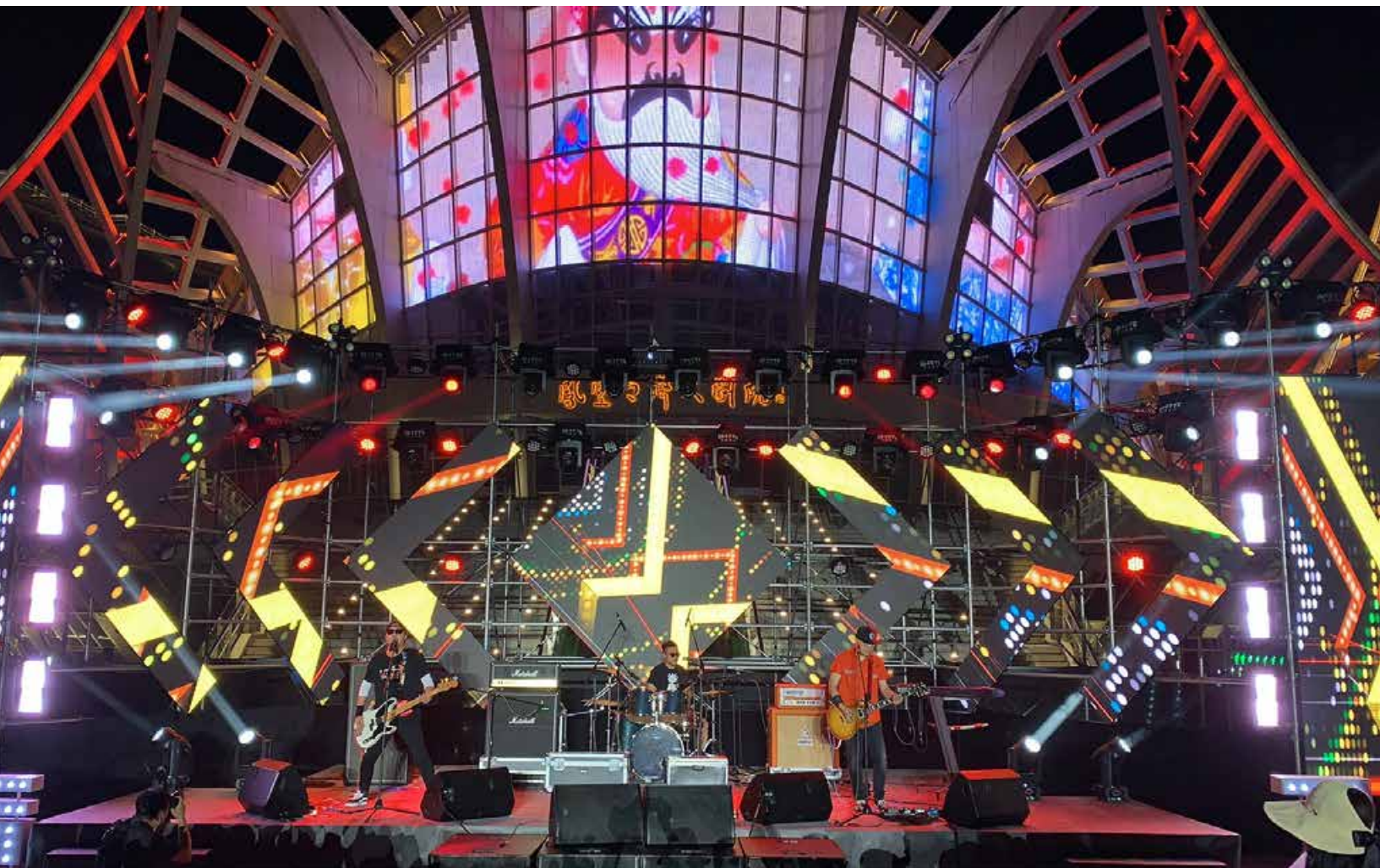
“ATM 乐队”表演现场。 Scene of ATM Band's Performance.

Qingdao local bands shine in the summer night