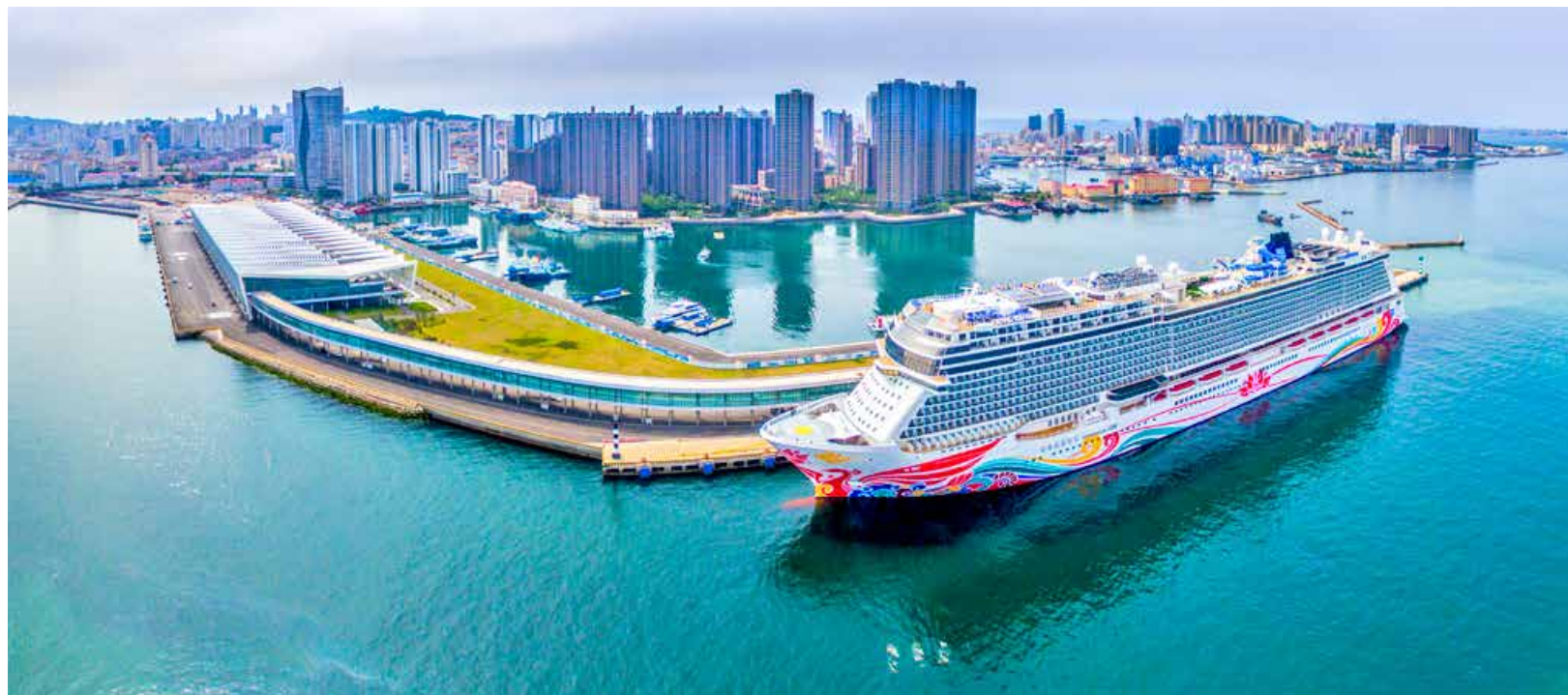
青岛国际邮轮母港 Qingdao International Cruise Home Port