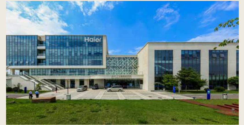
海尔工业智能研究院。 Haier Industrial Intelligence Research Institute.

于是，有着敏锐的时代洞察力的海尔，在 2005 年，就开始运用互联网思维，锁定数字时代用户不断涌