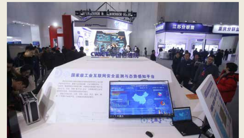
国家级工业互联网安全监测与态势感知平台。National industrial internet security monitoring and situation awareness platform.

At present, nurtured by the deep integration of network information technology and industry, and driven by new industrial forms featured digitization, networking and intelligence, the industrial Internet is booming, and has become the common choice for major industrial countries to seize the commanding heights of international manufacturing competition and seek new economic growth points.