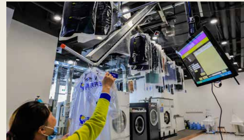
海尔衣联网 001 号店为用户提供了洗衣机零售、“生态配件”零售、衣物服务、用户信息反馈四位一体的衣物智慧物联解决方案。

“洗衣先生”的对面是“智慧生活馆”，通过整合行业的优质生态资源，这里有国际级的量体大师进行