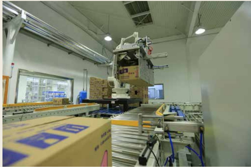
圣元营养食品有限公司拥有现代智能化生产线，生产全过程实现自动化控制。 Synutra International Inc. has a modern intelligent production line with the whole production process realizing automatic control.

柜为核心产品，主要采用面向企业客户的销售模式，为客户在销售终端进行低温储存、商品展示和企业形象展示等提供定制化解决方案及专业化服务。其物联网商用冷柜数字化车间项目2017年获批青岛市互联网工业“555”项目。该项目在原有设备厂房的基础上进行技术升级改造，充分考虑智能化、自动化、信息化元素，产品设计、制造、交付全流程体现数字化理念。