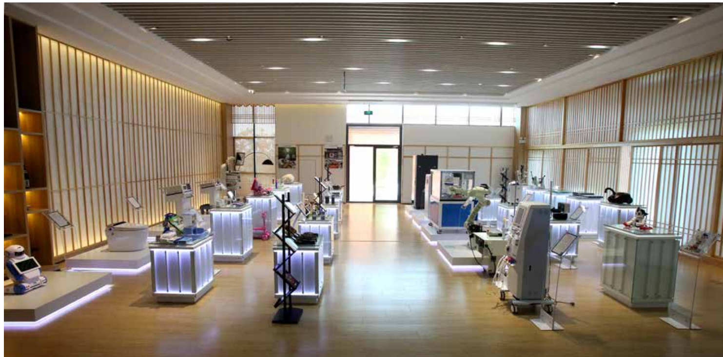
青岛日本“国际客厅”是日本企业进入中国的一个全新窗口。 Qingdao International Business Club (Japan) is a new access for Japanese enterprises to China.

Take Qingdao International Business Club (Japan) as the starting point to build a pilot region in Qingdao for Shandong-Japan cooperation