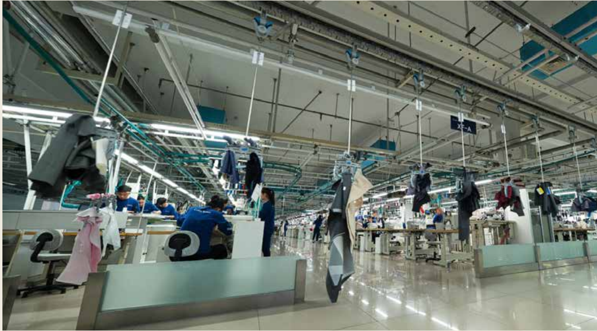
酷特产业互联网在服装定制细分领域达到世界领军地位。 Kutesmart's industrial Internet leads the world in differentiated garment customization.

工厂 500 家以上。酷特目前的订单主要来自两大平台：一是直接针对终端客户的 APP、小程序、线上旗舰店等，它让品牌直接面对客户，让酷特全球定制供应链工厂直接从平台上获取订单；二是大众创业平台，即酷特将定制平台和供应链能力向社会开放，创业者创立自己的品牌公司，应用酷特定制平台、量体系统等，可以直接为客户提供产品定制设计、下单等整套操作服务，酷特供应链负责产品的交付。平台降低了创业门槛和创业风险，免除传统创业模式的后顾之忧，给懂营销、爱时尚的创业者带来更多创业机会。目前平台孵化入驻的国内外创业品牌公司有 9000 家以上，酷特培训考核合格的量体师有 5000 名以上，促进了服装定制行业发展。