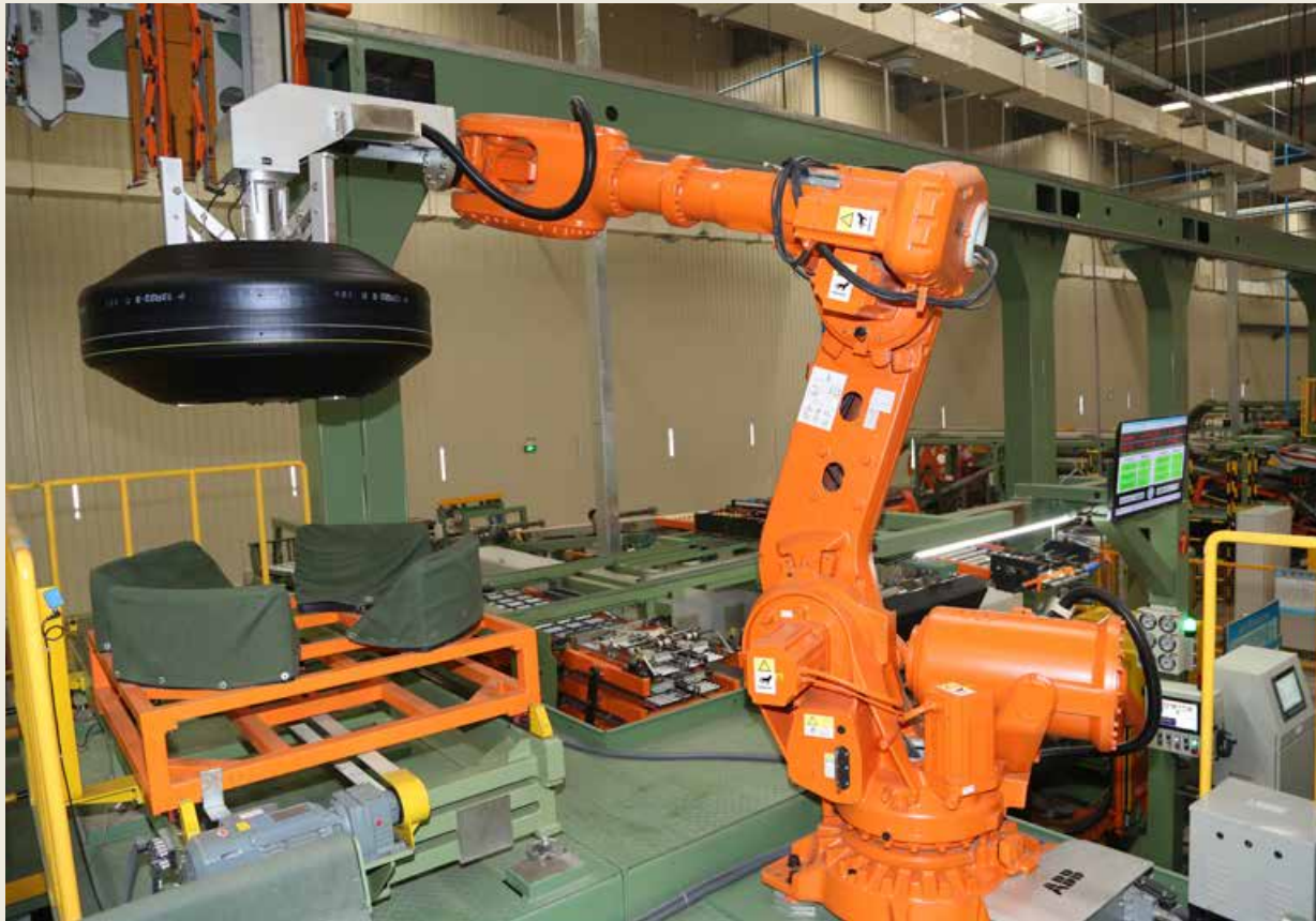
双星的“胎联网”生态体系，为用户提供定制化、高质量产品的同时，共同打造基于物联网、人工智能、5G、用户需求说明技术的胎联网“智慧云”平台。 Double Star's "Internet of Tire" ecosystem provides users with customized and high-quality products, and jointly creates the Internet of Tire "intelligent cloud" platform based on the Internet of things, artificial intelligence, 5G and user requirements specification technology.