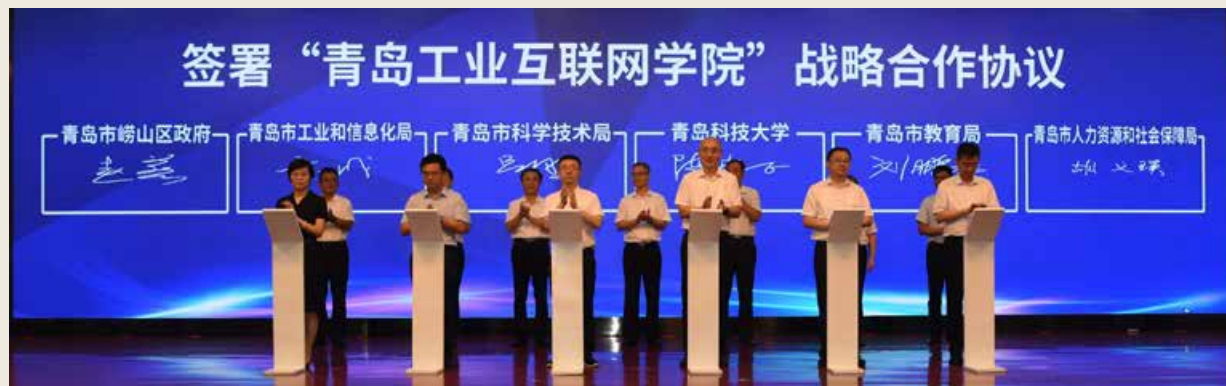
青岛工业互联网学院共建方签署战略合作协议。 The co-sponsors of Qingdao Institute of Industrial Internet signed a strategic cooperation agreement.

the industrial Internet industry, promote the innovation and transformation of key generic technologies in the industrial Internet industry. It will also provide talent and intellectual support for Qingdao to build “the capital of the global industrial Internet”, for Shandong to construct a national industrial Internet development leading area and a demonstration area of innovation-driven integrated application; and eventually boost the development of industrial Internet in China.