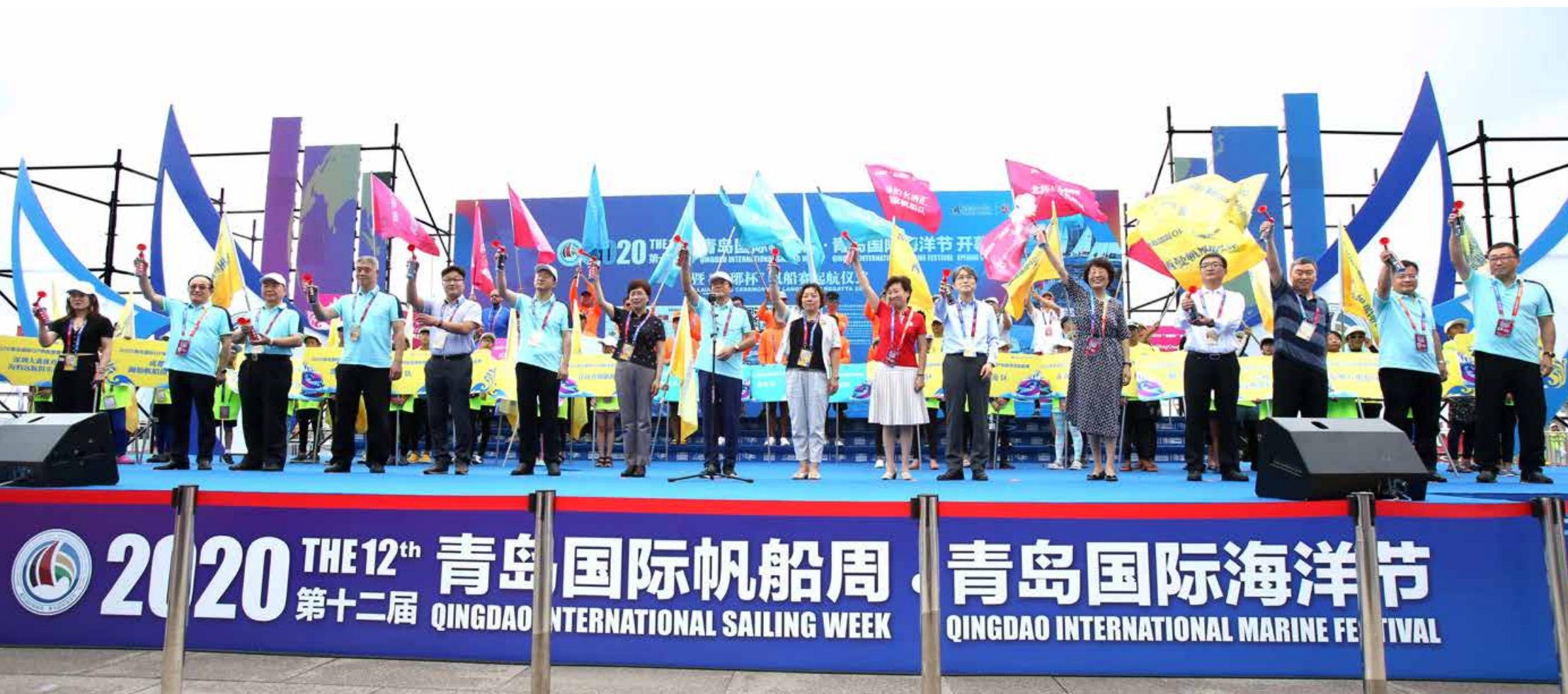
8月8日，以“传承奥运，扬帆青岛；科学战疫，体盛民康”为主题的2020第十二届青岛国际帆船周·青岛国际海洋节在青岛奥帆中心举行。 On August 8, the 12th Qingdao International Sailing Week · Qingdao International Marine Festival 2020 was held in Qingdao Olympic Sailing Center with the theme of “carrying on Olympic spirit, sailing in Qingdao, fighting the pandemic scientifically, developing sports and enhancing people’s health”.