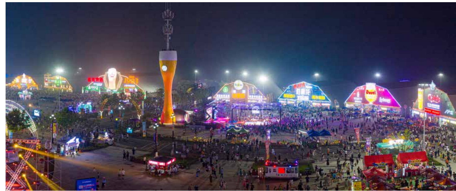
金沙滩啤酒城啤酒大篷区夜景。 Night view of the Stars Avenue in Golden Beach Beer City.