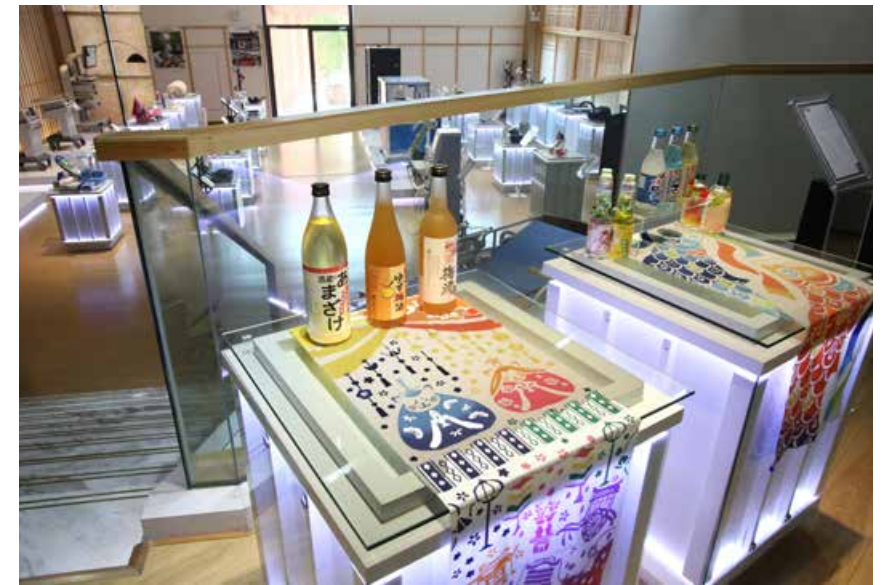
日式风格的展厅内陈列着特色浓郁的日本商品。（组图） Products with distinct Japanese characteristics are displayed in the Japanese style hall.

In the Japanese-style exhibition hall, robots, electronic products, medical equipment, sake and other goods full of Japanese features are displayed. Meanwhile, the conference room, multifunctional media room, business meeting room, Japan-related information reading room, rest area and office area provide