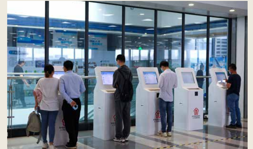
智能制造专场招聘会为企业和应聘者搭建了桥梁。 The special recruitment fair of intelligent manufacturing builds a bridge between enterprises and candidates.