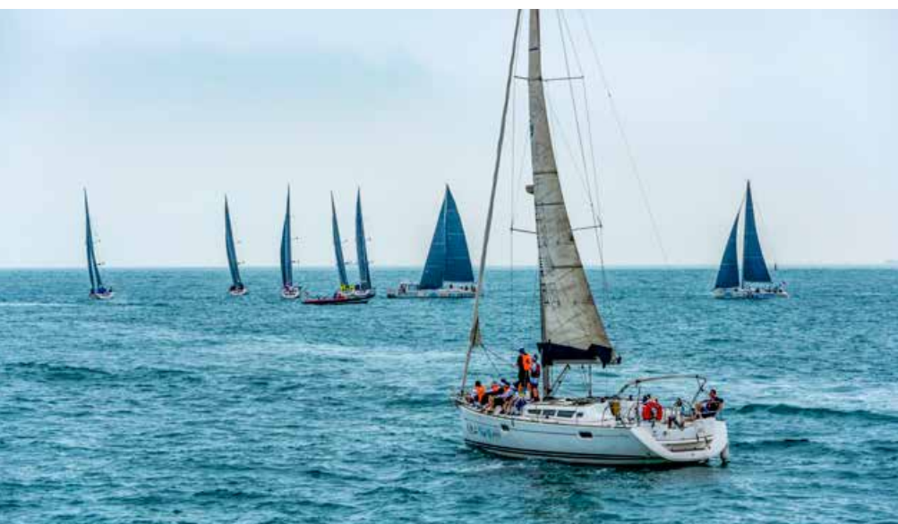
通过赛事加强了沿海各城市之间的时尚体育交流。 Through the event, the fashion sports exchanges between coastal cities have been strengthened.

增量、延长产业链，与不同品类业态深入合作，构建帆船产业云生态，实施品牌协同、融合发展，通过体育创意赋能城市发展，与城市文创平台深度嫁接，让“帆船之都”城市品牌效应聚合更多社会品牌力量，让时尚的体育基因，汇聚更多的社会品牌，创造出更加开放的合作平台。在此基础上，首次推出全国首个必胜客“帆船之都 扬帆必胜”主题餐厅、可口可乐公益环保活动等多项专属活动。近30家企业及社会组织参与，对帆船周·海洋节筹备工作给予大力支持，力求激活时尚体育发展动力，多维促进全民健身和体育消费。