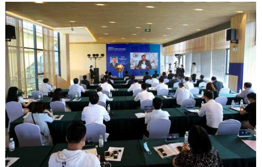
“对话山东—青岛市中日城市合作交流会”现场。 Scene of “Dialogue with Shandong - Sino-Japan City-to-City Cooperation and Exchange Conference (Qingdao)”

institutions and enterprises cooperating with Japanese organizations with convenient plans and hardware solutions to do business. Recently, “Dialogue with Shandong—Cooperation Exchange between Chinese and Japanese Cities” was held in Qingdao International Business Club (Japan) in Qingdao West