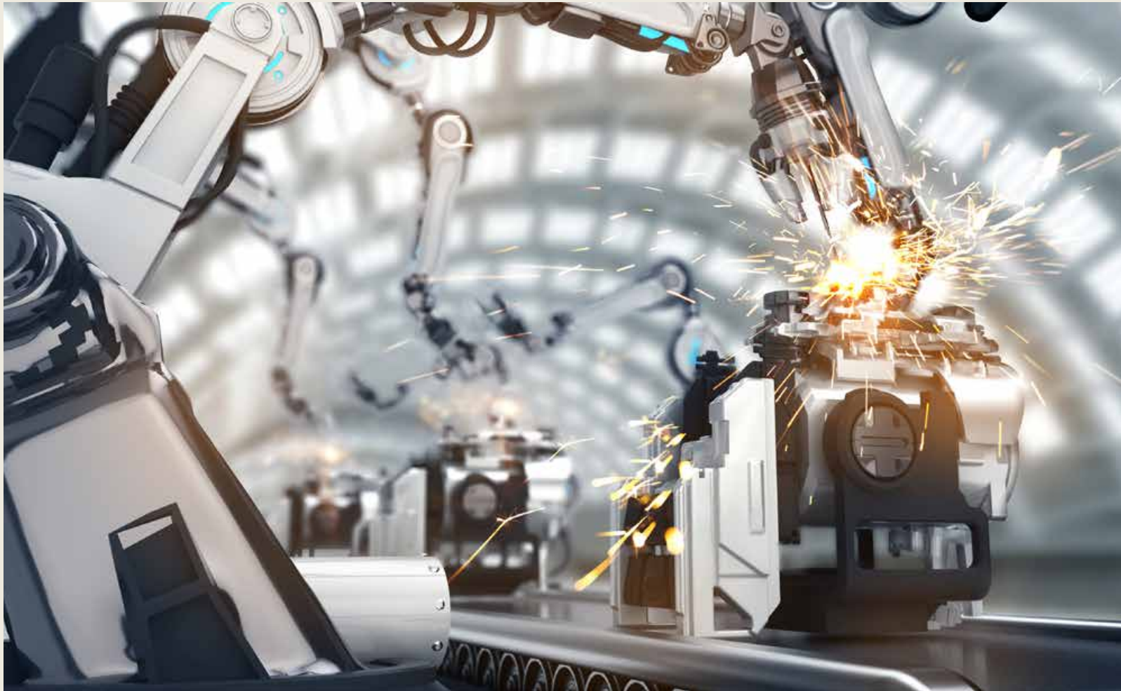
工业互联网在中国终于迎来落地实践的加速期。 The industrial Internet has finally ushered in the accelerated period of landing practice in China.