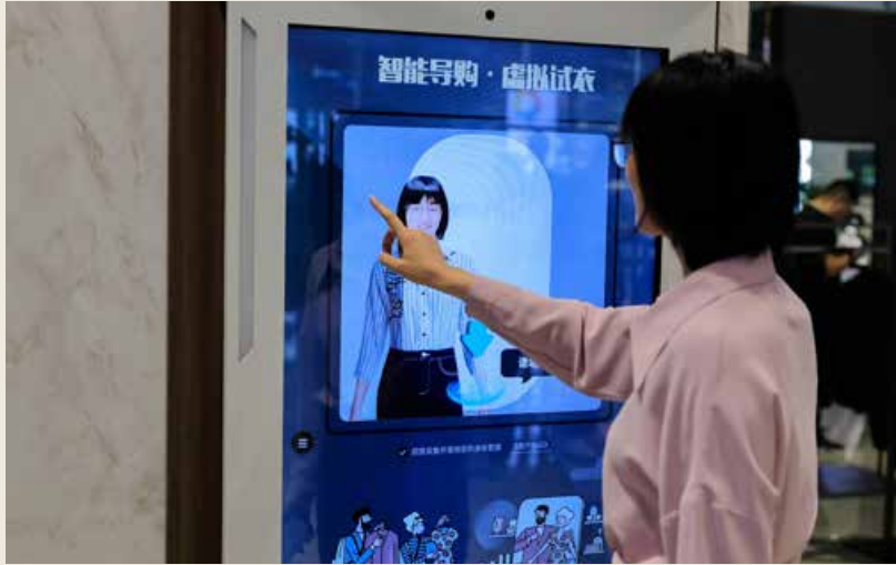
海尔以洗衣机产品为媒介，与用户在社群中交互出多元化、个性化的需求图谱。 Taking washing machine products as the media, Haier interacts with users in the community to create a diversified and personalized demand map.