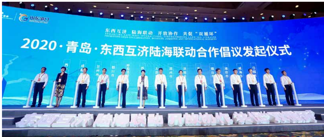
沿黄九省（区）省会（首府）城市、胶东经济圈五市共同发起2020·青岛·东西互济陆海联动合作倡议。 The capital cities of nine provinces and regions along the Yellow River and the five cities of Jiaodong economic circle jointly launched the collaboration initiative to enhance east-west interactions and land-sea linkages.

位于青岛市市南区CBD商圈，东临市政府，西接八大关风景区，南面浮山湾奥帆中心，北依湛山寺森林公园，集商务、会议、餐饮、娱乐、度假于一体，是商务差旅、休闲旅行住宿的极佳选择。酒店曾作为2008青岛帆船赛、2018上合组织青岛峰会、人民海军成立70周年多国海军活动媒体接待酒店及2019跨国公司领导人青岛峰会官方唯一接待酒店，成功完成接待任务，受到社会各界和媒体记者的一致好评。