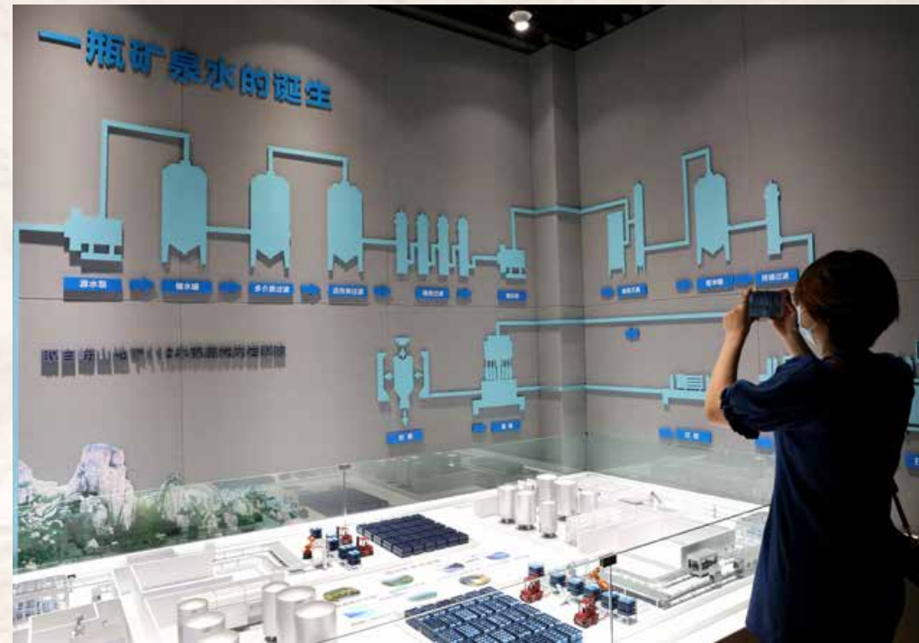
博物馆内分为5大展区，分别为万年古冰泉、产品矩阵墙、百年展厅、工厂生产线、远航未来，陈列近千余种展品。 The museum is divided into five exhibition areas, namely, Ancient Ice Spring, Product Matrix Wall, Centennial Exhibition Hall, Factory Production Line and Set Sail for the Future, displaying over one thousand exhibits.

The century meeting between Laoshan Mineral Water and the "red house"