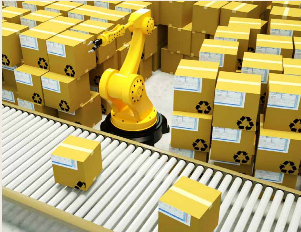
作为“5G+工业互联网”的一个重要应用场景，智慧仓储是实现智能制造的基础能力。 As an important application scenario of "5G + industrial Internet", intelligent warehousing is the basic ability to realize intelligent manufacturing.