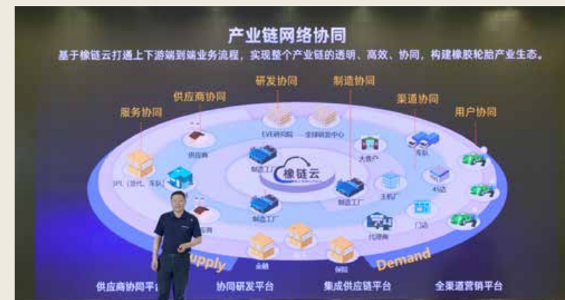
赛轮“橡链云”平台已经沉淀的成熟软件产品和橡胶行业解决方案近百套。 Sailun's Eco-Rubber Cloud Platform has nearly 100 sets of mature software products and rubber industry solutions.

定制服装是酷特产业互联网的一个版块，其C2M商业模式具体理解为：C端是面向客户的多品类产品定制平台，目前可提供梭织服装、针织服装、皮具箱包、面料辅料、配饰配件等多品类产品；M端是酷特及其整合的全球定制供应链体系，目前有原创设计和定制生产能力的