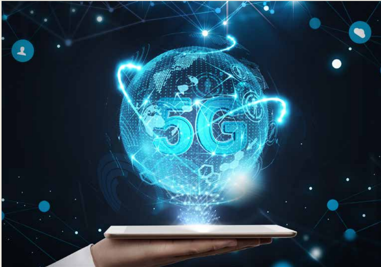
5G 网络奔腾不息的数据流，无死角覆盖了车间的生产数据采集和供应链管理，降本增效成效显著。The continuous data flow of 5G network seamlessly covers the workshop's production data collection and supply chain management, reducing costs and increasing efficiency in a significant way.