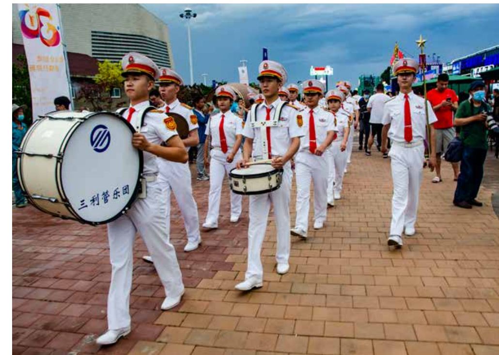
作为中国十大节庆活动之一，青岛国际啤酒节已走过30年辉煌历程。(图/王云胜) As one of China's top ten festivals, Qingdao International Beer Festival has gone through 30 years of brilliant history.