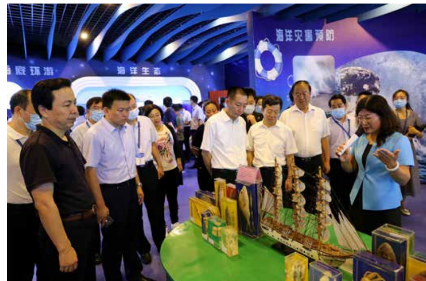
培训期间，全体学员对青岛的4个文明城市创建点位进行实地考察。 During the training period, all the trainees had site visits to the four locations of civilized city construction in Qingdao.

科学高效的体制机制，是文明城市创建的重要基础。各地要注重统分结合，努力确保文明城市创建工作走深走实。领导体制要有力，文明城市创建是“一把手”工程，确保主要领导负总责，分管领导靠上抓，形成一级抓一级、层层抓落实和纵向到底、横向到边的全方位、科学化创建领导模式。联动机制要顺畅，建立健全各级各部门之间纵向和横向协调配合机制，在部门与县市区之间建立密切沟通渠道，整合优势资源，强化统筹协调，实现条块结合、互为补充的无缝衔接，形成同创共建工作格局。监督机制要管用，注重发挥人民群众主体作用，