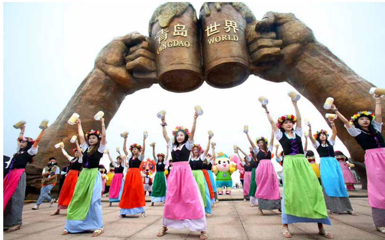
第30届青岛国际啤酒节西海岸会场开城仪式。 The opening ceremony of the West Coast venue of Qingdao International Beer Festival.