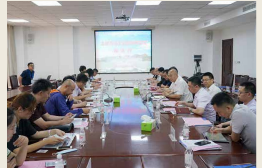
“走进青岛工业互联网学院”媒体行。 Media Action of “Entering the Qingdao Institute of Industrial Internet”.

都，就是要形成包括大数据、云计算、人工智能、芯片、传感器、区块链、产业数字金融、细分产业工业互联网平台、网络安全技术、工业互联网科技应用服务等产业在内的工业互联网全产业链生态，这离不开强有力的人才队伍支撑。青岛工业互联网学院的作用正在于此，只有进一步优化学科设置，把人才培