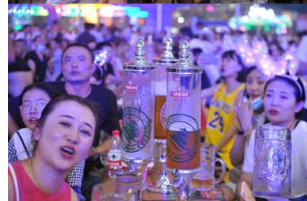
金沙滩啤酒城的9个国际啤酒大篷为广大游客提供40多个国家和地区的1500余款啤酒。(组图) The nine international beer tents in the Golden Beach Beer City has served tourists with some 1500 kinds of beer from over 40 countries and regions.