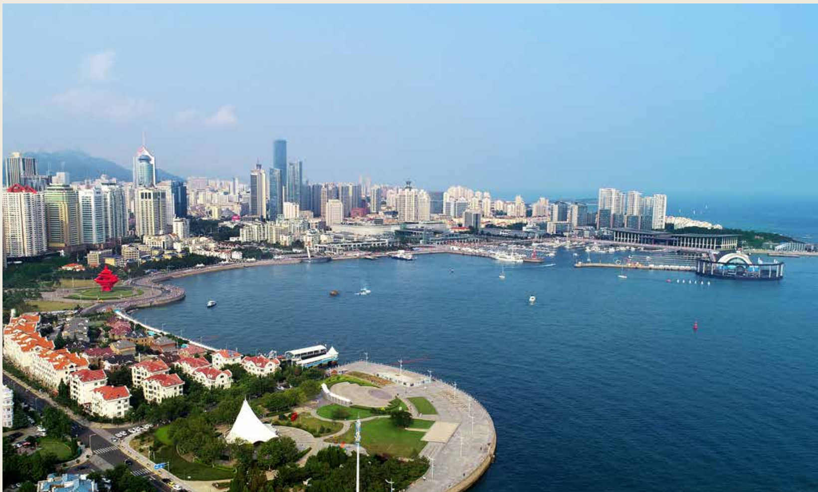
面对工业互联网浪潮，青岛积极谋划、主动出击，在今年年初提出打造世界工业互联网之都的目标，努力抢占发展制高点。 In the face of the industrial Internet wave, Qingdao actively makes plans and takes actions. At the beginning of this year, it proposed the goal of building the capital of the world industrial Internet, striving to seize the commanding height of development.