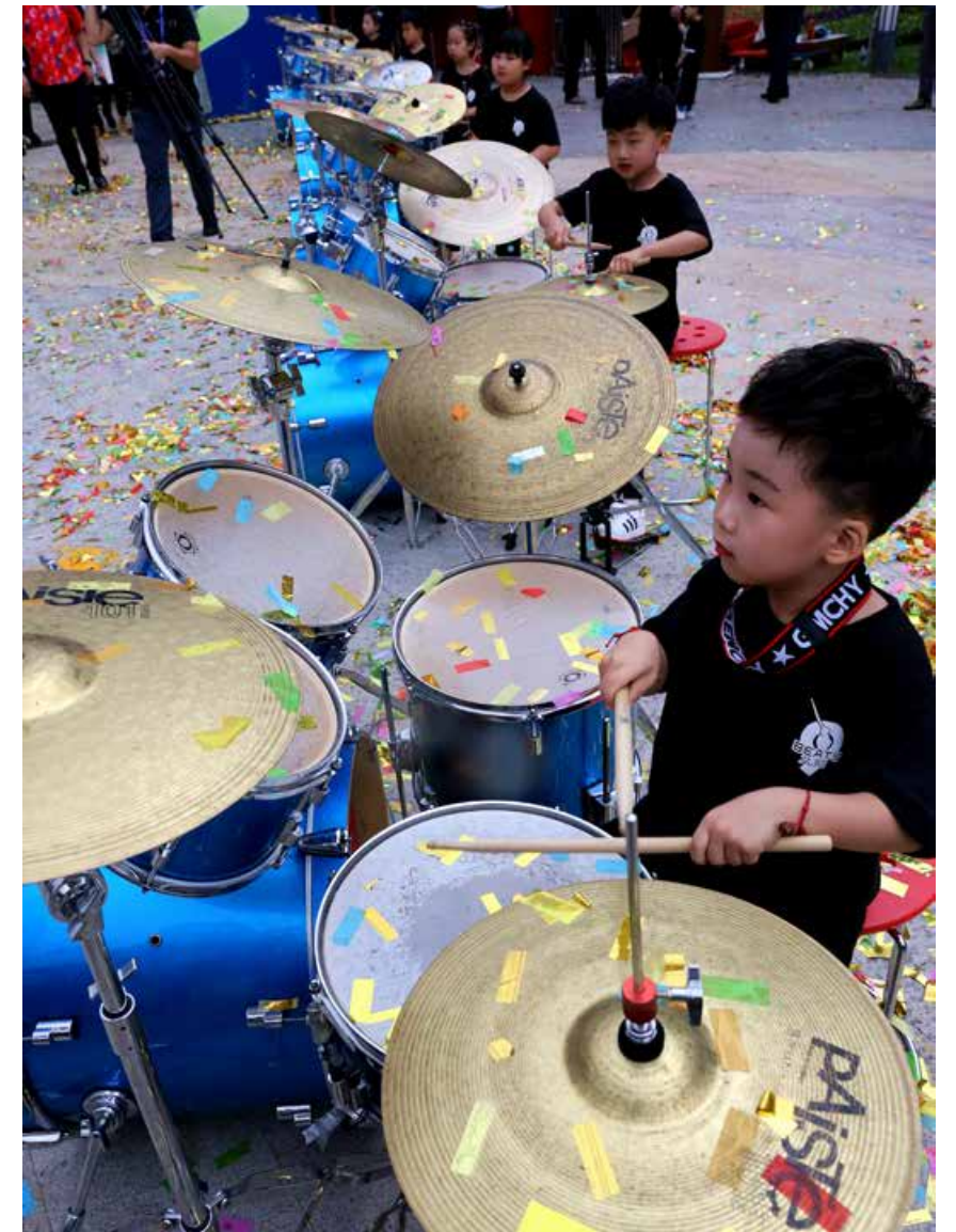
处于壮年的啤酒节在今年又有了更多新的打开方式，延伸丰富着节日的内涵。 Many new ways have been added to enjoy the thriving beer festival this year, enriching the connotations of this festival.

下，人们举起酒杯、一饮而尽，或为一再难却的盛情，或为远道而来的亲朋，或为赶赴每年一度的佳节之约，或为这座东方的啤酒之城平添一抹靓色。这是30年来青岛经典的生活方式，也是这座城市永不变更的仪式。30年来，是啤酒、是啤酒节、是与啤酒相伴的日子，赋予了这里人们大步向前、奋发有为的性格特质，也赋予了这座城市开放的胸襟、进取的精神、活力的气质。