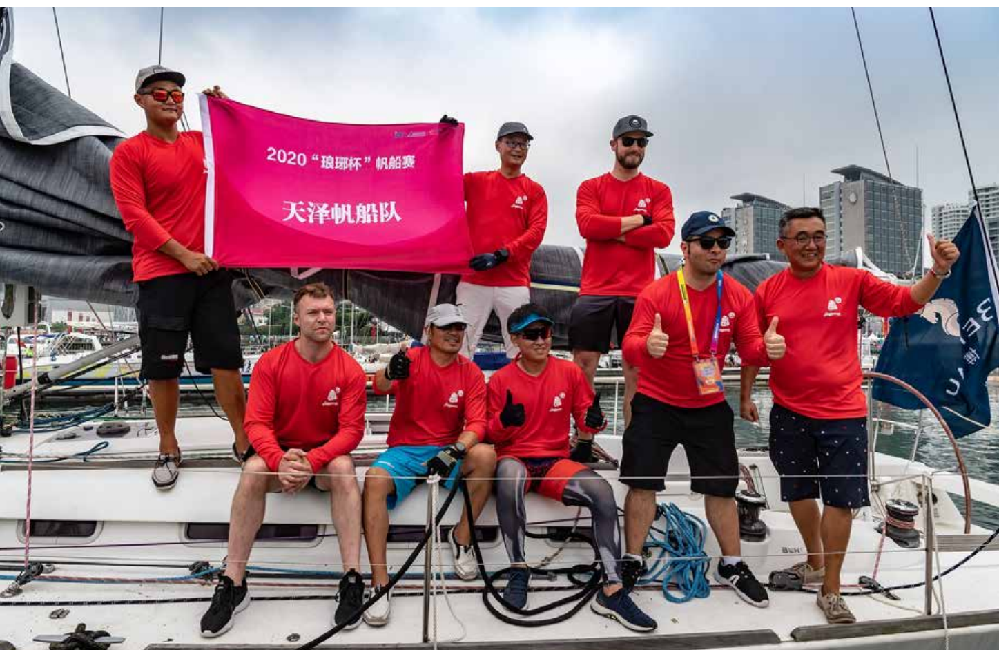
七大赛事近 40 项文体活动，打造了一场青岛旅游节庆文化的狂欢嘉年华。 Seven major events with nearly 40 cultural and sports activities created a carnival featuring Qingdao's tourism and festival cultures.

事朴大雄、北京奥运城市发展促进会常务副会长刘敬民、中国帆船帆板运动协会主席张小冬、2022 北京冬奥组委媒体运行部部长徐济成、中国航海学会原常务副理事长刘功臣，以及深圳、厦门、北海、烟台、潍坊、威海、日照、东营、滨州等城市体育部门领导，青岛市人大常委会副主任刘圣珍，青岛市副市长、青岛市重大国际帆船赛事（节庆）活动组委会副主席栾新，青岛市政协副主席卞建平，青岛奥促会常务副会长、青岛市重大国际帆船赛事（节庆）活动组委会副主席臧爱民，青岛市人大常委会副秘书长、办公厅主任隋志强，青岛市体育局党组书记、局长、体育总会主席、青岛市重大国