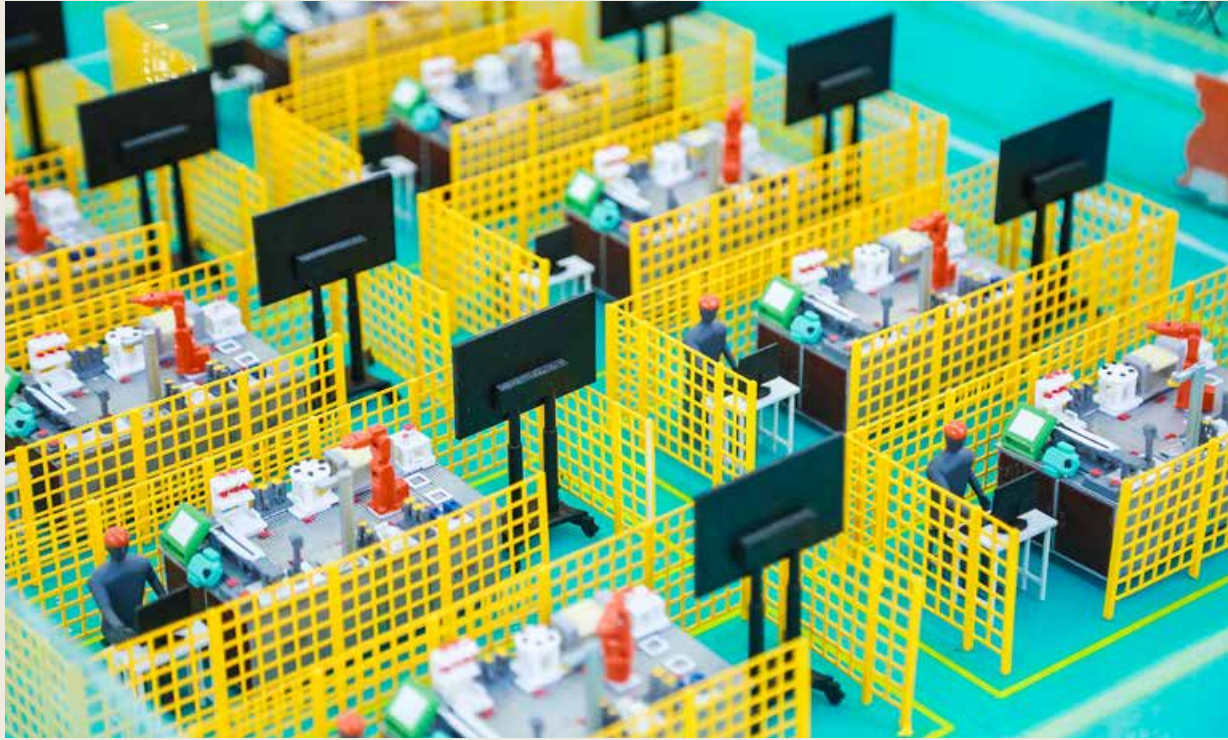
卡奥斯大规模定制模式不仅适用于海尔，也适用于全球企业。尽管行业不同、领域不同，但它表现出了强大的普适性。 COSMOPlat's mass customization model is applicable not only to Haier, but also to global enterprises. Although the industries and fields may be different, COSMOPlat has shown strong universality.