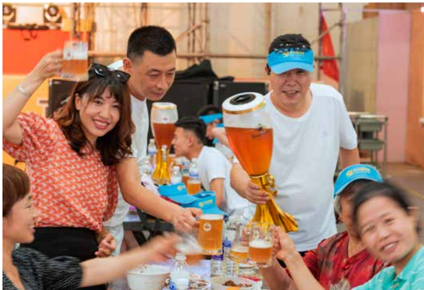
整座城市，一同开启了24个日日夜夜的醉美狂欢。 The whole city has started a drinking carnival lasting 24 days and nights.

会场以啤酒城为圆心有效辐射崂山主城区，把全区丰富的旅游、商贸、餐饮、会展、时尚、文化和休闲资源有机串联整合，构建起“城节一体、深度融合、互动共赢”的全域旅游体系，按照“一主、三辅、六区、全域”的整体框架而设置，让人们在这里看到崂山是一座真正的活力之城、休闲之城、不夜之城。