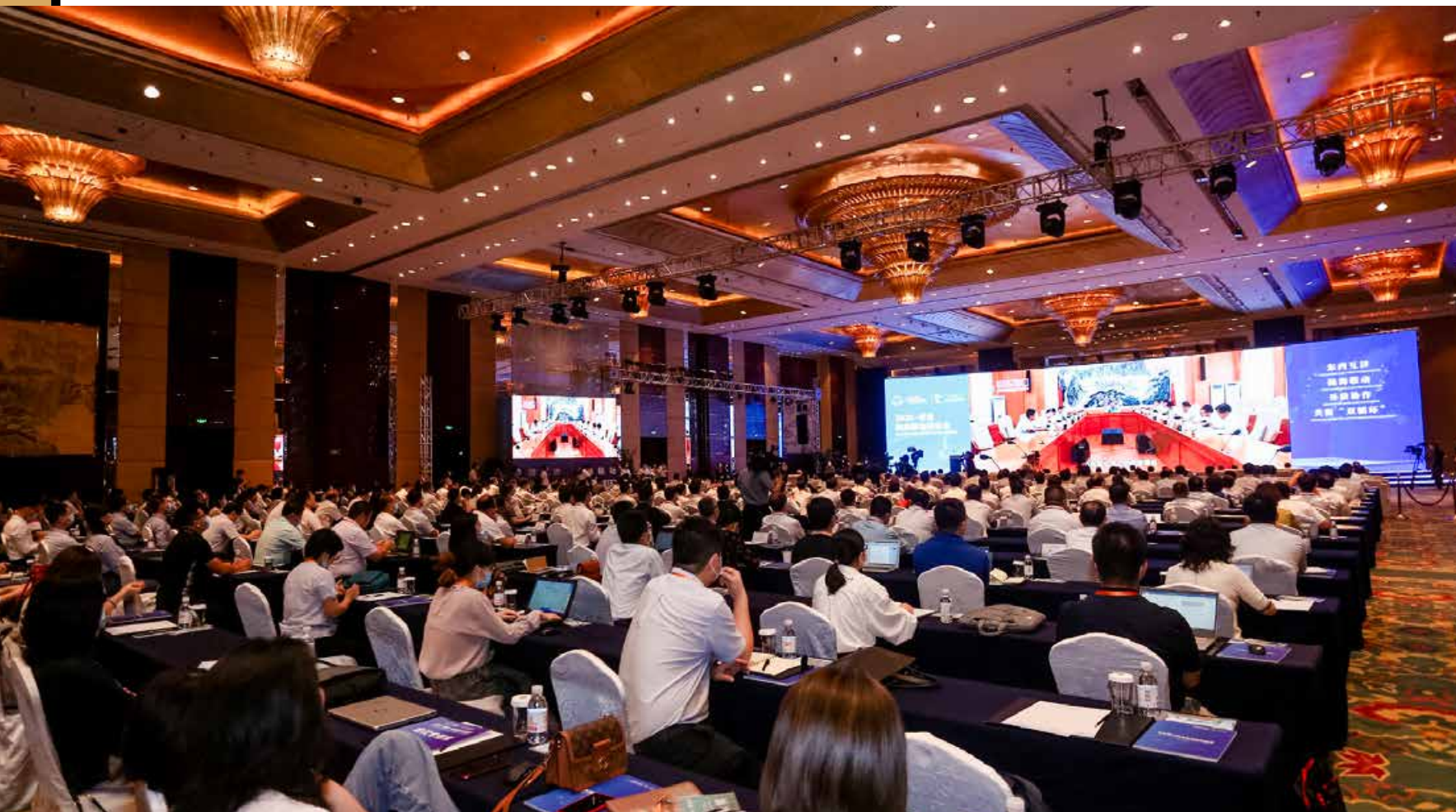
2020·青岛·陆海联动研讨会在青岛举行。 2020 Qingdao Land-Sea Linkage Seminar was held in Qingdao.