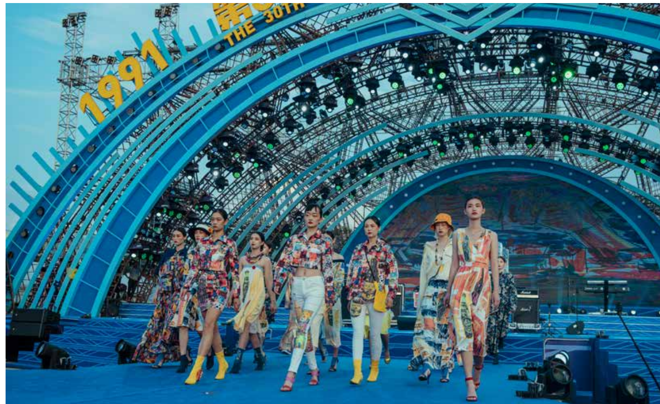
金沙滩啤酒城上演摩登时装秀。 The modern fashion show is presented in Golden Beach Beer City.