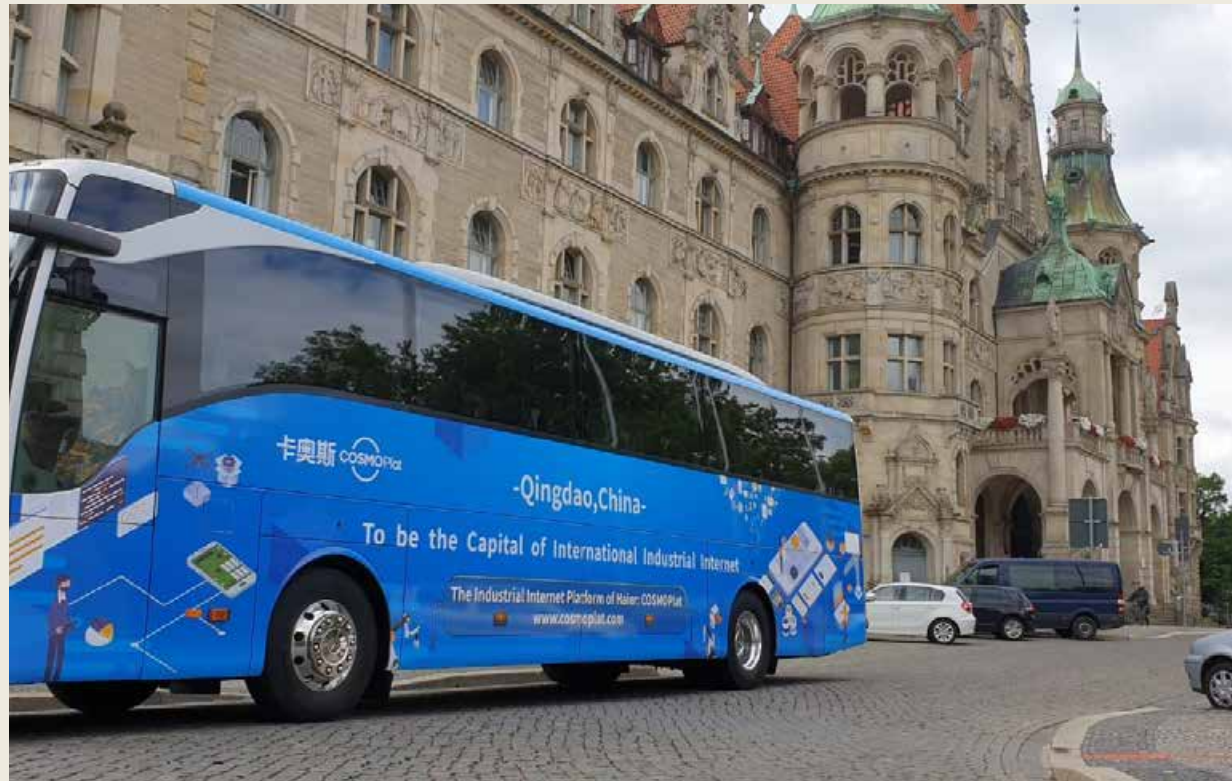
在欧洲，车身喷涂青岛打造世界工业互联网之都形象广告的商务巴士，行驶在欧洲各大旅游城市和景区。 In Europe, a commercial bus painted with the image advertisement of Qingdao to build the capital of the world industrial Internet runs in major European tourist cities and scenic spots.

以推进制造业与互联网融合创新发展为主线，加快建设软件定义的智能工厂，发展数据驱动的先进制造，构筑平台支撑的产业生态，形成了智能互联工厂、大规模个性化定制、远程运维等工业互联网创新模式。除了卡奥斯，青岛培育了软控股份、宝佳自动化等行业级解决方案提供商，树立了双星轮胎、中集冷藏箱等引领型实践标杆，使工业互联网成为产业转型升级的新途径、推动经济增长的新引擎、提升城市竞争力的新名片。据介绍，青岛全市累计认定各领域平台8个，智能（互联）工厂33个、数字化车间81个和自动化生产线236个，项目覆盖优势产业链，打下牢固发展基础。