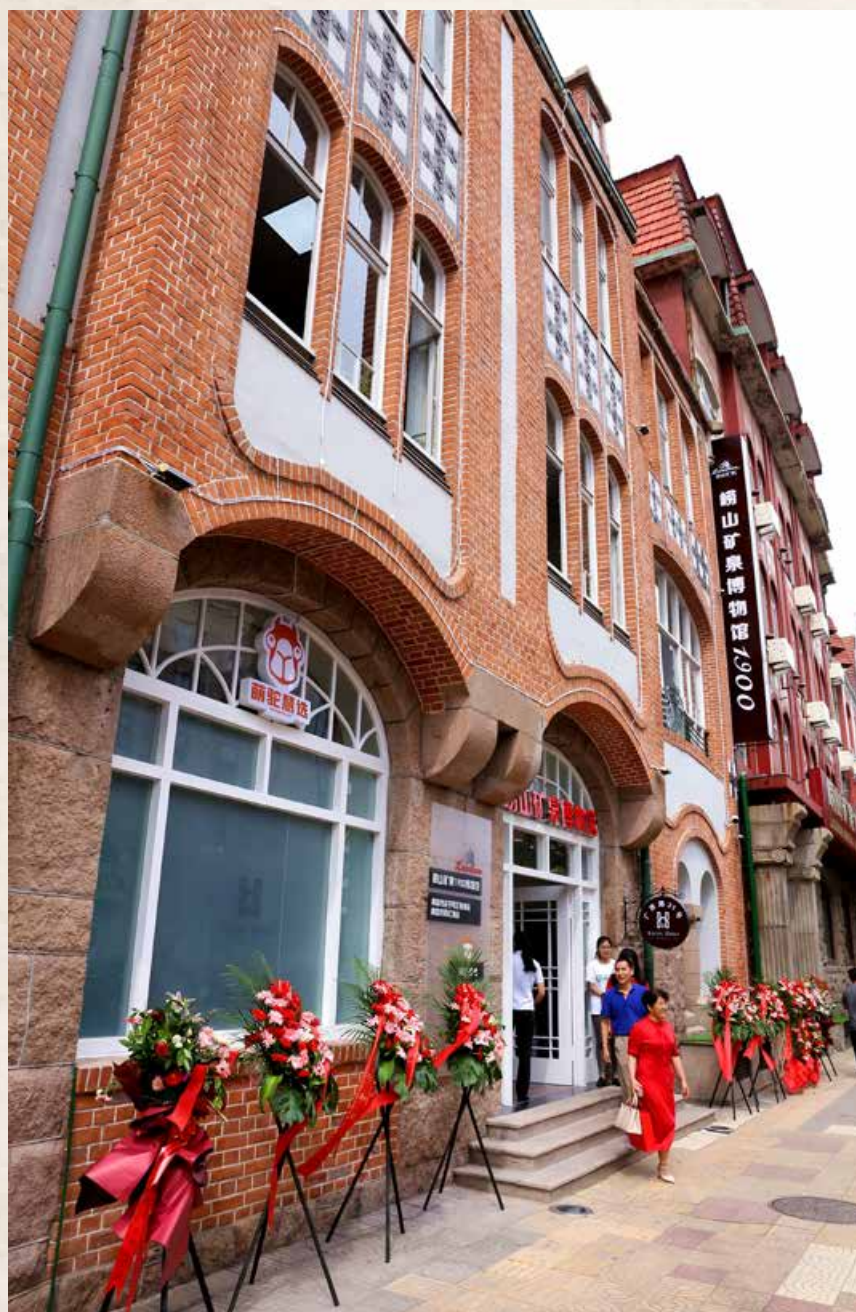
近日，在崂山矿泉水品牌迎来 120 周年的特殊节点，崂山矿泉水博物馆正式开门纳客。Recently, at the 120th anniversary of Laoshan Mineral Water, Laoshan Mineral Water Museum officially opened to visitors.