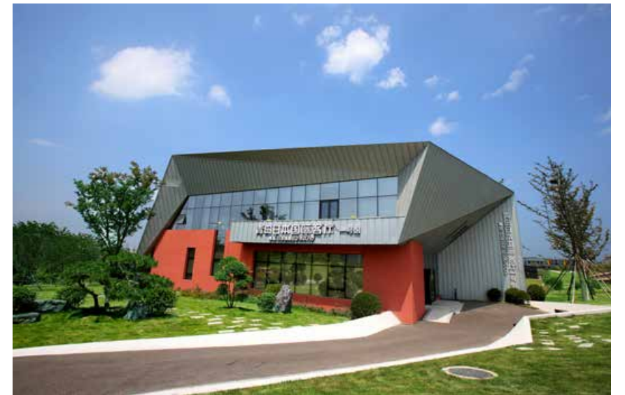
青岛日本“国际客厅”外景。 The Exterior of Qingdao International Business Club (Japan)