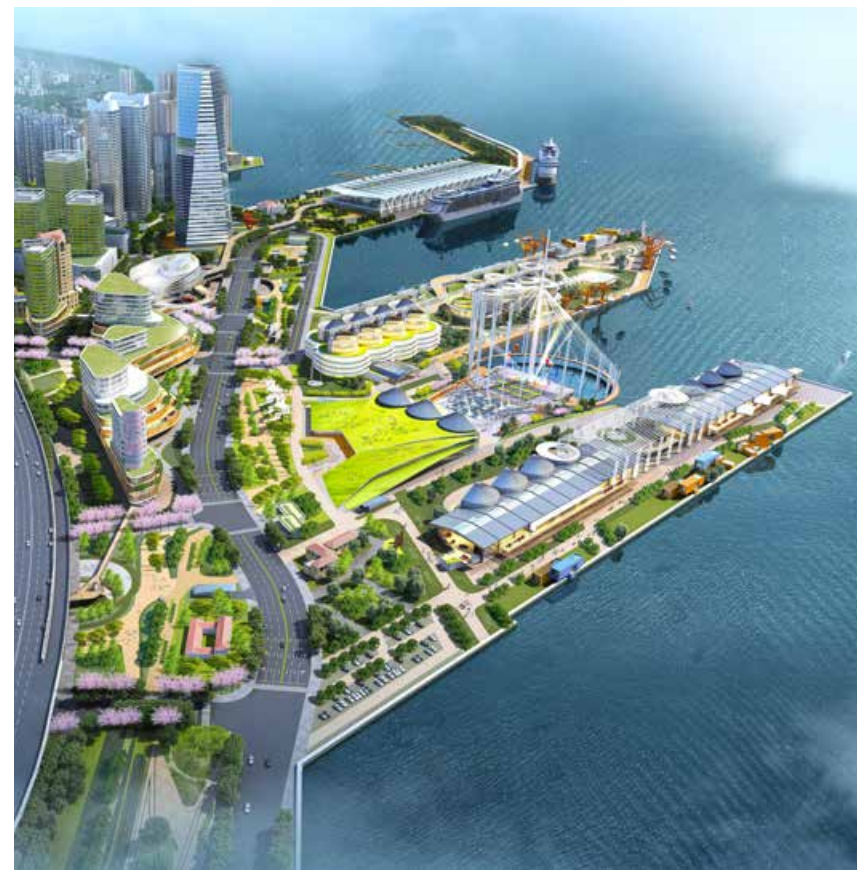
青岛国际邮轮母港区启动区效果图 (资料图片) Promoter Region of Qingdao International Cruise Home Port

Cruise gurus gather in Qingdao for the first time to discuss the recovery of cruise industry