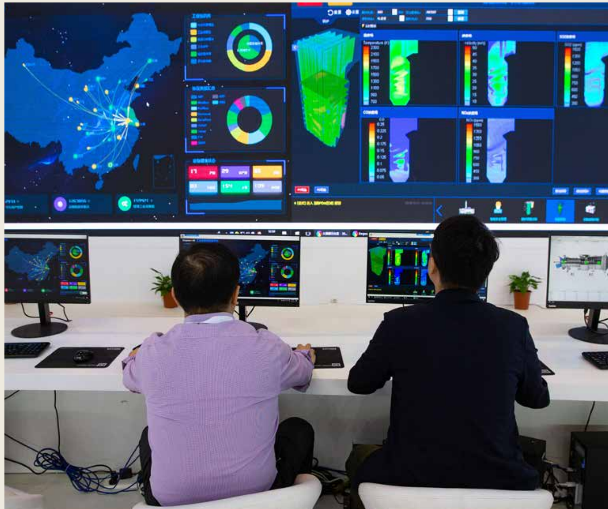
观众在 2018 世界智能制造大会展示区参观工业互联网平台。Visitors looked around the industrial Internet platform in the exhibition area of the 2018 World Intelligent Manufacturing Summit.