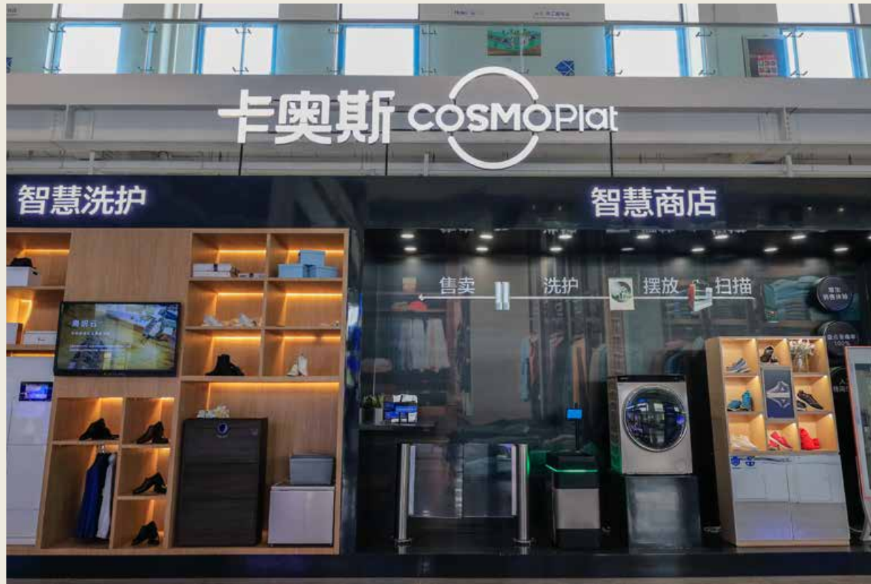
卡奥斯不仅是海尔的平台，也是一个面向全世界开放的平台。 COSMOPlat is not only a platform of Haier, but also a platform open for the whole world.