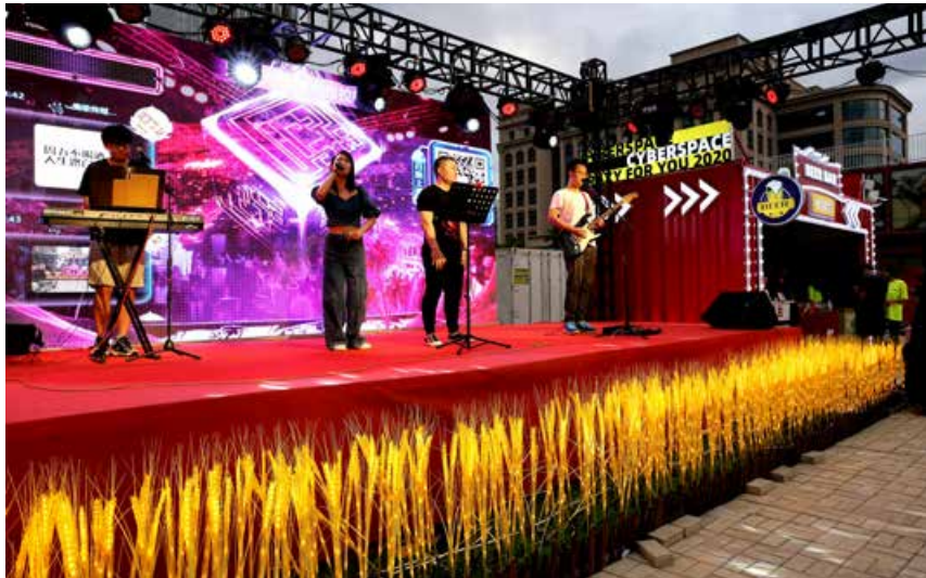
青岛原创音乐大赛在啤酒城内的中心舞台正式开赛。 Qingdao Original Music Competition officially opened on the central stage in the Beer City.