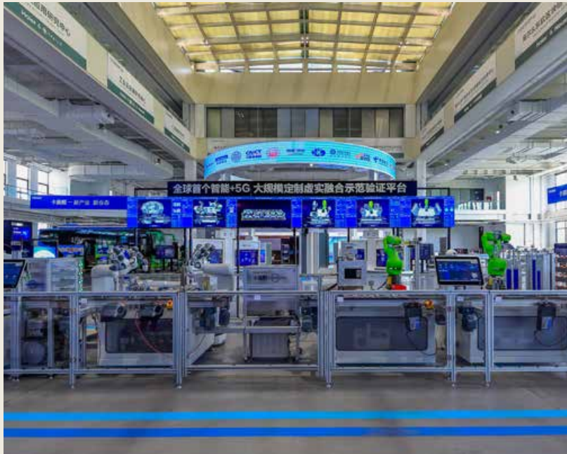
卡奥斯是全球首家引入用户全流程参与体验的工业互联网平台。COSMOPlat is the first industrial Internet platform in the world that introduces users' whole-process participation experience.