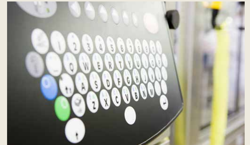
工业互联网被看作是互联网的“下半场”。 The industrial Internet is regarded as the “second half” of the Internet.

当下放眼全球，依托各自比较优势，以平台为核心的产业竞争正日趋白热化。西门子、博世、施耐德、ABB 等工业巨头力图在既有高端产品、装备全球垄断地位的基础上，形成“云+端”“制造+服务”和