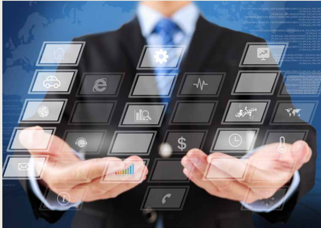
企业自发上云上平台已成趋势，与此同时国家也通过政策引导推动企业上云上平台。 It has become a trend for enterprises to go on cloud platform spontaneously. At the same time, the state also drives enterprises to go on cloud platform through policy guidance.