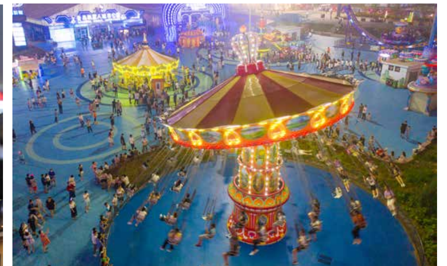
金沙滩啤酒城亲子游乐区的欢动时光。 Wonderful time at the Family Recreation Zone in the Golden Beach Beer City.