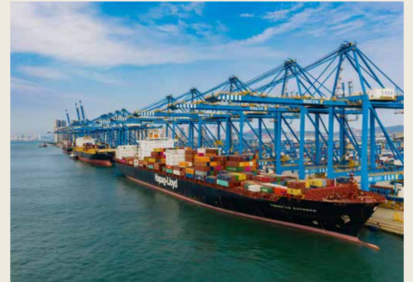
山东港口青岛港自动化码头。 The automatic terminal of Qingdao Port under Shandong Port

在海尔冰箱互联工厂内，生产操作中突遇紧急困难的产线工站操作员，可以通过佩戴 AR 眼镜，以第一视角，与技术专家进行远程实时音视频通讯。而此时，相比 WiFi，5G 则能带来更好的 AR 体验。5G 低时延、广连接、大带宽的特性使得专家在看到眼镜端采集的视频后，可即时实施 AR 标注、冻屏标注等系列操作，将指导信息于第一时间实时反馈