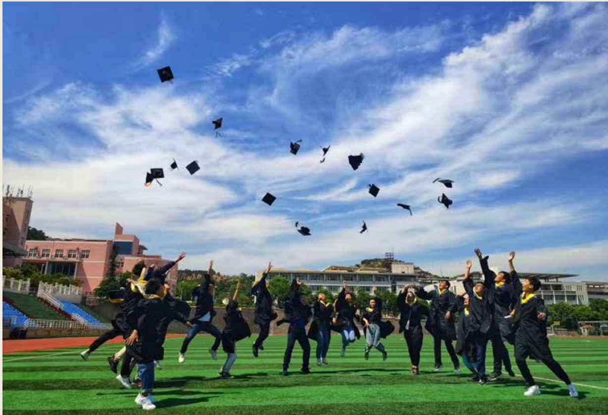
人才作为青岛打造世界工业互联网之都的智力支撑，成为这条快车道上“宠儿”。 As the intellectual support for building the capital of the world industrial Internet, talents have become the "favorite" in this fast lane.