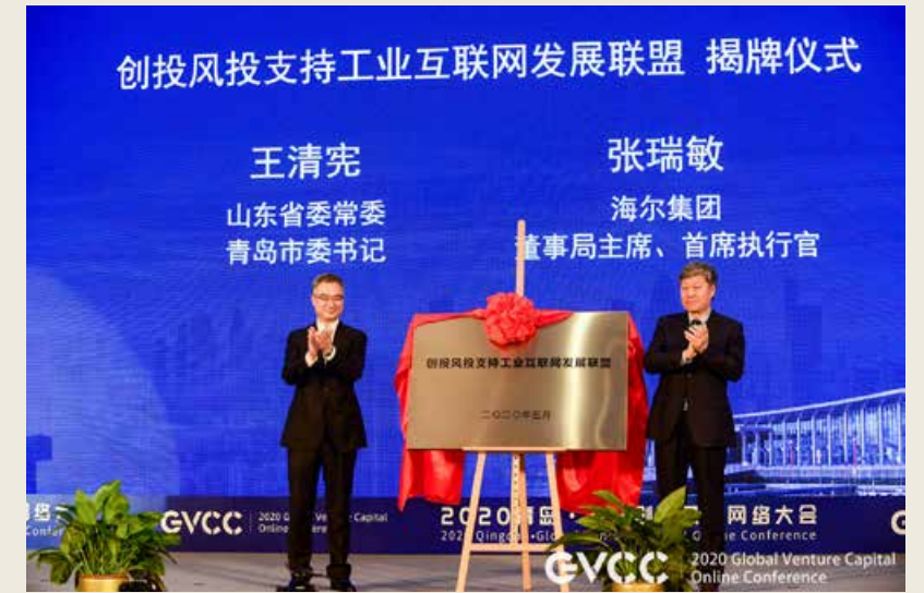
创投风投支持工业互联网发展联盟成立仪式上，中共山东省委常委、青岛市委书记王清宪（左）与海尔集团董事局主席、首席执行官张瑞敏（右）共同为创投风投支持工业互联网发展联盟揭牌。

中车青岛四方车辆研究所有限公司副总经理崔凤钊也认为青岛在发展工业互联网中具有优势：“主观上，政府对工业互联网发展十分重视，青岛在全国率先出台《互联网工业发展行动方案》《工业互联网三年攻坚实施方案》，支持海尔、海信等企业搭建工业互联网平台，为制造业转型升级赋能；连续举办5届关于工业互联网的大会和国际软博会；以技术应用合作为突破口，吸引科大讯飞、商汤科技等企业落户；组织院校、企业签约华为；建设中德生态园的中德智能技术博士研究院，