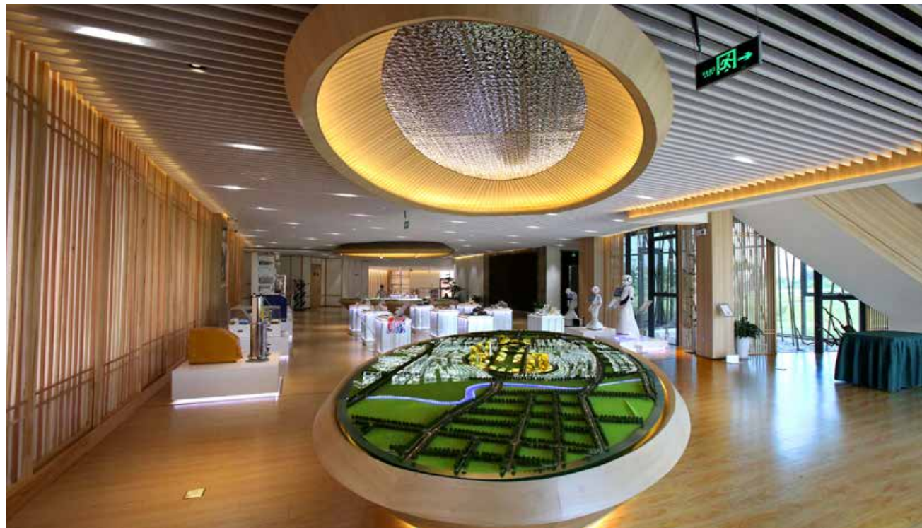
青岛是中国与日本交流合作最为密切的城市之一。 Qingdao is one of the Chinese cities that have the closest exchanges and cooperation with Japan.

业进入中国的一个全新窗口，我们将用国际化水准的‘青岛服务’，进一步放大‘国际客厅’溢出带动效应，助力青岛成为日本企业进入中国市场的‘桥头堡’，推动‘国际客厅’成为青岛面向全球的一张新名片。”青岛国际经济合作区管委主任朱铁一介绍，中日（青岛）地方发展合作示范区按照“一年启动、三年成形、五年成城”的总体目标，预计到2025年，中日（青岛）地方发展合作示范区基础设施配套基本完成，入驻企业超过200家，工业总产值超过350亿元，GDP达100亿元，就业创业人口达到3.5万人。