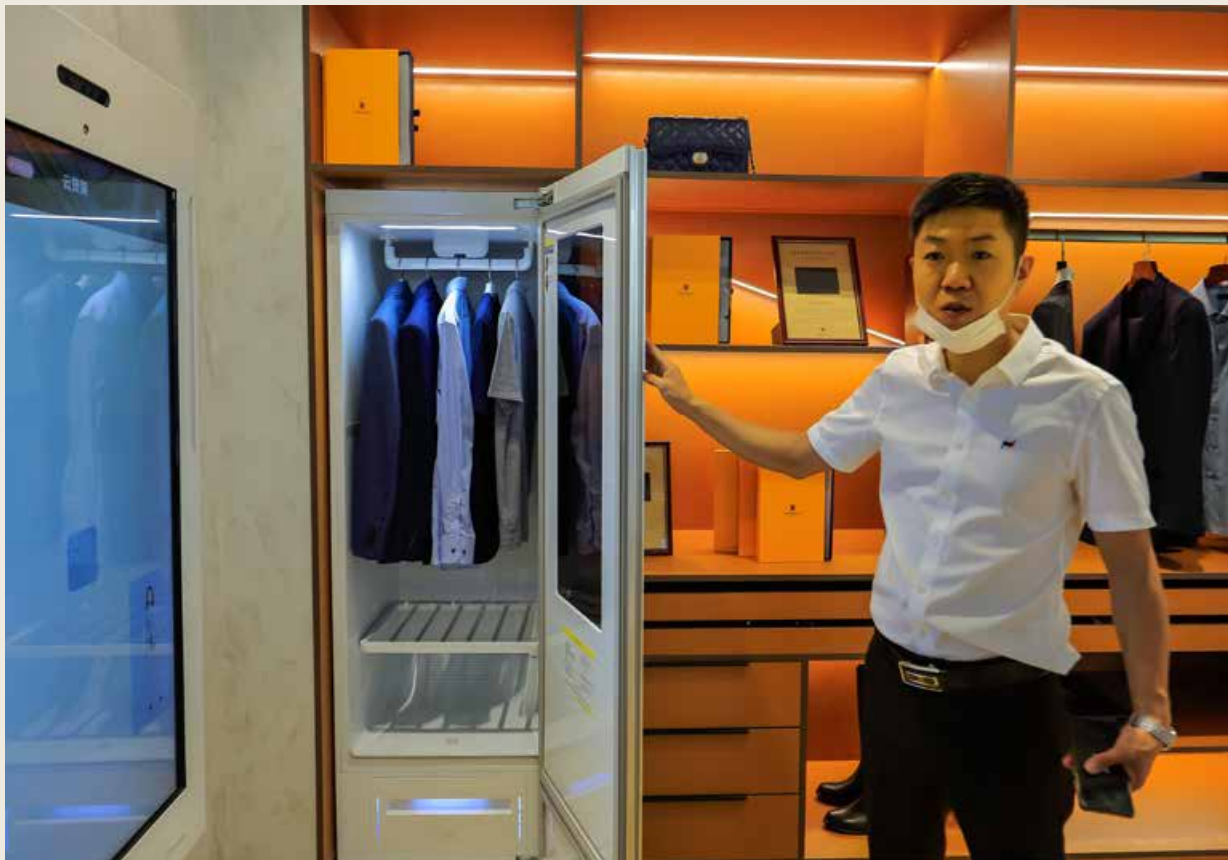
联生态联盟海尔衣联网 001 号店链接了服装、家纺、采购、洗染、织物等多个产业形成衣联生态联盟。 The No.001 store of Haier Internet of Clothing has linked many industries, such as clothing, home textile, purchasing, washing and dyeing, fabric, etc., to form the IoC Ecosystem Alliance.