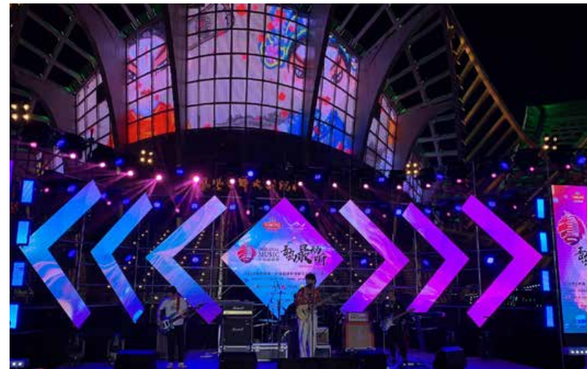
“明日大丈夫”表演现场。 Scene of Tomorrow is OK Band's Performance.

Recently, the first audition for the Band Performance Award of the “2020 Tsingtao Beer·Qingdao Original Music Support Program” was opened on the north square of Qingdao Sound of the Phoenix Grand Theater. In this first audition, many local bands made their debut.