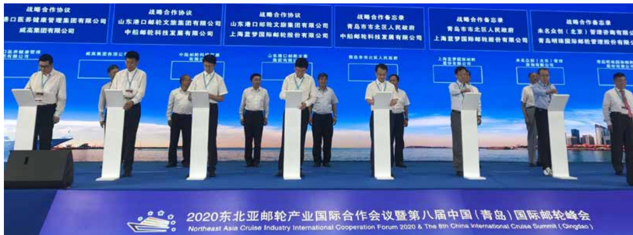
青州市市北区人民政府、山东港口邮轮文旅集团有限公司与中船邮轮科技发展有限公司、上海蓝梦国际邮轮股份有限公司分别签订战略合作备忘录。 People's Government of Shibei District and Shandong Port Cruise Culture & Tourism Group Co., Ltd. respectively signed a strategic MOU with CSSC Cruise Technology Development Co., Ltd. and Shanghai Blue Dream International Cruise Co., Ltd.

黄金邮轮 10 家国内外邮轮公司代表共同签署邮轮安全承诺书，在邮轮空调新风系统、优化用餐流程、加强消杀防疫措施、做好隔离防控预案等措施积极应对疫情、恢复游客信心、接受社会各界监督，共同推动中国邮轮行业的尽快安全复航。