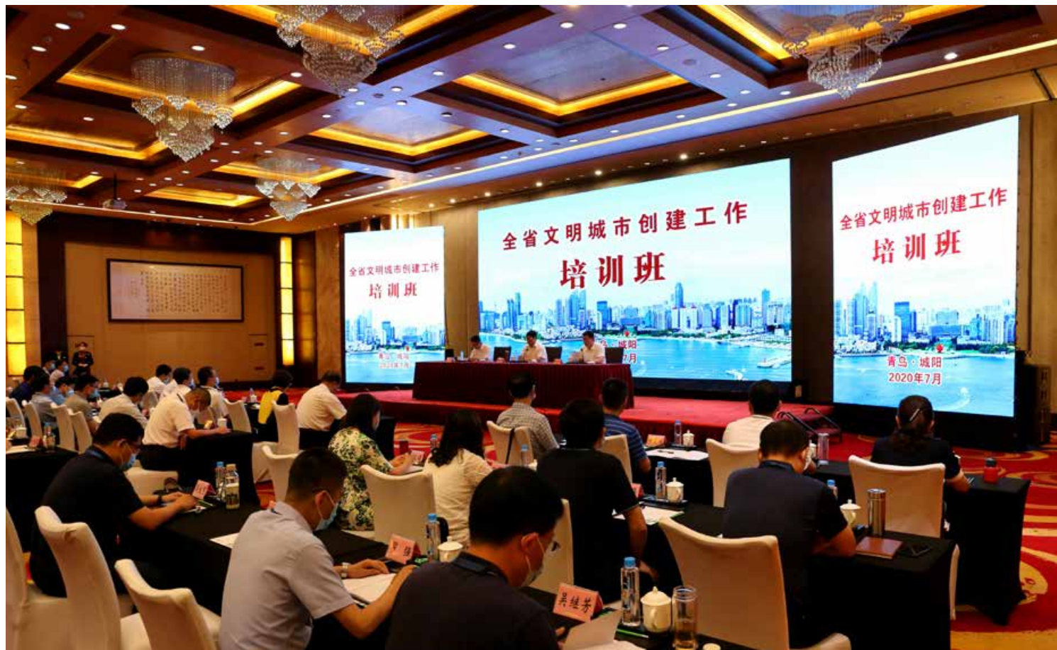
近日，由山东省文明办主办的全省文明城市创建工作培训班在青岛市城阳区正式开班。 Recently, a training session on the construction of civilized cities in Shandong province, sponsored by the Civilization Office of Shandong Province, officially opened in Chengyang District, Qingdao.