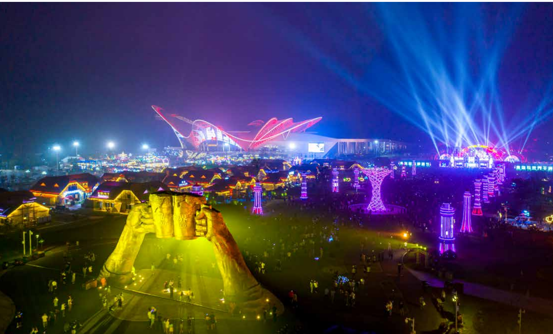
金沙滩啤酒城星光大道夜景。 Night view of the Stars Avenue in Golden Beach Beer City.