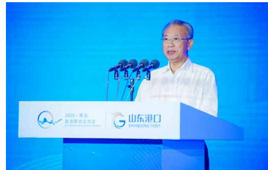
中共山东省委书记刘家义出席会议并作重要讲话。 Liu Jiayi, Secretary of the CPC Shandong Provincial Committee attended the meeting and delivered a speech.

刘家义说，贯彻落实习近平总书记重要指示要求，我们正着力激发内需巨大潜力，积极拓展消费空间，积极扩大有效投资，积极提升供给质量，构建国际领先的工业互联网平台，支持青岛打造世界工业互联网之都，让各类市场主体共享山东市场的“大蛋糕”。我们正着力构建优良产业生态，坚定不移加快新旧动能转换，紧紧抓住“十强”现代优势产业集群，努力在补链、扩链、强链上取得突破，培育具有全球竞争力的优势产业链条。我们正着力畅通互联互通大通道，加强基础设施连通，完善物流体系，深化陆海联动，让人流、物流、资金流、信息流循环起来，为新发