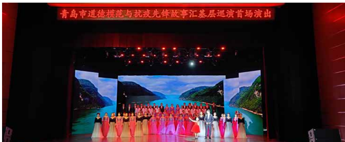
近日，青岛市道德模范与抗疫先锋故事汇基层巡演首场演出在李沧剧院举行。 Recently, the first performance of Grassroots Tour of Stories about Qingdao's Moral Models and Anti-epidemic Pioneers was held in Licang Theatre.

近日，青岛市道德模范与抗疫先锋故事汇基层巡演首场演出在李沧剧院举行。青岛市各级道德模范与抗疫先锋、优秀志愿者、社区居民代表 150 余人现场观看了演出。