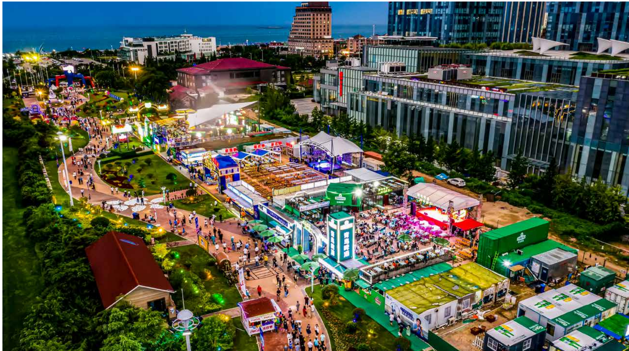
本届青岛国际啤酒节崂山会场在青岛城市客厅开启了一场啤酒盛宴，喜迎四海宾朋。 This beer festival provides a beer feast in the Qingdao City Living Room to welcome guests and friends from all over the world.

足。分会场活动在这里举办，不仅富有山海小城王哥庄的特色，还能让街道、社区的居民在家门口“零距离”感受啤酒节的热闹场景。与此同时，周边酒店上座爆满，民宿入住率达90%，分会场活动的举办极大地带动了王哥庄旅游和消费，拉动了夜间经济。