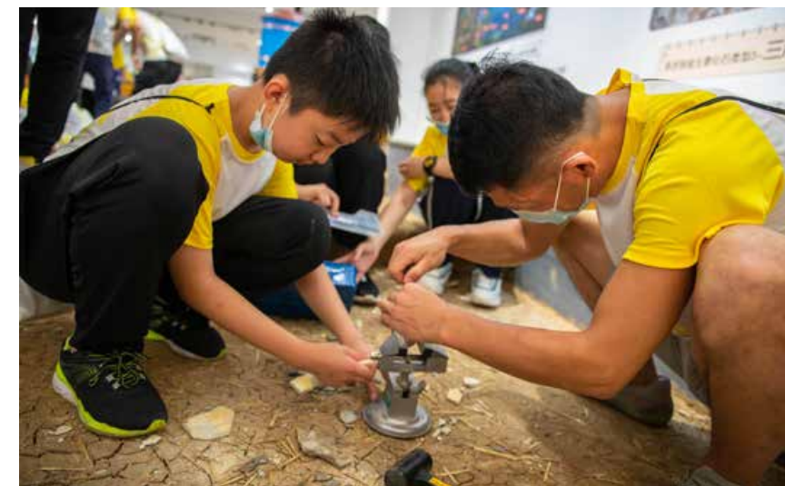
选手们发挥团结协作精神，一同完成诸多困难的任务。 The contestants played the spirit of unity and cooperation to complete many difficult tasks together.

At Qingdao Tiantai Stadium on August 30, people in colorful team uniforms jumped, and waved the team flags. Accompanied by the loud and sweet whistle, Olympic champion Zhang Juanjuan hit the red “love” bullseye with one arrow, announcing the opening of a city competition full of love and fashion. As a major brand activity in Qingdao’s breakthroughs in building a world-renowned “in”