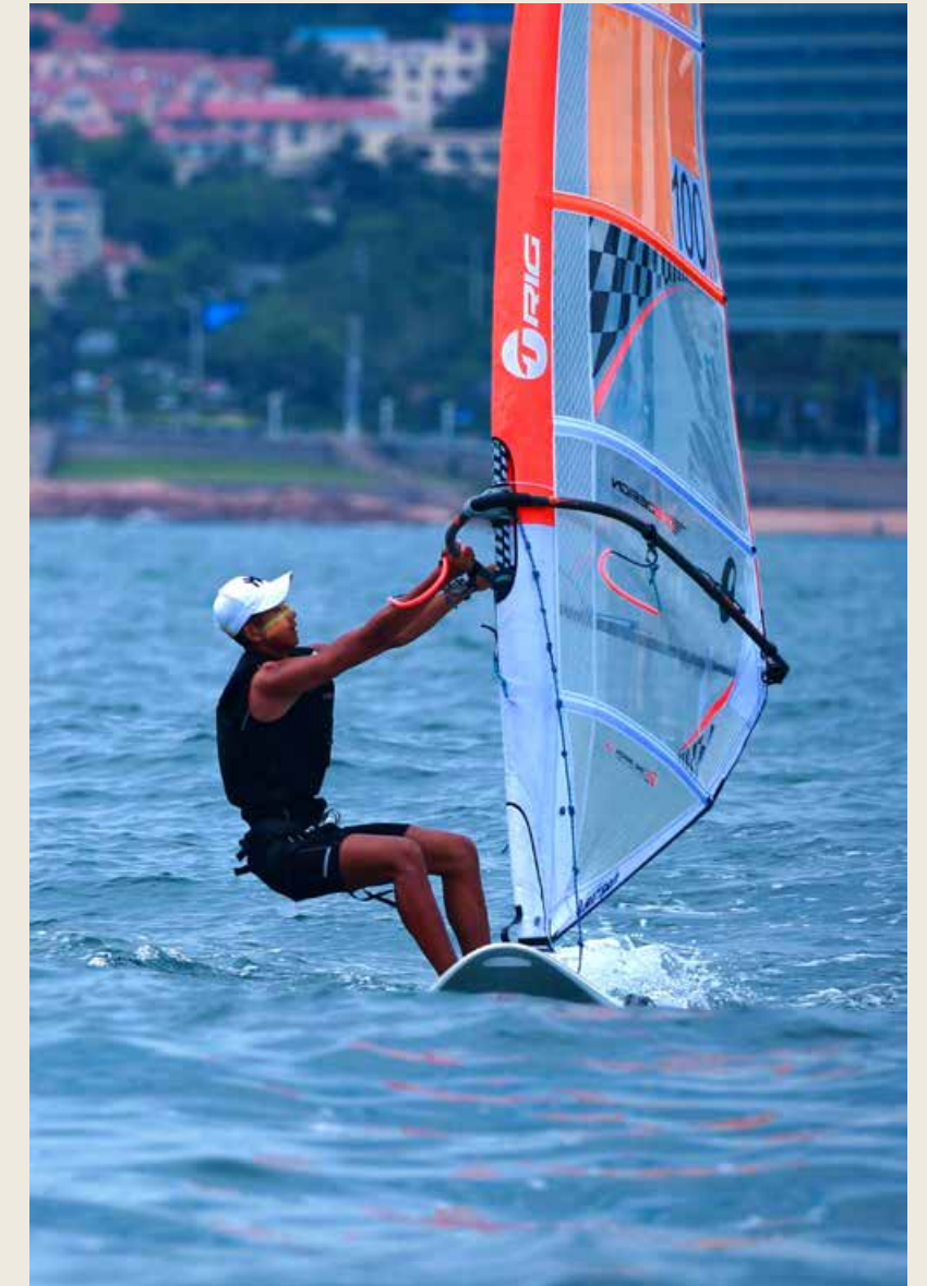
4项全新赛事，在赛事品质和办赛水平上实现了新的提高。The four brand new events scaled new heights in their quality and at their levels.

本届帆船周·海洋节从8月8日持续至16日，汇聚了沿海10个城市的教练员、运动员等赛队参赛。