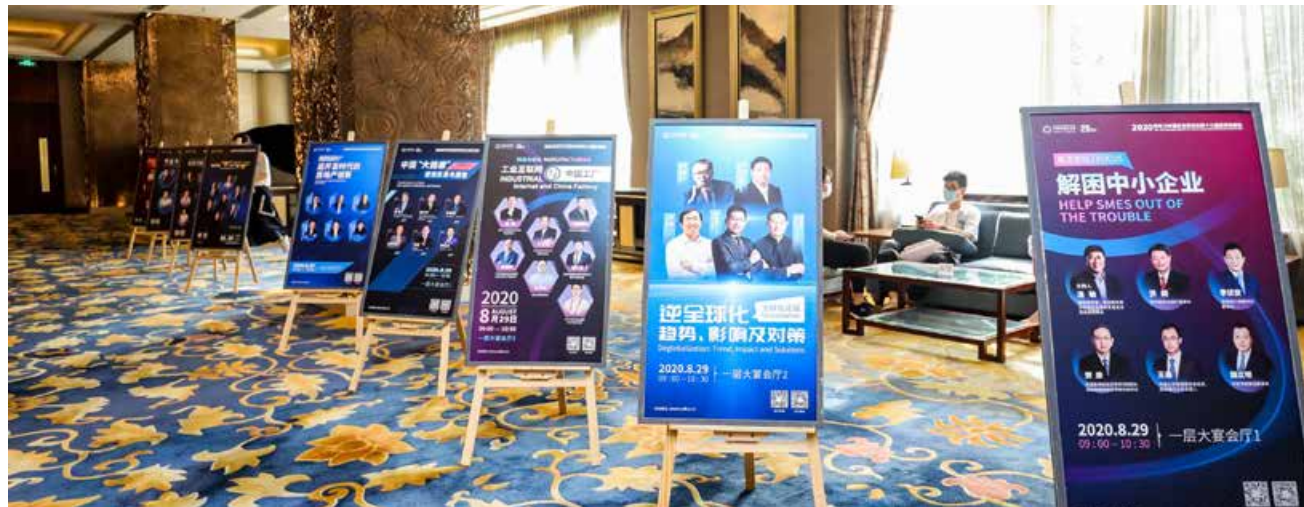
伴随中国经济腾飞、见证中国企业家群体崛起、壮大，亚布力企业家论坛成为中国企业家脑力激荡、携手并进最重要的平台之一。 With China's economic take-off and the growth of Chinese entrepreneurs, Yabuli Entrepreneurs Forum has become one of the most important platforms for Chinese entrepreneurs to brainstorm and go forward hand in hand.

人们用资本为青岛投下了最为关键、也最具说服力的一票。让“投资青岛，就是投资国家战略”成为业界共识，成为青岛在城市竞争中最有吸引力的“金字招牌”。