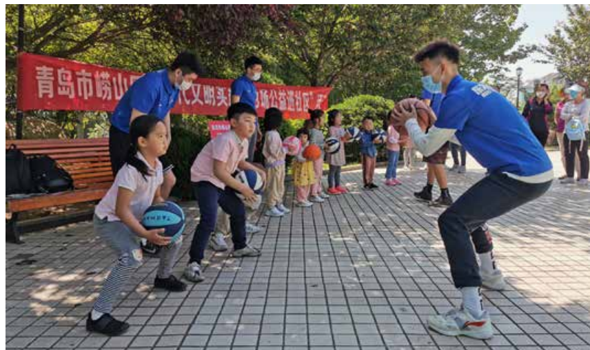
今年5月，一场热火朝天的篮球公益课在崂山区金家岭街道泰都社区活动广场展开，受到居民们的欢迎。

Laoshan District of Qingdao has carried out five theme activities including "reading aloud for love, paying homage to heroes", "inheriting heroic spirit, striving to be a new generation of the times", "paying tribute to ordinary workers and praising the great new era". 210 classes and public welfare groups set up youth family volunteer groups, and 11,000 "volunteer families" joined it.