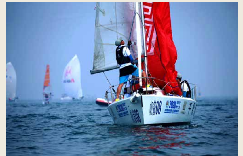
时尚的体育基因，荟萃更多的社会品牌。 The fashionable sports gene gathers more social brands.