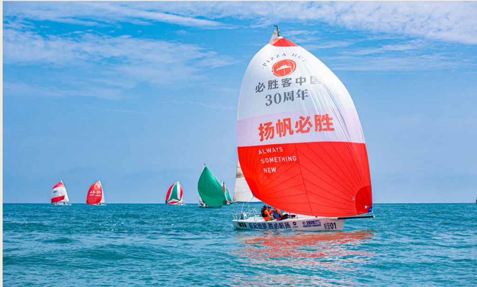
“扬帆必胜”号帆船亮相帆船周·海洋节。 Sailboat "Always Something New" appears at this Sailing Week · Marine Festival.

"Brand + Festival" integrated development helps Qingdao sail far