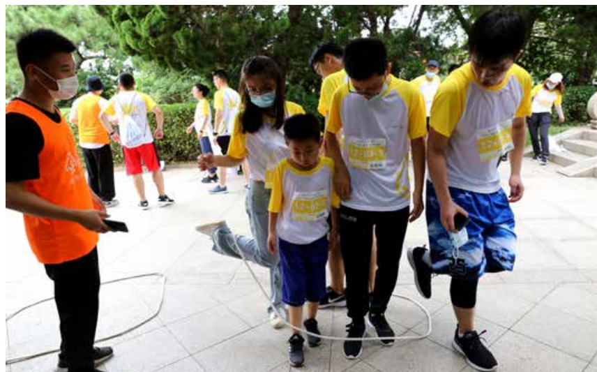
选手们在比赛过程中拼尽全力，完成各种任务。 The contestants try their best to complete all kinds of tasks during the competition.