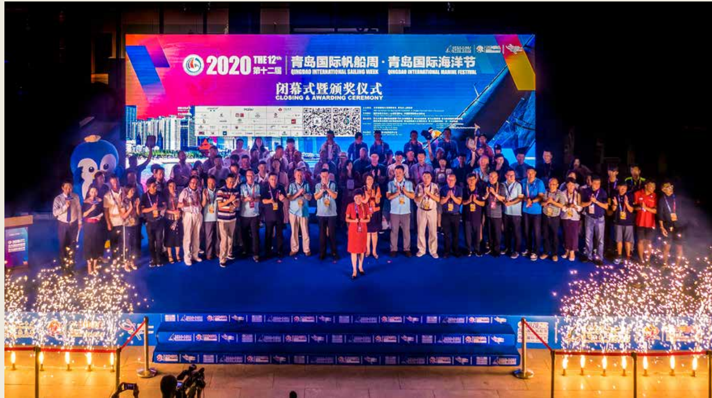
2020 第十二届青岛国际帆船周·青岛国际海洋节闭幕式暨颁奖仪式在青岛奥帆中心隆重举行。 The Closing and Awarding Ceremony of the 12th Qingdao International Sailing Week · Qingdao International Marine Festival 2020 is held at Qingdao Olympic Sailing Center.