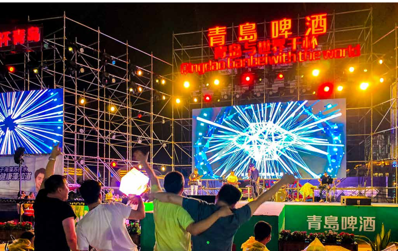
2020年的夏天，恰好是青岛国际啤酒节的“而立之年”，时常“嗨爆”我们的朋友圈。 2020 summer marks the 30th anniversary of the establishment of the Qingdao International Beer Festival, which is frequently shared by people on their Moments.

"Nothing but thirty", the story of the Beer Festival in Laoshan District