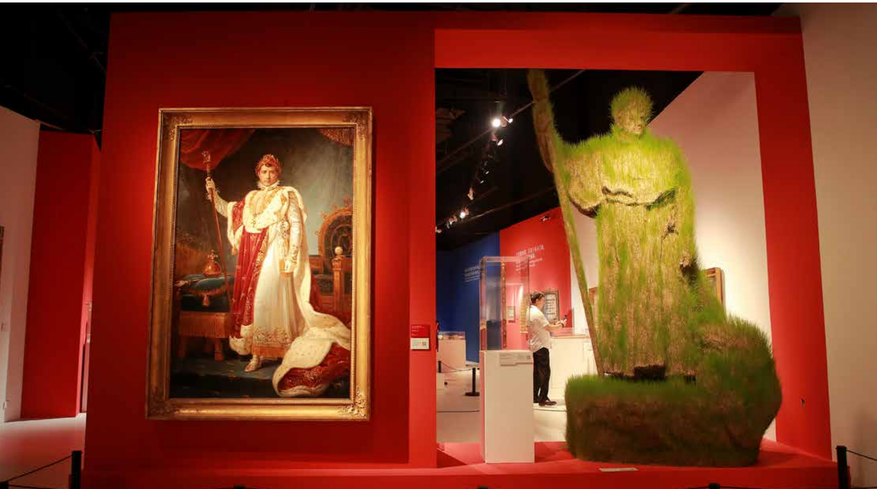
“传奇拿破仑”特展中展出拿破仑一世身着加冕服装的肖像画及名为《生长》的雕塑像。 In the special exhibition “The Legendary Napoleon”, the portrait of Napoleon I in coronation costume and the sculpture named Growth are displayed.