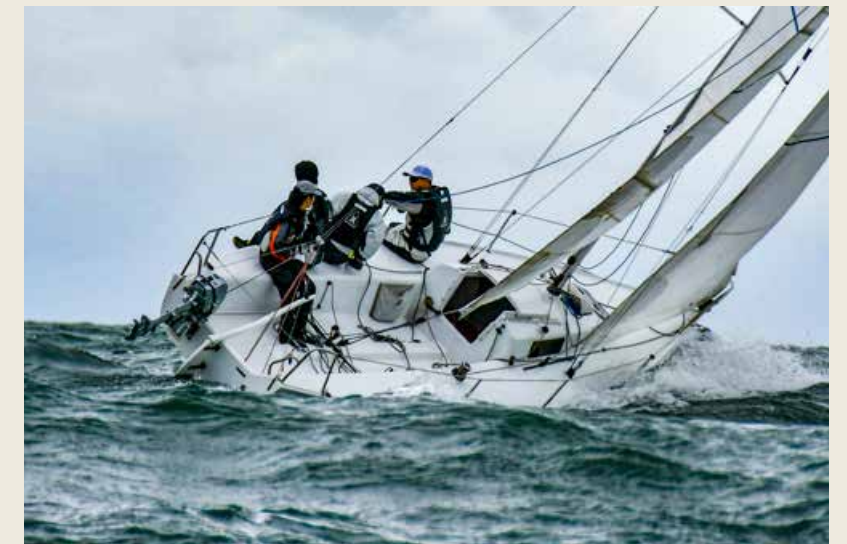
精彩的海上赛事。 Wonderful competitions on the sea.

亚太地区第一个以“线下”方式举办的海洋休闲帆船主题会议和展览。因此，峰会的成功举办意义深远，亚太休闲帆船产业发展未来可期。