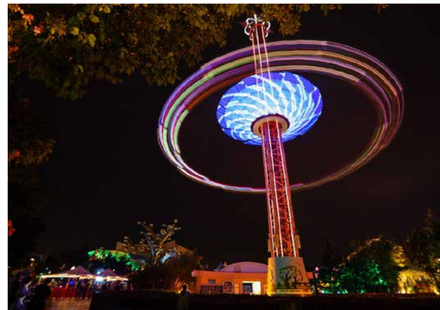
夜场的方特别有一番风味。 Qingdao Fantawild Dreamland has a unique charm at night.