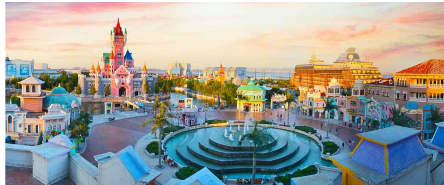
这里华丽的场景早已成为孩子们心中真正的梦幻王国。 The gorgeous scene here has already become the real dream kingdom in the hearts of children.