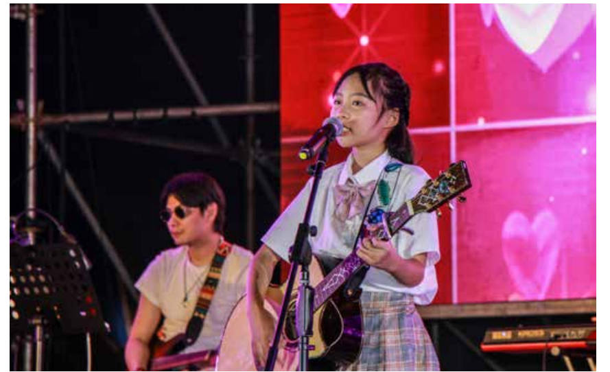
历经30年，啤酒的金色泡沫已经与这座城市的气质相融。After 30 years of development, the golden foam of beer has blended with the city's temperament.

三十而立的青岛国际啤酒节，不变的是初心，变化的是以崂山品质更好地迎接世界、拥抱世界，向每一个前来的人们展示青岛的城市之美、节庆之美、生活之美，还有这座注定与啤酒共荣共生城市的作为和智慧。