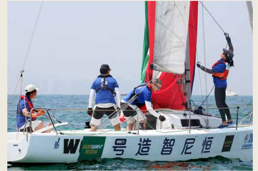
恒尼智造（青岛）与时俱进抓机遇，推动新旧动能转换改革。Hony Technology (Qingdao) Co., Ltd. seizes the opportunities presented by the times to promote the reform of replacing the old growth drivers with new ones.

Some people once aptly called the brand partners of festivals as "smart partner" or "cultural partner", because the participation degree of brand partners not only tests the ability of the festival planners, but also is one of the important