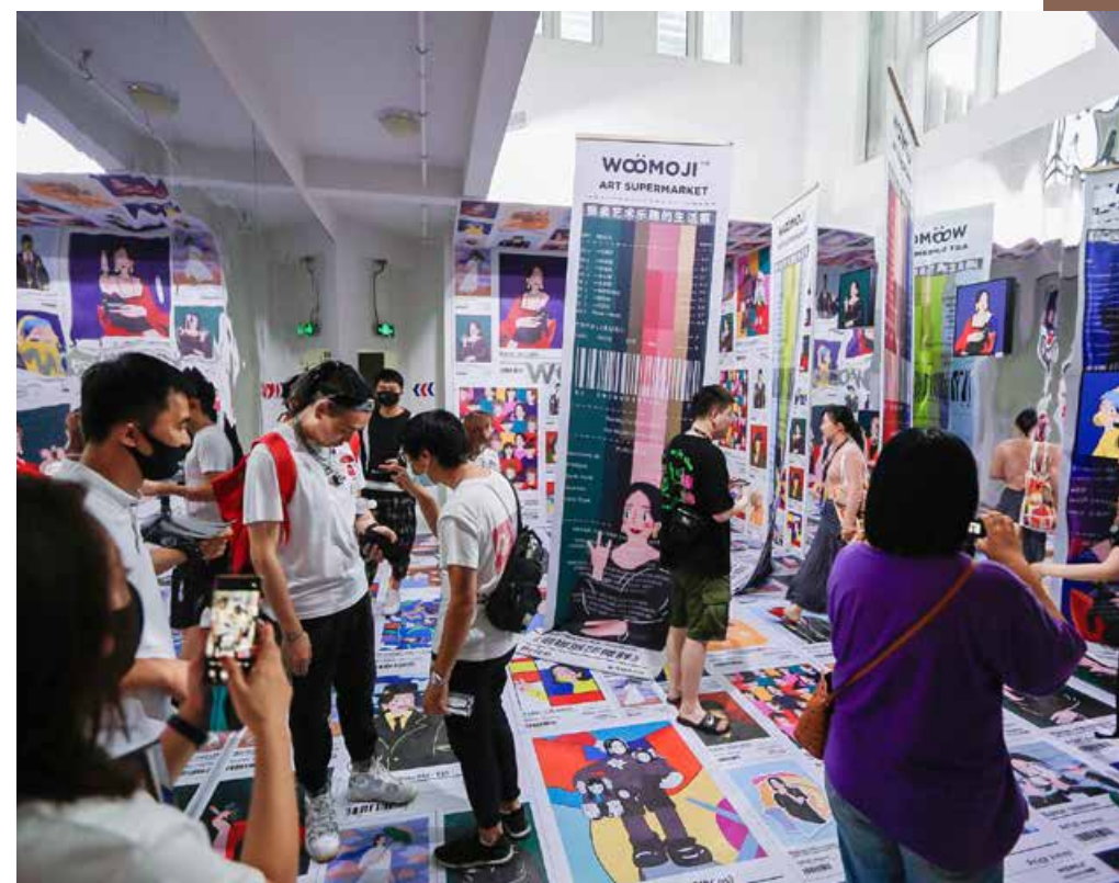
此次时装周期间，各个品牌打造的艺术空间备受瞩目。 During this fashion week, the art space created by various brands has attracted much attention.

开幕式上，中国纺织工业联合会会长孙瑞哲和山东省工业和信息化厅二级巡视员张忠军进行致辞，在青岛市政府副市长耿涛致辞并宣布开幕后，全体嘉宾共同见证了青岛中纺亿联时尚产业投资集团建设运营的原创设计交易中心启动仪式、海尔卡奥斯工业互联网平台与国内领先设计师专业服务商北京时尚秀场达成战略合作、青岛中纺亿联时尚产业投资集团有限公司与厦门多想互动文化传播股份有限公司发布《时尚尖