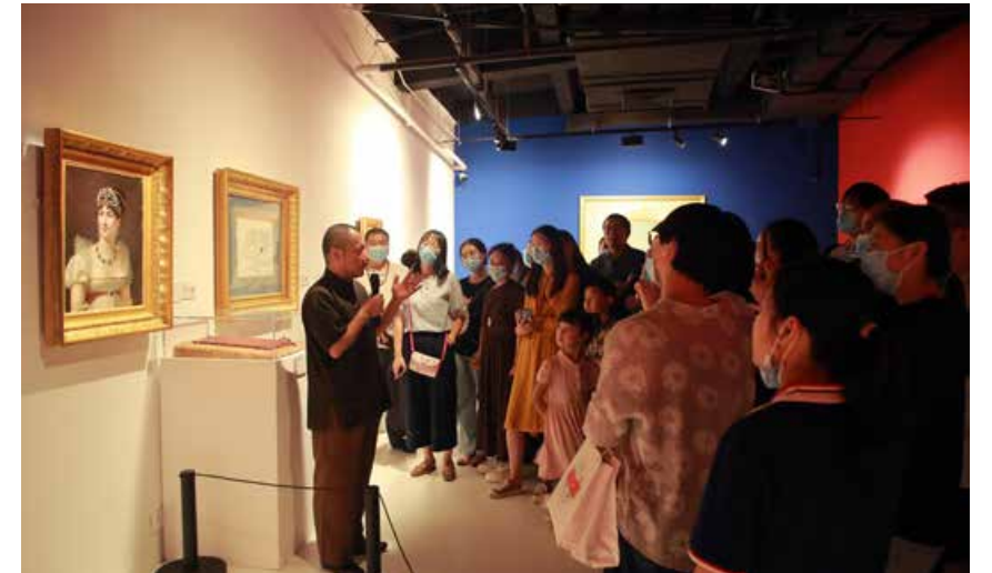
此次特展一经开展，就吸引了诸多观众。 This special exhibition has attracted a lot of audience since its opening.