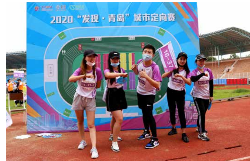
在出发前，选手们跃跃欲试，力争取得好成绩。 Before starting out, all of the contestants were itching to have a go and striving for good results.

city, the 2020 "Discover Qingdao" orienteering challenge started at Qingdao Tiantai Stadium, the Golden Beach Beer City on the West Coast and People’s Square in Chengyang District at the same time. More than 7000 contestants, divided into 36 routes, gathered in a colorful wave, surging in the streets and alleys of Qingdao. They measured and drew the most fashionable street view map of