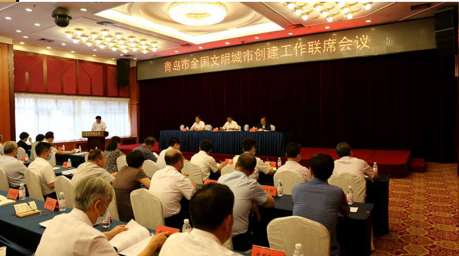
近日，青岛市全国文明城市创建工作联席会议在市级机关会议中心召开。 Recently, the joint conference on the construction of Qingdao into a national civilized city was held in the Municipal Authorities Conference Center.