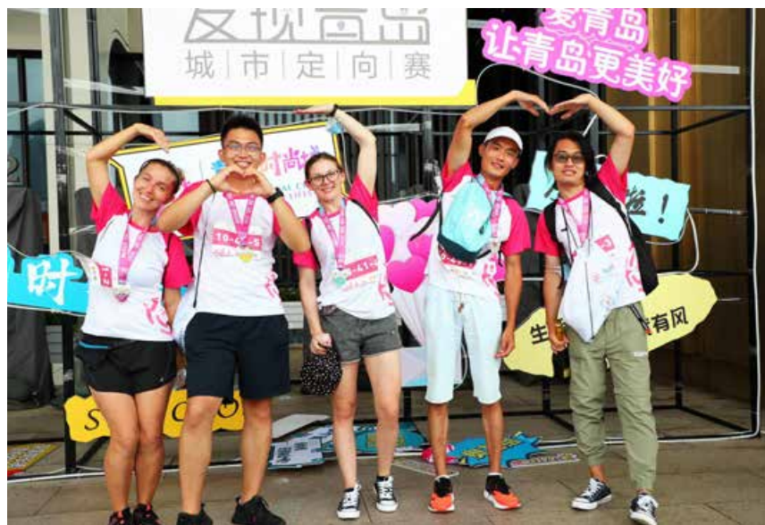
这次比赛中，我们可以看到世界各地的选手参与其中。 In this competition, we can see contestants from all over the world.