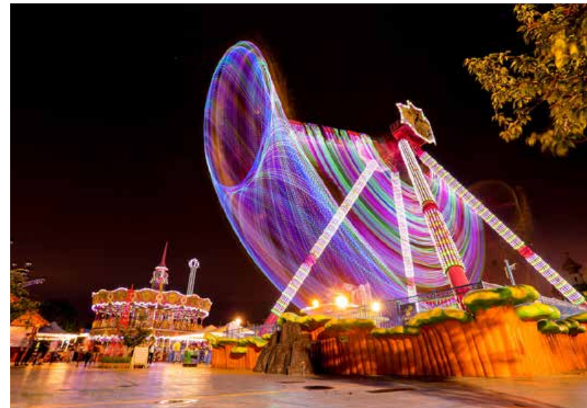
绚丽的色彩让夜晚的方特充满了童话的感觉。 The brilliant colors make Qingdao Fantawild Dreamland look like a fairy land.

After nearly 10 years of operation since its establishment, Qingdao Fantawild Dreamland is a 4A-level scenic spot that is influential in Qingdao and the entire Shandong Province. The large-scale high-tech theme park is meticulously built in line with international first-class concepts and technologies.