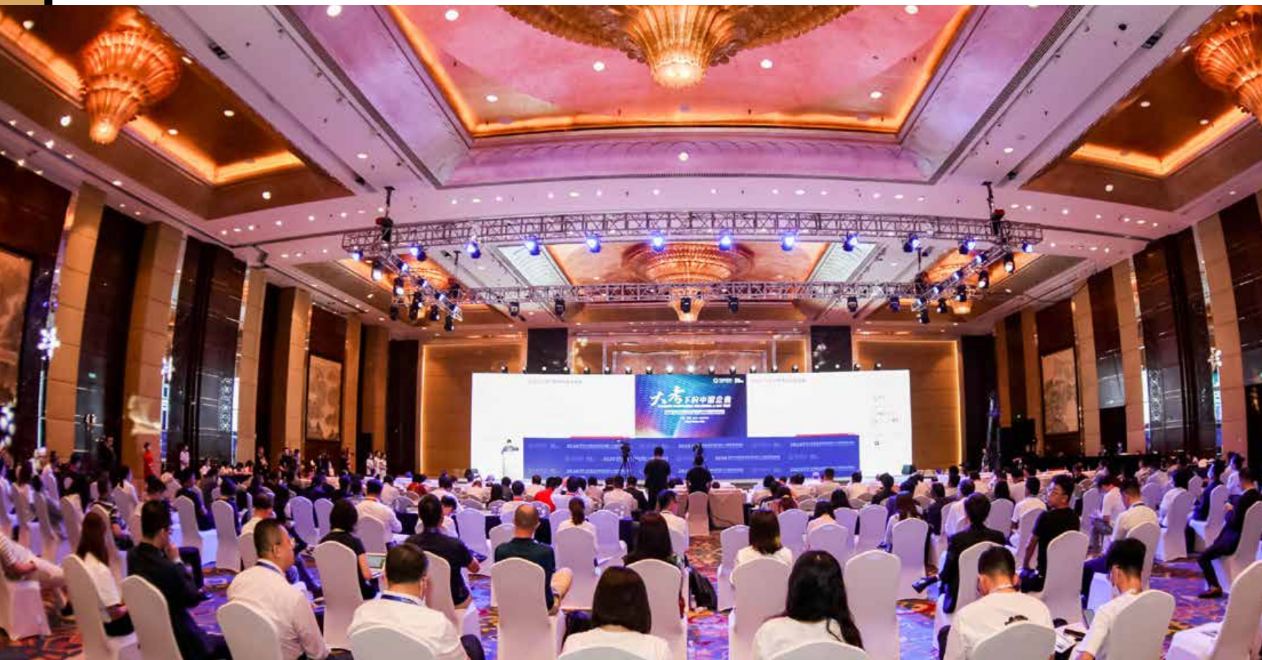
8月30日，2020亚布力中国企业家论坛第十六届夏季高峰会在青岛闭幕。作为本次峰会的主办城市，青岛也收获颇丰，为青岛深化与企业家的交流合作提供了有利契机，为青岛在危机中寻新机、于变局中开新局注入了强劲动力。

On August 31, the 16th Summer Summit of Yabuli China Entrepreneurs Forum 2020 concluded in Qingdao. This summit let Qingdao, the host city, reap a rich harvest, provided a favorable opportunity for Qingdao to deepen exchanges and cooperation with entrepreneurs, and injected new strong impetus into Qingdao in finding new opportunities in crisis and opening up a new prospect in the changing situation.