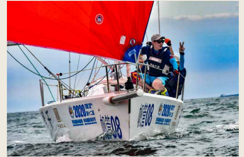
丰富的赛事活动给夏日的青岛注入了来自蓝色海洋的非凡魅力。 The diverse cultural activities have injected extraordinary vitality from the blue ocean to Qingdao in this summer.

据青岛市邮轮游艇协会秘书长柴忠介绍，2020第二届亚太休闲帆船峰会是自疫情发生以来，全国乃至