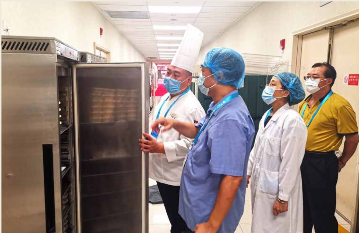
青岛市市场监管局对嘉宾及工作人员如何就餐、厨房现场加工情况等做了细致的指导。 Qingdao Administration for Market Regulation gives detailed guidance on the dining arrangement of the guests and staff and on the kitchen's on-site food preparation.