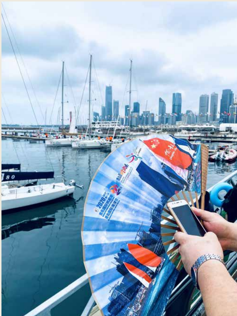
奥帆中心再次成为一片欢乐的“海洋”。 Qingdao Olympic Sailing Center becomes a "sea" of happiness once again.