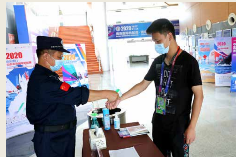
各个出入口设有专人专查，进行体温检测。 Each of the entrances and exits is guarded by one person to conduct temperature measurement.