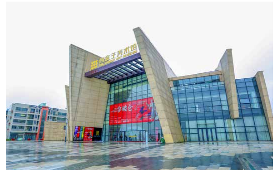
此次特展在黄盒子美术馆进行展出，展览持续至11月15日。 The special exhibition “The Legendary Napoleon” is held in the Yellowbox Art Museum and will last until November 15.

对此，中国美术家协会理事、中国美术家协会水彩艺委会委员、青岛市文联主席、美协主席、青岛大学美术学院院长王绍波向本次展览的成功举办表示祝贺，他说：“中国这只拿破仑口中的东方雄狮已经崛起，在2020年中法两国建交56年之际，‘传奇拿破仑’特展首登山东，亮相青岛。青岛作为海上战略合作试点，从海外引进这样的国际级大展，充分展现了青岛打造现代化国际大都市的决心和信心。得益于黄盒