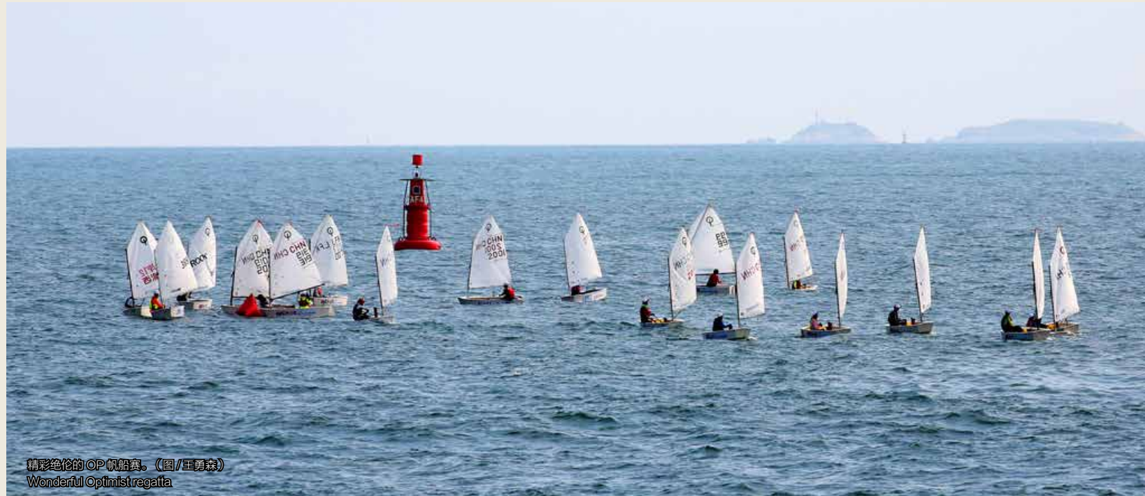
精彩绝伦的OP帆船赛。(图/王勇森) Wonderful Optimist regatta

仲禾、苏州西曼帆船俱乐部队的潘小佑分别获得了男子金组、女子金组、男子银组和女子银组的冠军；胡锦涛、王子慧、胡良财和邱青竹分别包揽了2020“龙湖杯”青岛国际帆船赛激光级男子场地赛、激光级女子场地赛、帆板公开组场地赛、J80级场地赛的冠军；遥控帆船大奖赛主要以新手体验为主，引入竞赛元素，赛事共分两场进行，于8月15日顺利结束。