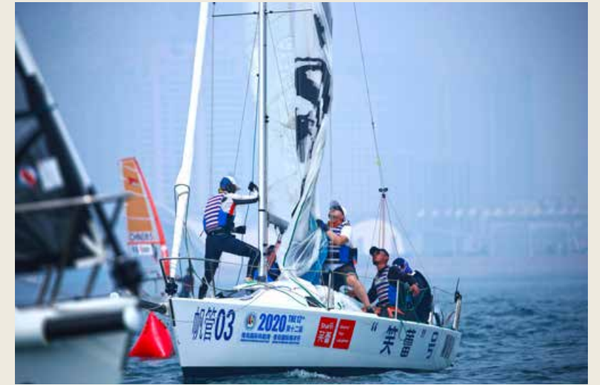
利用帆船周·海洋节平台开发增量、延长产业链，与不同品类业态深入合作。 Leverage the platform of Sailing Week · Marine Festival to develop increment, extend the industrial chain, and conduct in-depth cooperation with different types of business.

青岛笑蕾食品与青岛国际帆船周·青岛国际海洋节的合作可以说是水到渠成，有着同样对的时尚态度，同样的开放包容。因此，美味与梦想，都是不可辜负的。