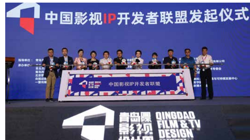
中国影视IP全球开发者联盟发起仪式。 Global Motion IP Developer Conference