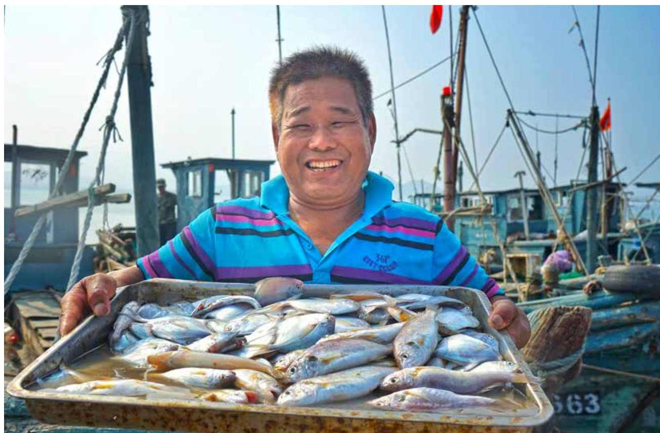
收获满满的渔民们喜上眉梢。 The fishermen with full harvest are very happy.

饭店行政总厨张宏海介绍，煮好的八带改刀备用，将芹菜段和八带放入开水中烫一下，放入冷水中过凉，芹菜段和八带加盐拌匀，撒上辣椒、花椒、香葱粒，泼上热油炸出香味，与八带和芹菜拌好即可。