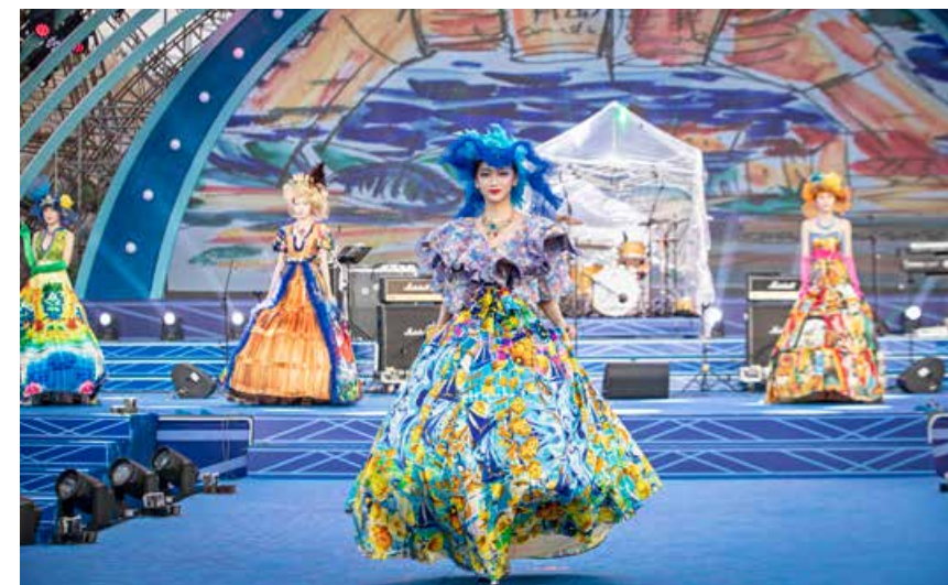
“时尚青岛·啤酒文化时装秀”。 “Fashion Qingdao · Beer Culture Fashion Show”