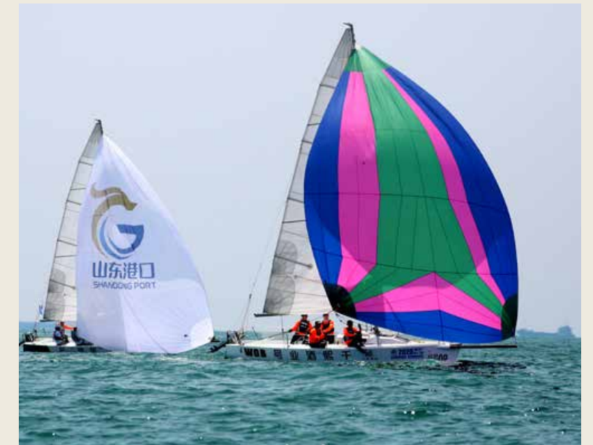
通过政府搭建的“帆船之都”品牌推广平台，越来越多的社会力量搭上青岛奥帆发展的“顺风车”。 Through the Sailing City brand promotion platform built by the government, more and more social forces have got on the "ride" of Qingdao Olympic sailing development.

过大数据驱动实现全球用户一键下单、个性定制、柔性生产、绿色智造的创新升级，全面转型互联网科技内衣公司，公司也从原来的红妮制衣有限公司正式创新升级为恒尼智造（青岛）科技有限公司。