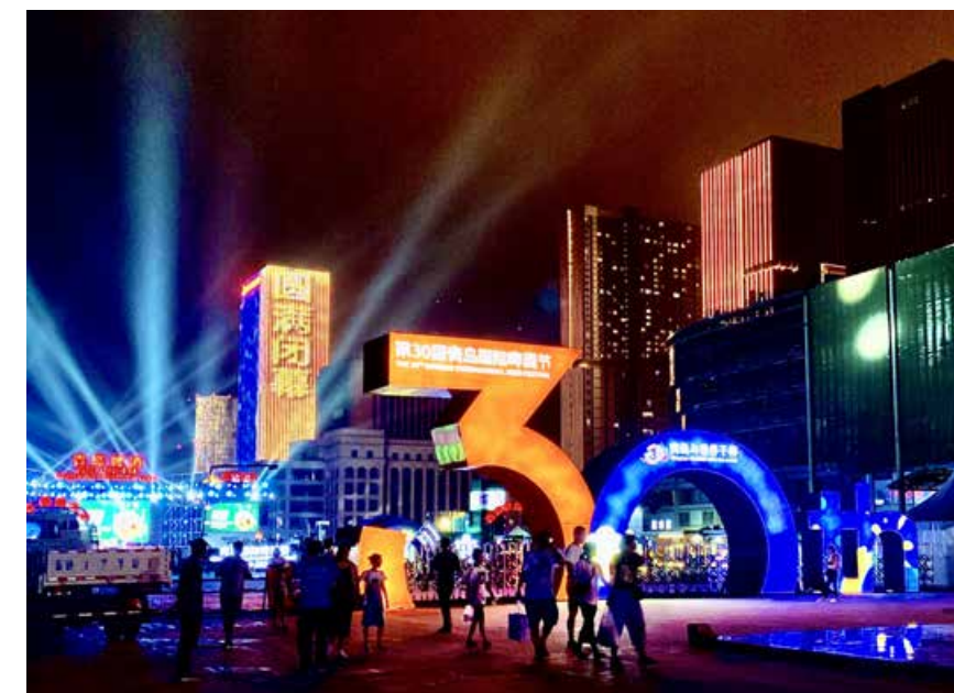
青岛国际啤酒节是青岛最具开放性、最有城市特色、最具有国际性的节庆活动之一。 Qingdao International Beer Festival is one of the most open, urban and international festivals in Qingdao.

崂山区文旅委节庆办刘洪涛介绍，本届啤酒节由单一的节日会场向全域跨跃，除世纪广场啤酒城主会场外，还在沙子口、王哥庄和北宅3个街道设置了分会场，在丽达购物中心、石老人