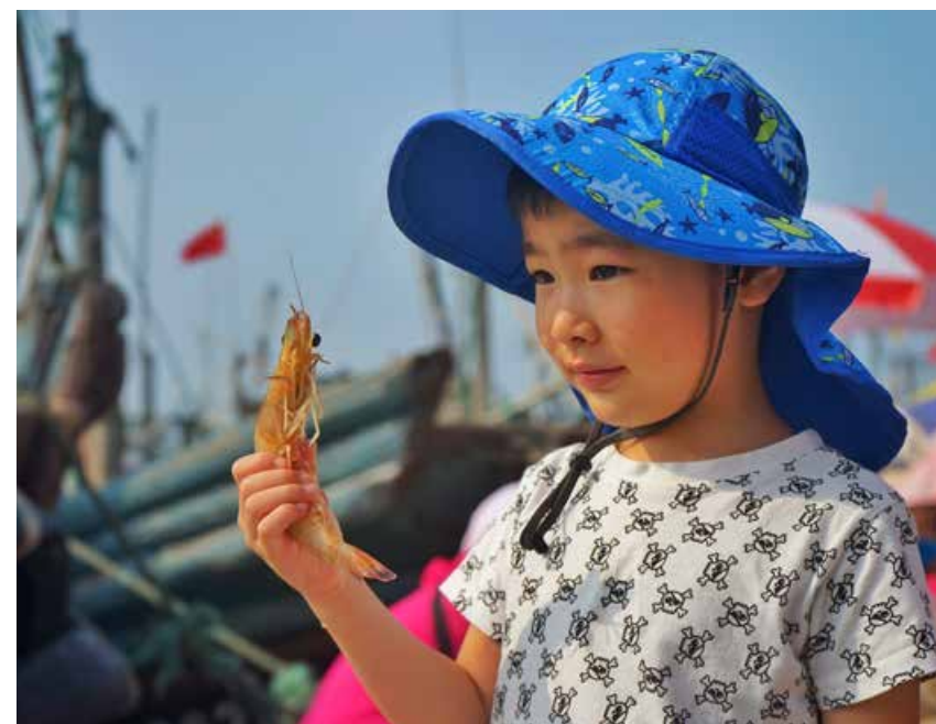
在开海第一天，许多市民带着孩子到码头感受丰收的喜悦。 On the first day of the fishing season, many citizens took their children to the pier to feel the joy of harvest.

鲜而质量好的海蛎子，蛎体饱满或稍软，呈乳白色，体液澄清，白色或淡灰色，有海蛎子固有的气味。质量差的海蛎子，色泽发暗，体液浑浊，有异味，不能食用。