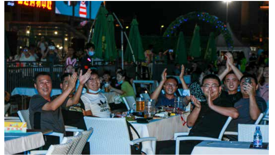
时间在无声地印证着青岛产业发展的巨大进步，见证着青岛啤酒节的发展壮大。Time is silently witnessing the great progress in Qingdao's industrial development and the growth of Qingdao Beer Festival as well.

In the summer of 2020, an urban emotional TV series Nothing But Thirty was frequently discussed as a trending topic.