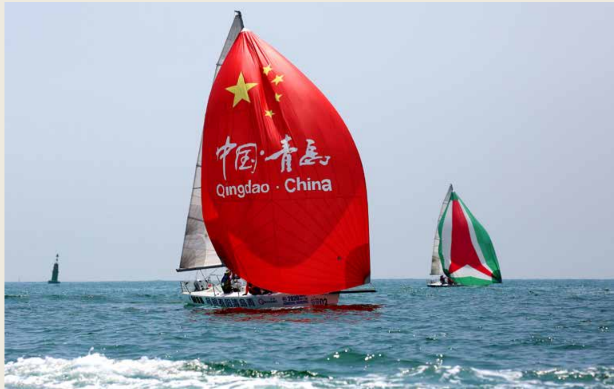
本届帆船周·海洋节秉持开放办体育的生态思维，充分聚合社会资源。 Adhere to the ecological thinking of opening up sports events and fully mobilize social resources.

工艺，深扎贵州茅台镇 7.5 平方公里核心产区，守初心，集匠心，专注传统酿造工艺，只做正宗坤沙酒。