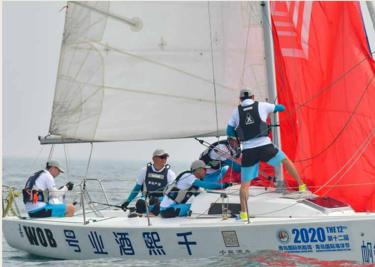
如今，更多的社会品牌实施品牌协同、融合发展。 Nowadays, more and more social brands are seeking coordinated and integrated development.

动力电池、电动叉车电池，特种车辆（邮政车、物流车、环卫车等）动力类电池产品；拥有移动电源、汽车应急启动电源、户外多功能电源以及电池管理系统等消费类电池产品；同时公司提供全方位的能源储能工程设计和安装施工服务，目前具备年产 500 万功率的各类锂电池的能力。