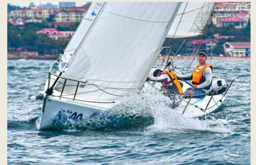
7项赛事展开了一场精彩的角逐。 The seven sailing events have presented wonderful competitions.

On August 16, the closing and awarding ceremony of the 12th Qingdao International Sailing Week · Qingdao International Marine Festival 2020 was held in Qingdao Olympic Sailing Center, marking the successful conclusion of the 9-day event. The splendid sailing competitions, diverse cultural activities and colorful fashion sports held in