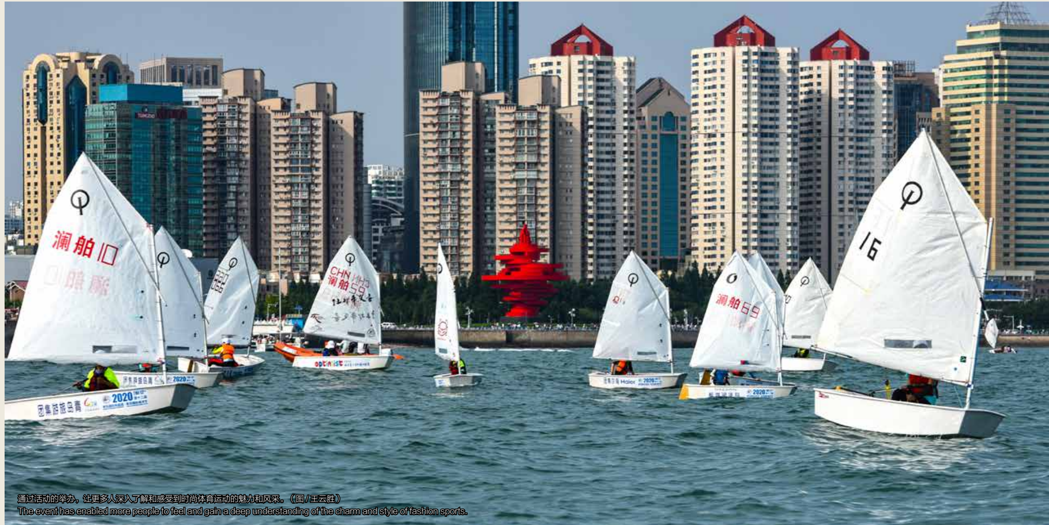
通过活动的举办,让更多人深入了解和感受到时尚体育运动的魅力和风采。The event has enabled more people to feel and gain a deep understanding of the charm and style of fashion sports.

传帆船周·海洋节公益视频;与滴滴出行合作,8月8日投放帆船周海洋节公益开屏广告,覆盖200万用户群,同时开发帆船周专属优惠乘车券,8月8日投放帆船周朋友圈广告,覆盖50万用户群;与爱青岛合作开展“我为帆船之都”公益代言活动,邀请徐京坤等体育运动员以及各界社会代表为帆船之都打call;与必胜客30周年品牌融合,冠名首个必胜客中国地区“帆船之都扬帆必胜”品牌店,同时在必胜客中国地区所有门店播放帆船周·海洋节宣传视频;与琴岛通对接,发行帆船