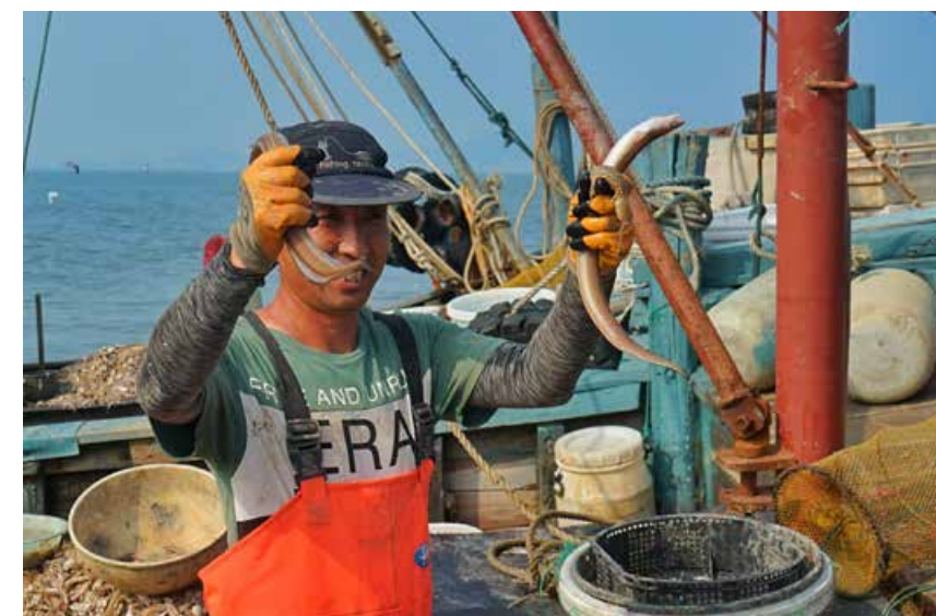
渔民们说，今年的产量和品种跟往年差不多，价格也和往年持平。The fishermen said that the yields and varieties of this year are almost the same as those in previous years, and the price is also the same as that of previous years.

除了港东码头的海鲜，会场社区的螃蟹随着开海也迎来了丰收季，刚刚捕捞上岸的螃蟹直接放到退潮形成的天然海水池，以保证其新鲜。我们了解到，今年螃蟹的产量和价格跟往年差不多，