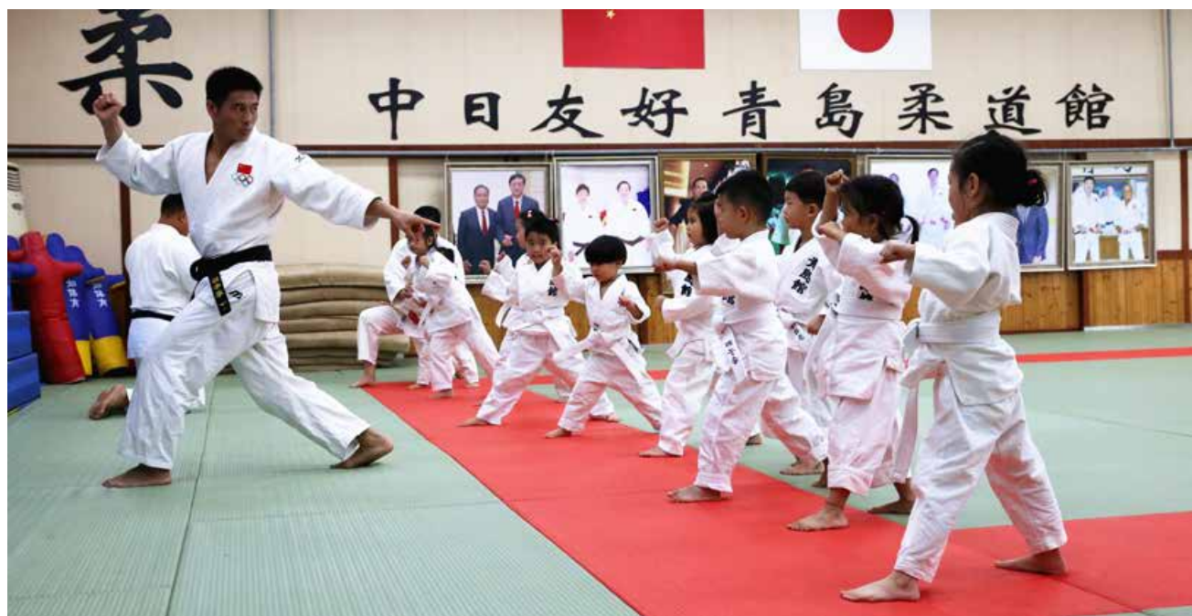
青岛柔道在世界上取得了一定成绩。 Qingdao has made some achievements in judo in the world's competitive sports.