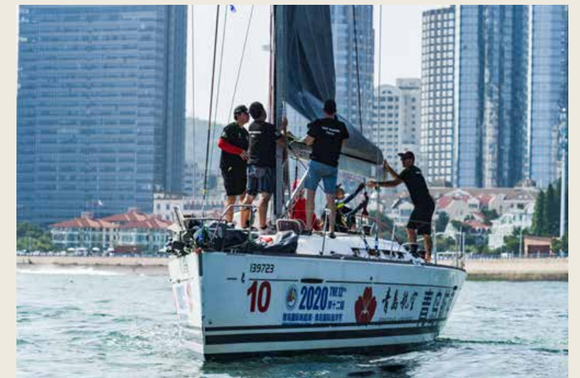
民间资本成为激发帆船赛事活力“新动能”。 Private capital has become the "new growth driver" to stimulate the vitality of sailing events.

yardsticks to assess the cultural influence and brand value of the festival activity.