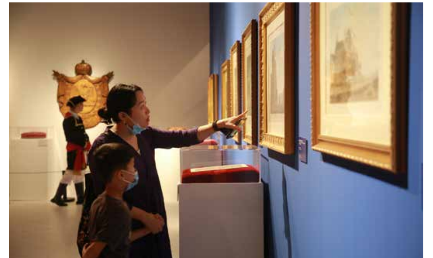
通过了解得知，此次展览特意为不同年龄段的观众准备了丰富多彩的各式文化活动。 It is known that the exhibition specially prepares a variety of cultural activities for audiences of different ages.