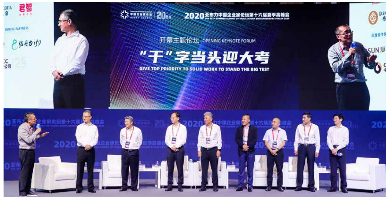
今年亚布力企业家论坛夏季高峰会以“大考下的中国企业”为主题，企业家们聚焦工业互联网、数字化转型、大健康等重点领域进行了广泛深入交流。 This Summer Summit of Yabuli Entrepreneurs Forum takes "Chinese companies standing a big test" as the theme. Entrepreneurs focused on the industrial Internet, digital transformation, comprehensive health and other key areas for extensive and in-depth exchanges.

一个开放创新、便利舒心的发展平台，建设产业链、资金链、人才链、技术链“四链合一”加优质高效政务服务环境的“4+1”发展生态，与大家一起，共同打造中国长江以北地区国家纵深开放新的重要战略支点，共同发挥好青岛在推动国内大循环中的“双节点”作用，共同建设中国北方新一轮高质量发展的创新基地，共同推动胶东经济圈成为中国北方新一轮高质量发展的创新基地，共同推动胶东经济圈成为中国北方新一轮高质量发展的增长极。