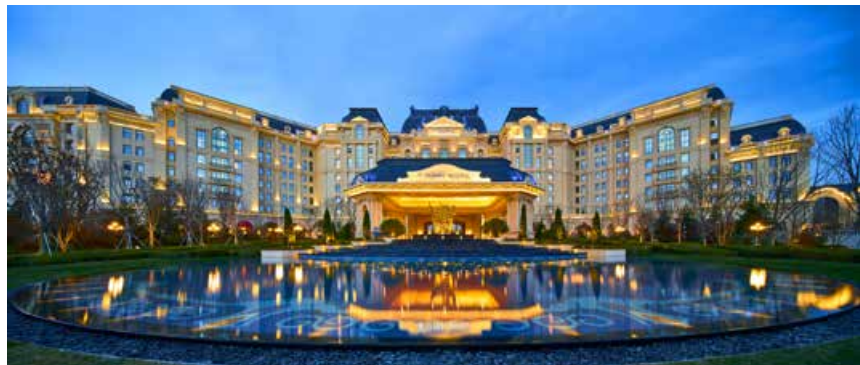
青岛东方影都融创万达文华酒店 Wanda Vista Qingdao Oriental Movie Metropolis