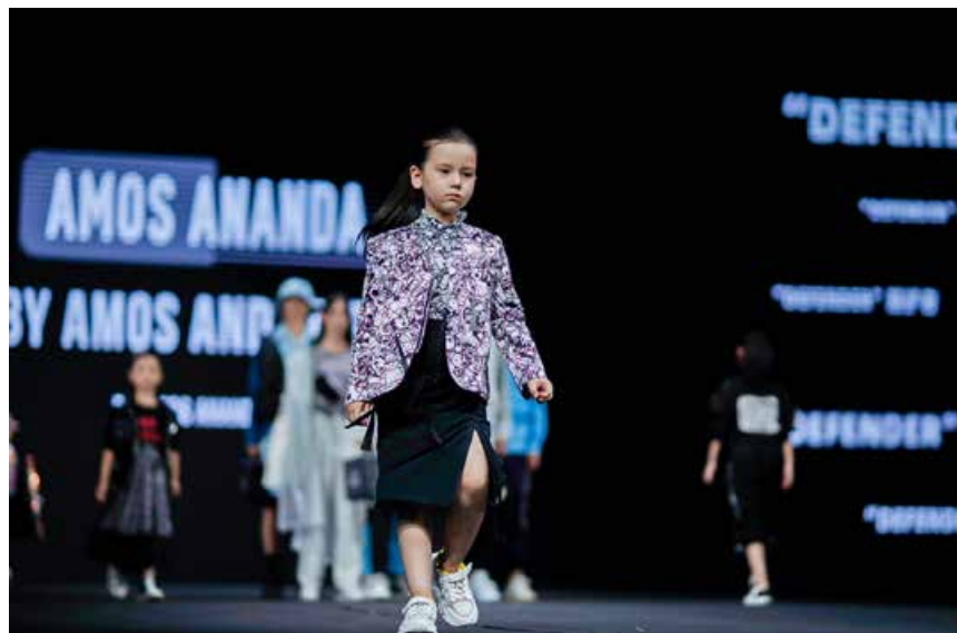
秀场上的童模，也十分吸引眼球。 The children models on the show stage are also very eye-catching.

师作品的设计创意的同时，还能够领略到魅惑神秘又充满浪漫梦幻的戏剧色彩和多维度艺术感受。