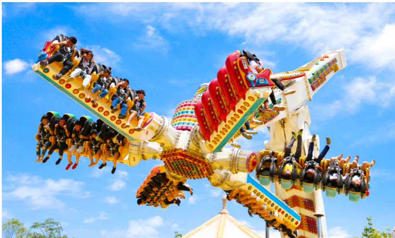
精彩刺激的游乐设施，令人兴奋不已。 The exciting amusement facilities are quite a thrill.

“8分钟环游世界”著称的“飞越极限”是游客们争相体验的室内项目；“聊斋”运用幻影成像、瞬间消失移位等电影特效技术为游客讲述了人鬼相爱不能相守的凄美爱情大戏；行船在如梦似幻的西湖之畔上再体验一番南宋风情，再看一看《白蛇传》里白素贞与法海大战三百回合的“水漫金山”；在“高空飞翔”上换个角度看世界，发现方特别样的美众多精彩好玩的项目满足了大朋友们和小朋友们的节日游园需求。