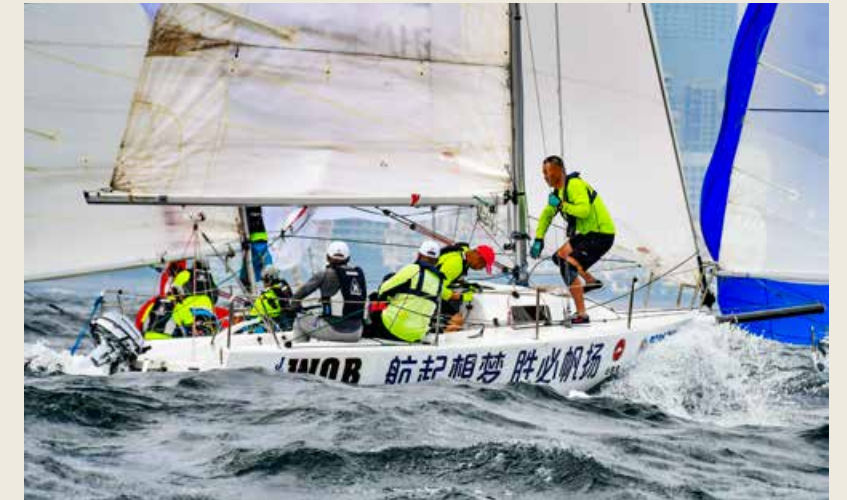
本届帆船周·海洋节荟萃了更多的新思想、新创意、新体验、新市场在这里生根壮大。This Sailing Week · Marine Festival has catalyzed the birth of more new thoughts, new ideas, new experiences and new markets.

青岛这座“帆船之都”由“零”开始,从无到有,再到今天拥有了属于自己的帆船赛事盛会,走出了一路的精彩,帆船之都“青岛模式”正在成型,本届帆船周·海洋节荟萃了更多的新思想、新创意、新体验、新市场在这里生根壮大,以赛事为契机,搭建沿海城市海上时尚体育合作平台,进一步推进参与城市间体育、文化、经贸交流与合作,助力沿海城市海洋经济发展转型,让更多的人感受到青岛活力青春的城市气质。