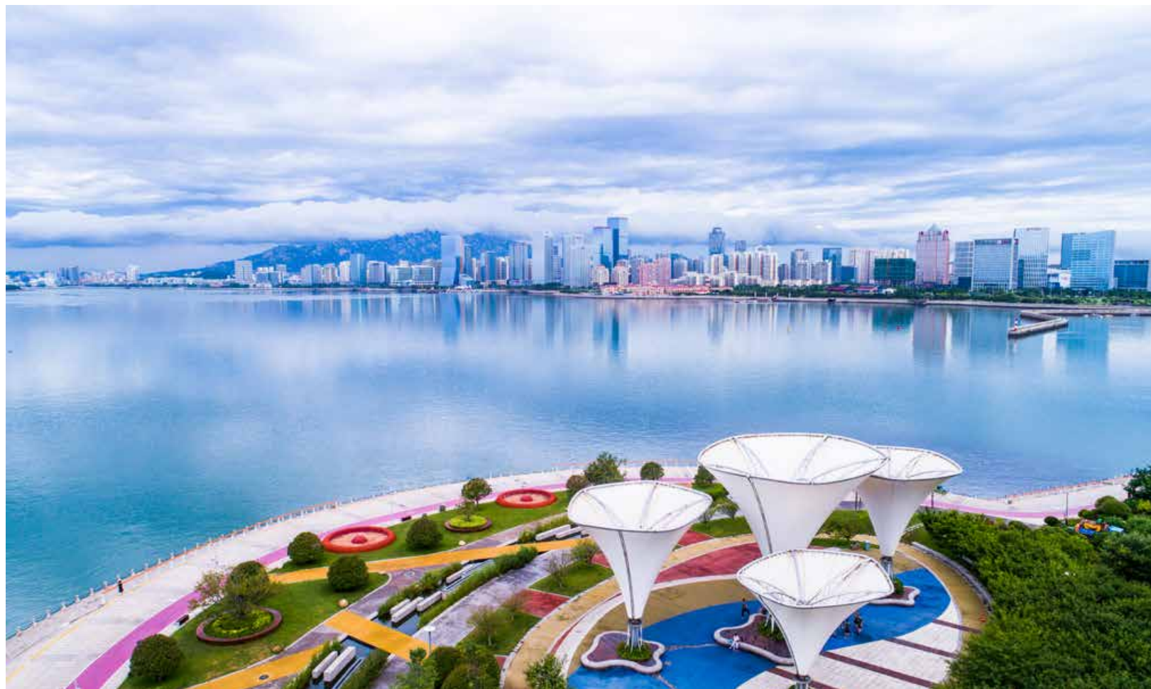
青岛西海岸新区唐岛湾的秀丽景色。 The beautiful scenery of Tangdao Bay in Qingdao West Coast New Area.

Exhibition by the Sea: Fulfilling Commitment