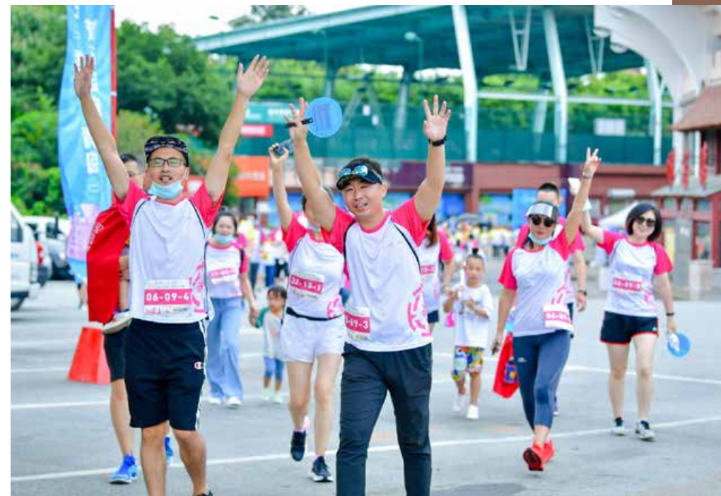
比赛开始后，7000余名参赛选手，兵分36路，聚合成彩色的浪潮，涌动在青岛的大街小巷。 When the competition started, more than 7,000 contestants, divided into 36 routes, gathered into a colorful wave, surging in the streets and alleys of Qingdao.