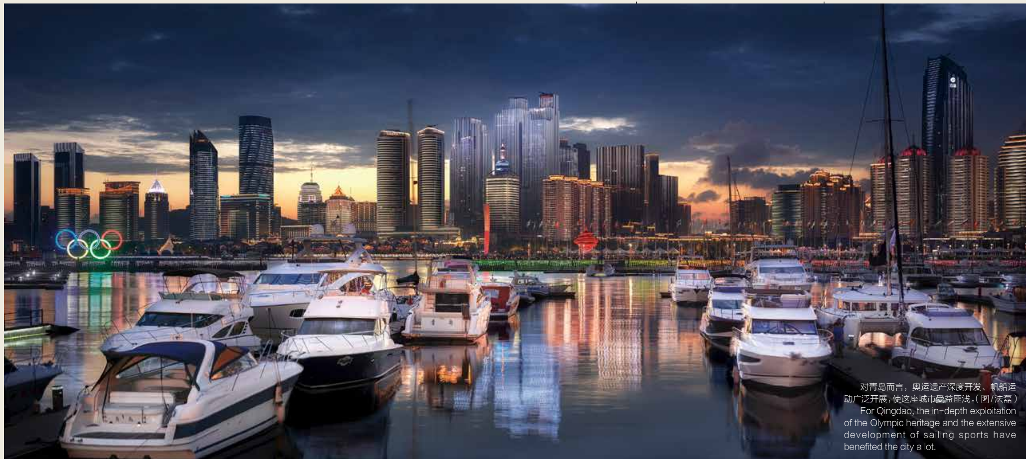
对青岛而言，奥运遗产深度开发、帆船运动广泛开展，使这座城市受益匪浅。 For Qingdao, the in-depth exploitation of the Olympic heritage and the extensive development of sailing sports have benefited the city a lot.

Sailing City: making the international city more charming