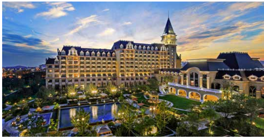
青岛金沙滩希尔顿酒店 Hilton Qingdao Golden Beach