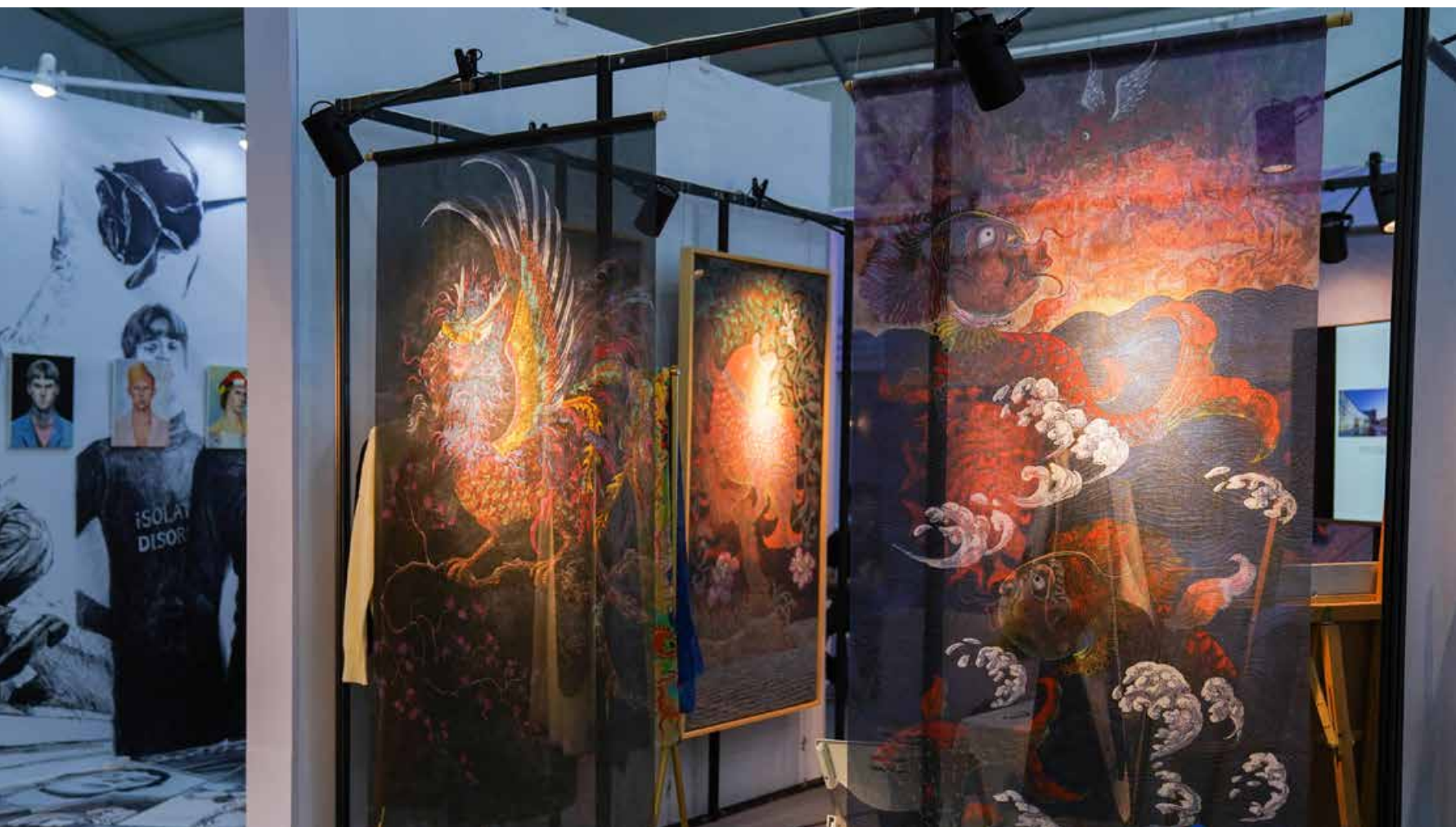
2020 青岛国际影视设计周齐聚国内外顶级时尚、影视、设计界的领导、专家及企业代表，多方顶尖资源在此共享、文化创意在此碰撞，激发了青岛和西海岸新区影视、设计、时尚等产业创新活力。

The 2020 Qingdao Film & TV Design Week gathered domestic and foreign leaders, experts and enterprise representatives from the top fashion, film and television and design circles. Many top resources were shared here and cultural creativity sparked, inspiring the innovation vitality of the film and television, design, fashion and other industries in the West Coast New Area and in Qingdao.