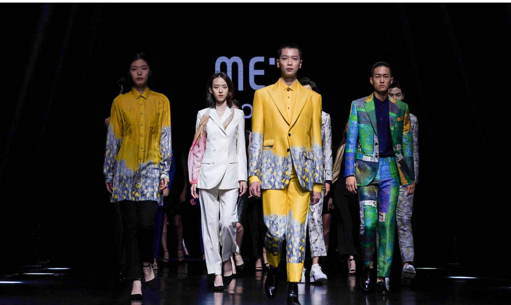
每一届青岛国际时装周，都是一次时尚潮流的聚会。 Every Qingdao International Fashion Week is a gathering of fashion trends.