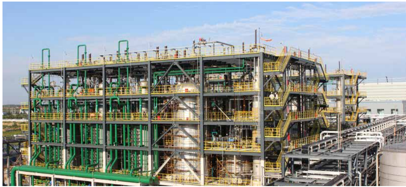
凝聚着海湾人智慧和汗水的二期项目步入了一个新的阶段。 The phase II project, which embodies the wisdom and sweat of the people of Haiwan Chemical, has entered a new stage.

标明确、组织严密、措施得力、成果显著，做到了疫情防控与安全管理无缝对接，精准精细，密集出台了17个文件，覆盖全区域、全流程的工作措施。企业领导分片包干，既对业务负责又对防控负责，各部门分兵作战，责任到岗、到人，把措施落实、落细。公司与1100多名职工签订了疫情防控承诺书，并配合当地政府、公安等部门，对职工户籍地和居住地进行了大摸底、大统计和大排查。同时，出台了职工疫情防控考核奖惩办法。