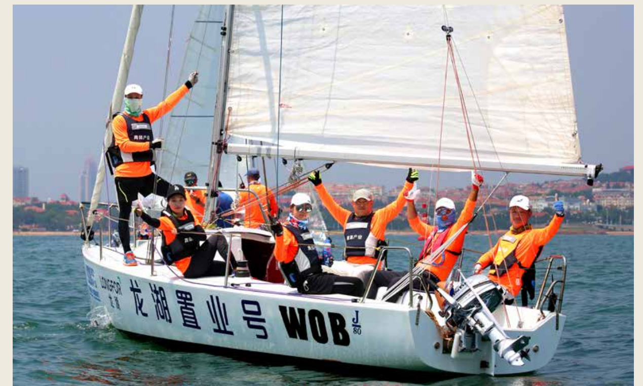
青岛国际帆船周·青岛国际海洋节是一个开放的品牌，是基于“帆船之都”开放活力时尚体育的夏日狂欢。 Qingdao International Sailing Week · Qingdao International Marine Festival is an open brand as well as a summer carnival based on the open, dynamic and fashionable sports of the Sailing City.

帆船盛宴，两艘“千熙酒业”冠名的帆船穿梭于碧海蓝天间，乘风远航，逐梦海洋，助力体育赛事强势复苏，提振时尚体育社会消费信心，为“帆船之都”注入浓郁酱香风味，助力青岛帆船周·海洋节千帆竞发。千熙酒业也将承袭帆船比赛运动的精神，专注酿造工艺，争创一流酒业名牌。2020年突如其来的新冠肺炎疫情，使酒水行业面临巨大挑战，千熙酒业以强大的品牌实力和品质自信，迎难而上，创造佳绩。逆风中的勇气和胆魄源自千熙酒业常年积累的过硬品质，多年来千熙酒业深知无品质不成器，遂自品牌成立之初就坚持“诚信立业，品质立世，勤勉立身”的经营理念，不跟风逐利，不急于求成，严格秉承茅台镇酱香型白酒的酿造