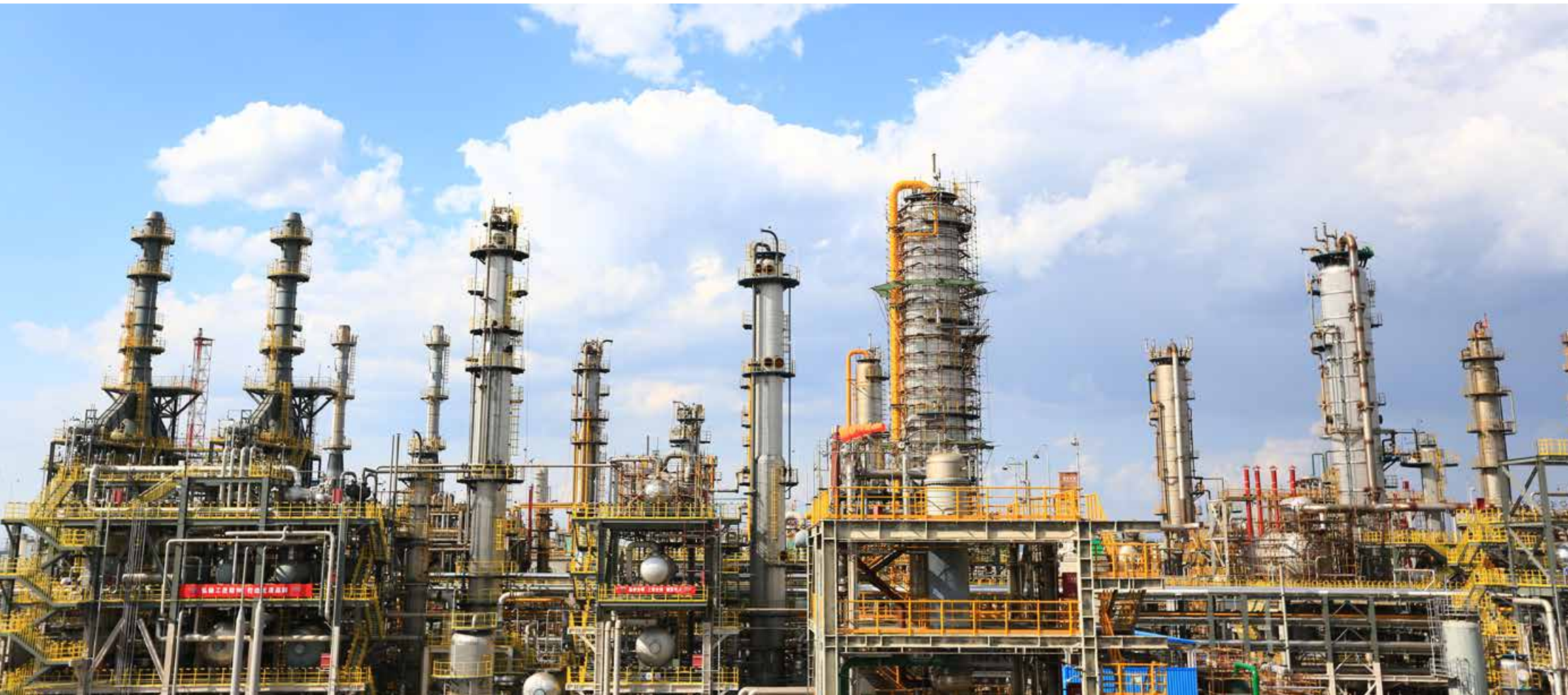
海湾化学 40 万吨 PVC/VCM 二期项目和氯气子项目试车投产动员大会如期召开。 The mobilization meeting of the test run and production of Haiwan Chemical 400,000 tons PVC/VCM phase II project and chlorine sub project is held as scheduled.

Haiwan Chemical Launches its test run to realize a 10-billion leaping development