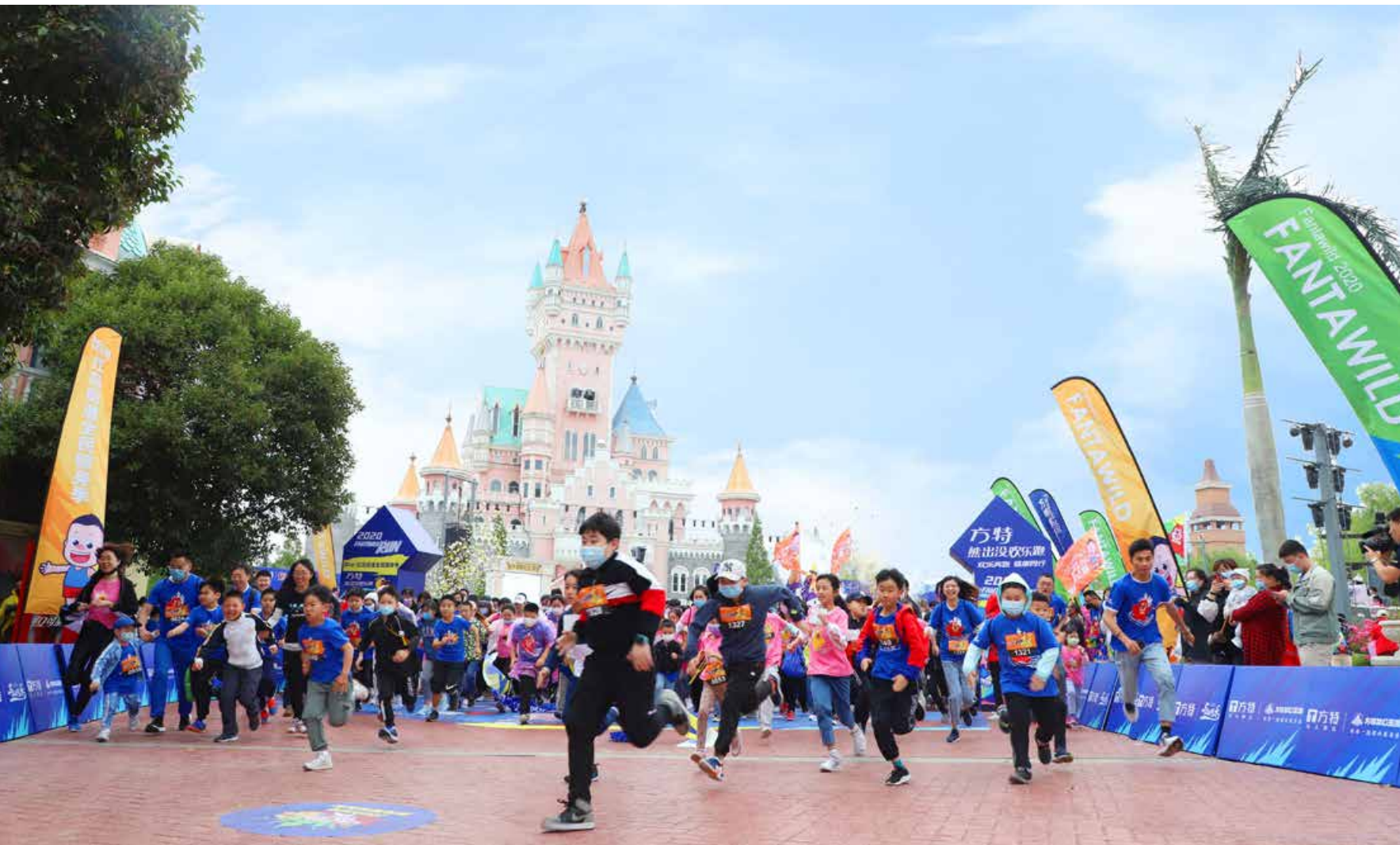
青岛方特梦幻王国打造的“熊出没欢乐跑”活动备受家长和孩子的青睐。 The "Boonie Bears Fun Run" activity organized by Qingdao Fantawild Dreamland is very popular with parents and children.