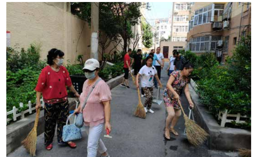
青岛市市北区各部门、各街道立即行动，迅速整改，全力以赴投入到创建全国文明城市工作中。（图片提供 / 中共青岛市委宣传统战部） All departments and streets in Shibei District of Qingdao city took immediate actions to rectify the situation quickly and devote themselves to the work of building a national civilized city.

程，关键要压实责任、凝聚合力。各级各部门要各负其责、密切配合，宁可向前一步形成交叉，也不能退后一步留下漏洞，决不允许推诿扯皮。各级领导干部要身先士卒，当好指挥员，更要当好战斗员，亲力亲为、亲自动手，现场发现问题、解决问题，做出表率。群众的力量是无穷的。要发动基层党员群众参与创城工作，营造人人动手、美化家园的浓厚氛围。