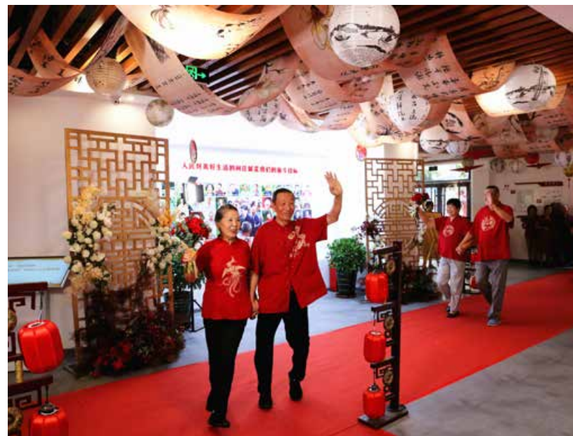
在七夕节来临之际，“我们的节日·七夕”主题系列活动在青岛市李沧区启动。 On the occasion of the Qixi Festival, a series of activities with the theme of “Our Festival · Qixi” were launched in Licang District, Qingdao.

七夕节期间，青岛市还将举办爱情故事展、家风文化节、民俗书法笔会、电影放映周、七夕合唱节、诗词朗诵会等一系列活动，倡导爱情忠贞、家庭和睦、社会和谐、孝老爱亲等中华民族优秀传统文化，培育和践行社会主义核心价值观，推动新时代新风尚的节日习俗深入人心。