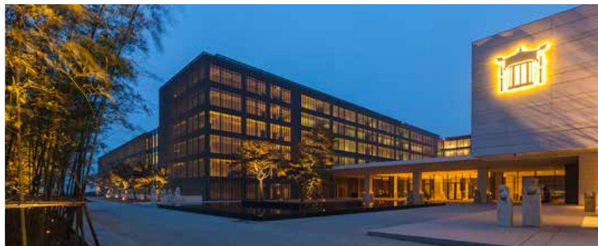
青岛涵碧楼酒店 The Lalu Qingdao

On June 9, the 84th China International Pharmaceutical API/Intermediate/Packaging/Equipment Fair (API China) was successfully held in Qingdao Cosmopolitan Exposition located in Qingdao West Coast New Area. It is the first national professional exhibition, taking the lead in hosting national exhibitions