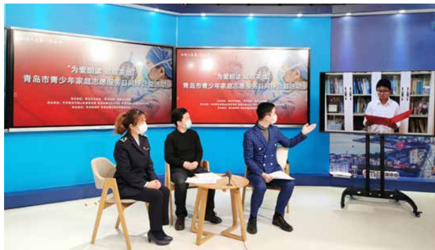
青岛市崂山区连续开展了“为爱朗读、致敬英雄”“传承英烈精神、争做时代新人”“致敬平凡劳动者、点赞伟大新时代”多期主题活动，210个班级和公益团体成立青少年家庭志愿团，1.1万个“志愿家庭”加入其中。

Laoshan District of Qingdao has carried out five theme activities including "reading aloud for love, paying homage to heroes", "inheriting heroic spirit, striving to be a new generation of the times", "paying tribute to ordinary workers and praising the great new era". 210 classes and public welfare groups set up youth family volunteer groups, and 11,000 "volunteer families" joined it.