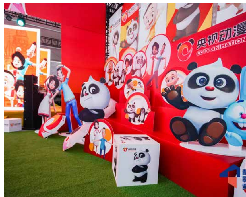
在2020 青岛国际影视设计周现场，部分国产动画主题展区吸引人们的眼光。On the spot of the 2020 Qingdao Film & TV Design Week, some domestic animation theme exhibition areas attract people's attention.

青岛西海岸新区，意味着青岛国际影视设计周的资源落地平台正式成立，而作为青岛设计中心首批入驻机构，中韩设计交流中心的建设标志着青岛设计周国际化资源引入与合作正式启动。