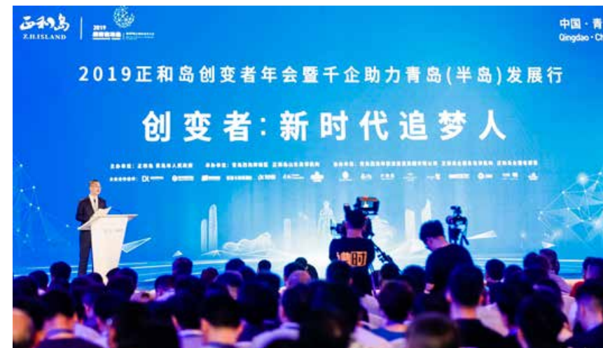
2019年正和岛创变者年会暨千企助力青岛(半岛)发展行活动举行。 The 2019 Annual Conference of Zhisland Changemaker Summit and Thousands of Enterprises Support Qingdao (Peninsula) Development Activity was held.

大珠山畔，青岛世界博览城丝带铺开式设计，寓意着这里海上“丝绸之路”北部起点的特殊身份。可容纳6000余个标准展位的20万平方米展览面积，13.2万平方米的国际会议中心，让这里