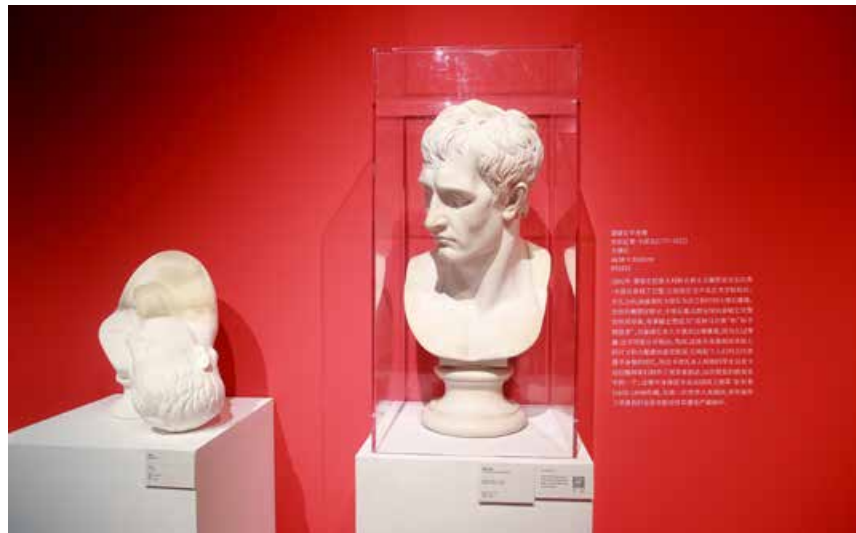
据了解，本次特展分为“传统”与“当代”两大版块。 It is known that this special exhibition is divided into "traditional" and "contemporary" sections.