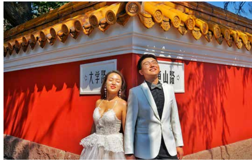
如今的大学路，依然是人们向往的打卡之地。 Daxue Road is still an attractive go-to destination today.

记忆中的大学路，洗尽铅华，不施粉黛，一面红墙依然故我，阅尽黄昏，聆听百年沧桑，驻足，且听风吟。站在道路的端点望去，你会发现路旁排满了浓荫蔽日的法国梧桐，暂且不知道年份，应该是伴随着青岛的成长一路走来的吧。岁月在其粗壮的树干下雕刻着苍老的年轮。苍翠挺拔，配合着道路两旁的美好，不禁让人忘却摩肩接踵的浮躁与烦恼。沿着大学路缓缓地走着，傍晚落日余晖和路灯下的树影婆娑，就算独自一人也显得温馨浪漫。没有茶荣喧嚣的气息，更像是在市井之间，没有拥挤的车流，脚下偶尔会有老的青石砖铺设的