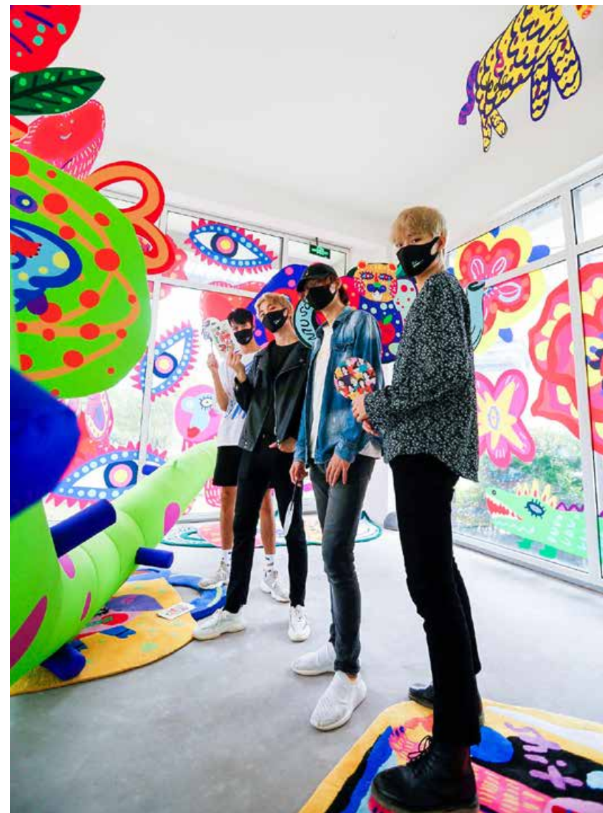
青岛，也借由时装周的举办成为了潮流聚集地。 By holding the fashion week, Qingdao has become a fashion gathering place.

On the evening of September 1, Oriental Fashion Season · The 20th China (Qingdao) International Fashion Week was successfully concluded. A grand awarding ceremony was held at the closing ceremony. Many designers, brand owners, models and institutions returned home with honor.