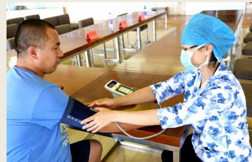
每一年帆船周·海洋节的现场，都能看到青岛市卫健委的医务人员为赛事活动提供医疗保障的忙碌身影。(图/杜永健) Every year, at the venue of the Sailing Week·Marine Festival, we can see the medical staff of Qingdao Municipal Health Commission busy providing medical guarantee for the event.

与此同时，青岛市卫生健康委疾控处负责本届帆船周·海洋节期间疫情防控指导工作。在收到青岛市指挥部转来的青岛市重大国际帆船赛事（节庆）活动组委会办公室《关于举办2020第十二届青岛国际帆船周·青岛国际海洋节的请示》后，青岛市卫生健康委疾控处立即组织专家组对《2020第十二届青岛国际帆船周·青岛国际海洋节疫情防控工作方案》进行了综合研判。专家组认为青岛国际帆船周·青岛国际海洋节举办期间最大的风险点是可能发生的输入性新冠肺炎疫情，建议按照完善后的疫情防控工作方案和应急预案，严格落实各项防控措施，从控制传染源和切断传播途径上防范新冠肺炎疫情的发生，对