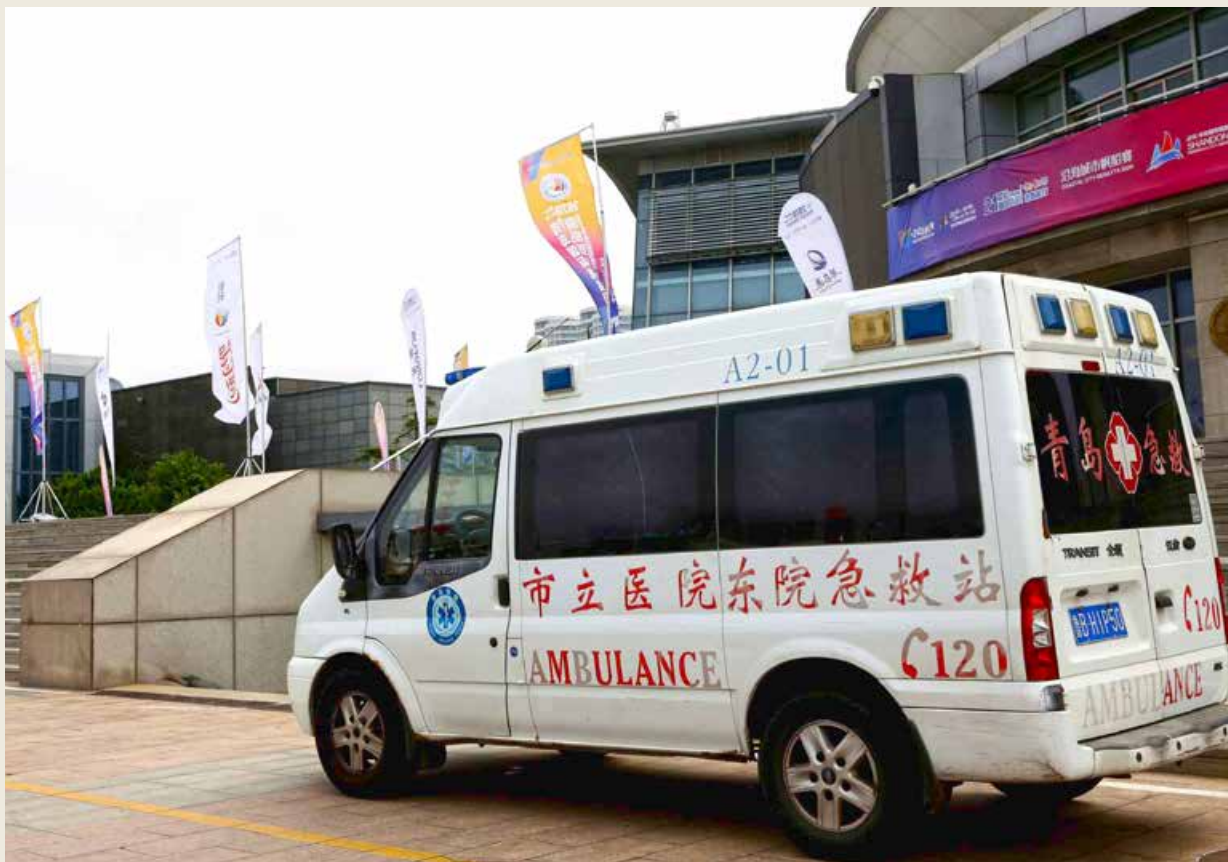
各保障部门在赛事活动期间派遣工作人员、车辆驻会现场。(图/杜永健) The public security authority sends staff to the meeting venue during the event