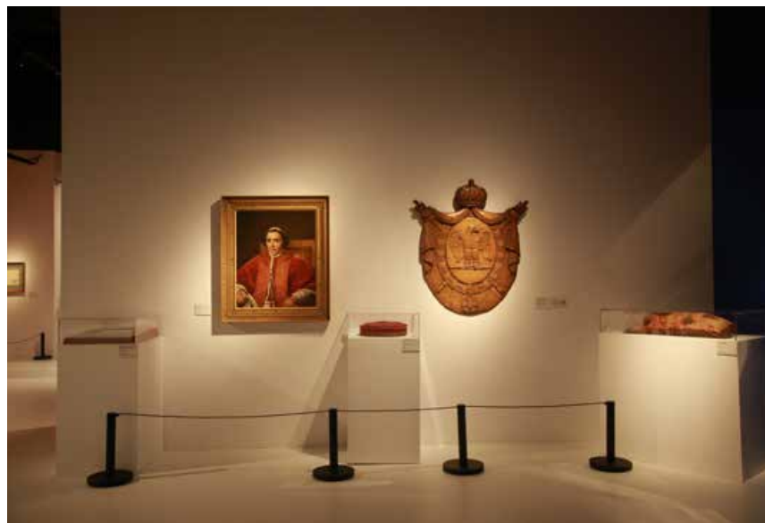
展览一瞥。 A glimpse of the exhibition.

实际上，拿破仑·波拿巴作为18世纪法国大革命中脱颖而出的佼佼者，在象征着自由、平等、民主的法国反封建革命浪潮中，以其耀眼的军事才能和非凡的个人魅力、杰出的领导气质，从科西嘉小岛上没落的贵族一跃成为法兰西第一帝国的君主，多次击退由英国、俄国、普鲁士等组成的反法同盟；使得帝国民生得到改善并扩大了帝国版图；颁布了影响至今的《拿破仑法典》——