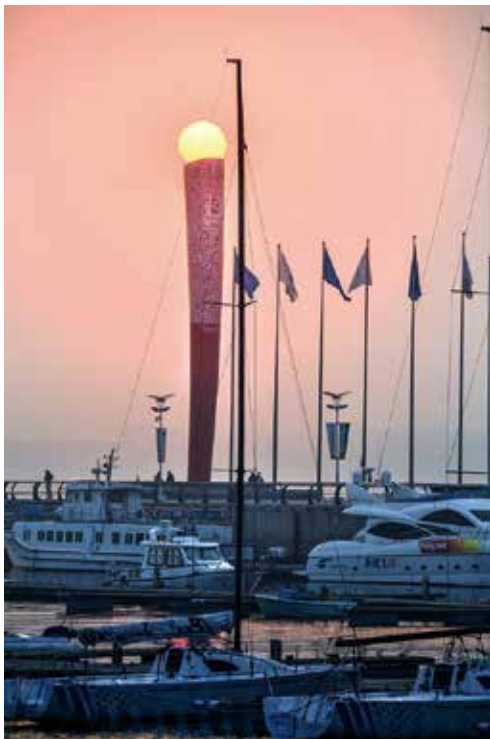
《圣火永恒》

通过信息化系统平台，落实推进责任。按照市委要求，15个攻势都要明确攻坚任务目标，明确责任人、时间表、路线图，把攻坚任务落实落细。青岛国际时尚城市建设攻势项目（活动）系统化管理平台将攻势所有项目、活动、平台全部形成推进情况表，明确推进步骤、时间点，把责任明确到具体负责人。按照推进时