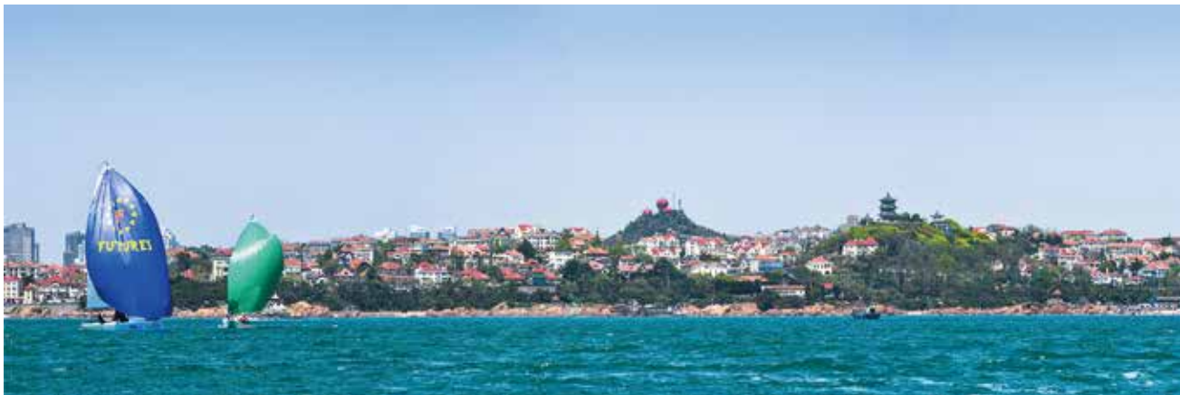
《红瓦绿树 碧海扬帆》