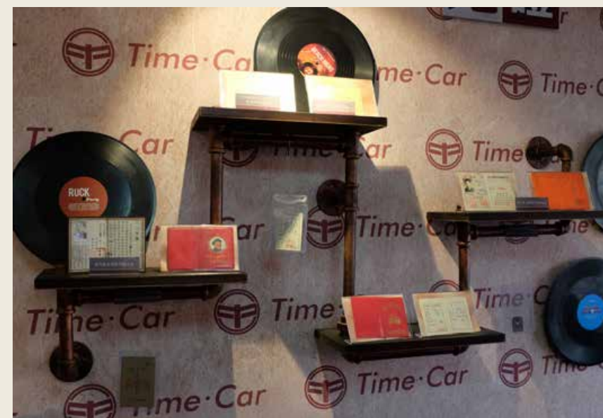
(中国) 道路交通博物馆。Road Transport Museum

解放军攻克敌人三道防线,经历了生死决斗……旧址里的老物件、手榴弹、军号、马鞍等物品再现了那段战火纷飞的岁月。