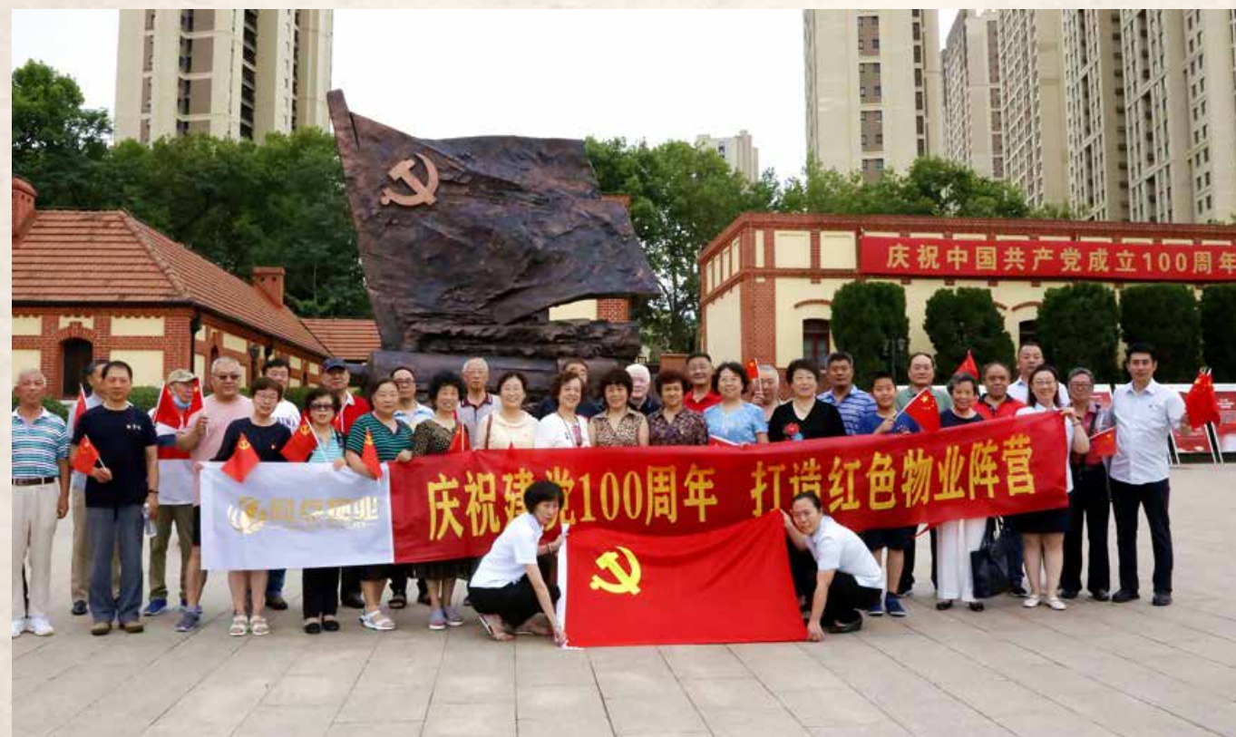
越来越多的人走进中共青岛党史纪念馆，追寻革命足迹。 More and more people walk into Qingdao Party History Memorial Hall to pursue the footsteps of revolutionary martyrs.

The Qingdao Party History Memorial Hall is the only preserved former site of the municipal Party organization in Qingdao in early days. It is a national education base of Party and national history for the next generation, provincial and municipal-level patriotism education base, party history education base, party member education base and a key cultural relic under special protection.