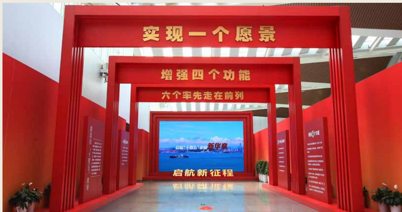
主题展以“奋斗百年路 启航新征程”为主题，精心设计了4个篇章。 With the theme of "A Hundred Years of Hard Work and a New Journey", the exhibition consists of 4 exquisitely designed chapters.

群众获得感、幸福感、安全感。近代以来久经磨难的中华民族迎来了从站起来、富起来到强起来的伟大飞跃，中国特色社会主义进入新时代，迎来了中华民族伟大复兴的光明前景。