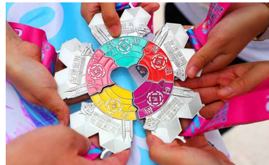
五彩的奖牌也让人眼前一亮。 The colorful medals also made an impression.