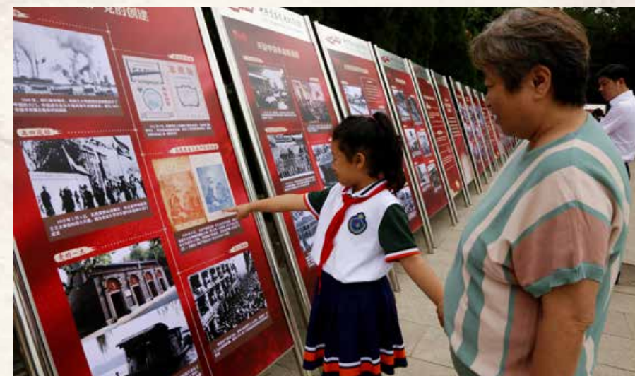
《伟大历程——庆祝中国共产党成立100周年图片展》吸引了很多参观者的目光。“The Great Journey - Photo Exhibition Celebrating the 100th Anniversary of the Founding of the Communist Party of China” also attracted many visitors.