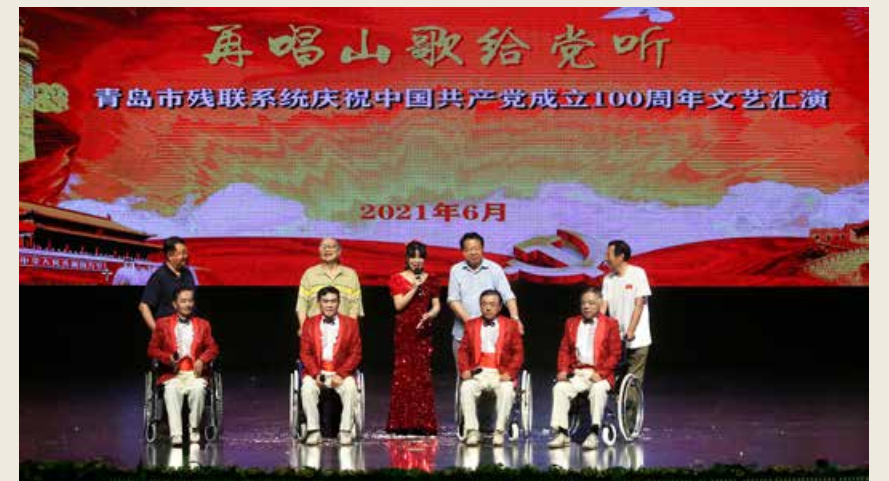
“再唱山歌给党听”青岛市残联系统庆祝中国共产党成立100周年文艺汇演在青岛永安剧院举行。 Qingdao Municipal Disabled Persons' Federation organizes an art performance themed “Singing One More Song for Our Party” at Qingdao Yong'an Theater in celebrating the 100th-year anniversary for the founding of the Communist Party of China.

活动现场，千余名观众和着雄浑激昂的歌声挥舞手中的党旗，此起彼伏的红歌连唱久久回响，把五四广场汇成了一片红歌的海洋。大型演出在台上台下全体人员激情合唱《歌唱祖国》的优美旋律中圆满落幕，用嘹亮的歌声向中国共党的百年华诞献上全市人民真挚的祝福。