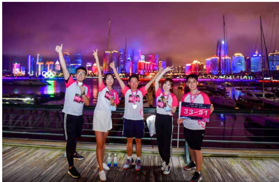
去年的赛事增加了夜赛，让赛事内容更加丰富。 Last year's event added a night race to enrich the contents of the event.