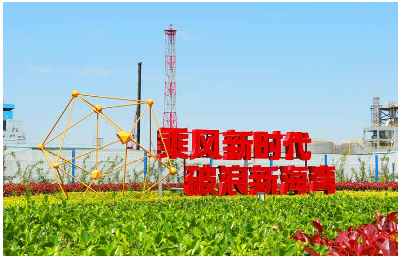
郁郁葱葱的园区。 Lush industrial park.

又一个富有挑战的任务，正是因为在这里，有着一个又一个像位浩、于作甜这样带头人，不畏艰难、砥砺前行，助推着海湾化学在高质量发展道路上阔步前行。