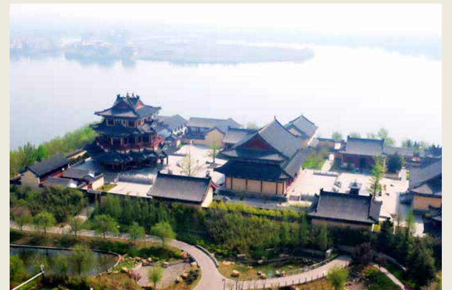
少海国家湿地公园。 Shaohai National Wetland Park

中共青岛党史纪念馆是青岛惟一一处保留至今的早期党组织机关旧址，也是青岛“红色基因”成长的地方。走进展馆，仿佛将观众带回那个充满风雨的红色年代，馆外的德式院落是青岛早期党组织领导工人运动的