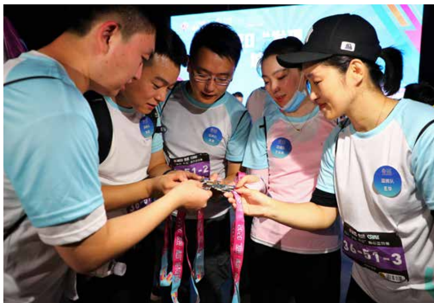
城市定向赛是一种时尚的运动形式，它区别于马拉松，没有固定的线路限定，可将城市大量有代表性的地标串联起来。