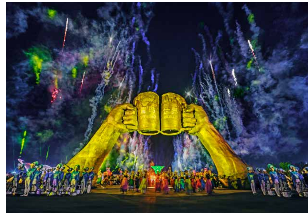
往届青岛国际啤酒节西海岸会场盛况。Grand occasions of previous Qingdao International Beer Festivals at the West Coast venue.