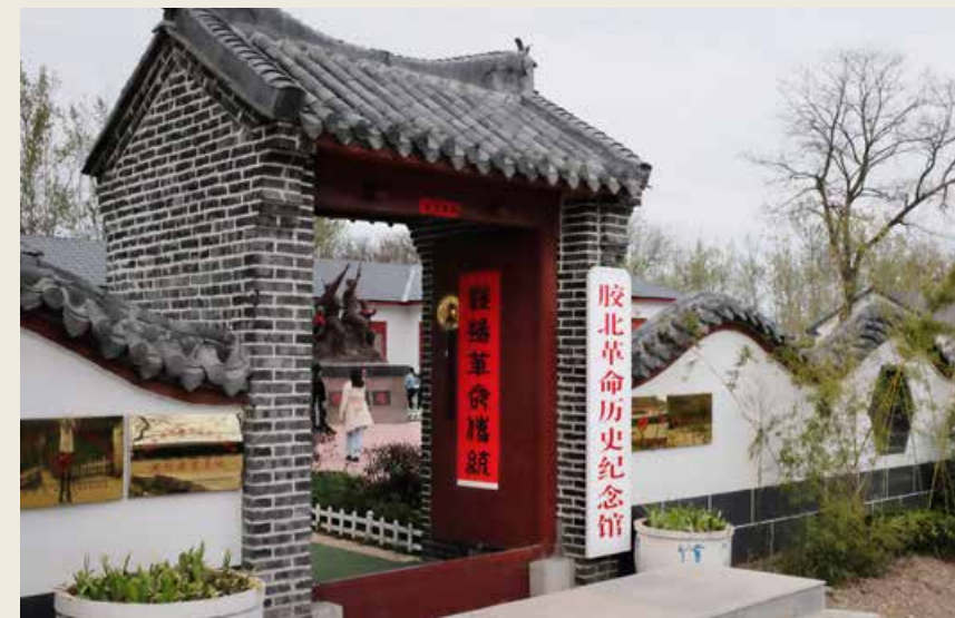
胶北革命历史纪念馆。 Jiaobei Revolutionary History Memorial Hall

在历史悠久的“乐毅城”姜家胡同中,隐藏着威武之师——中国人民解放军第三十二军的诞生地。当年,