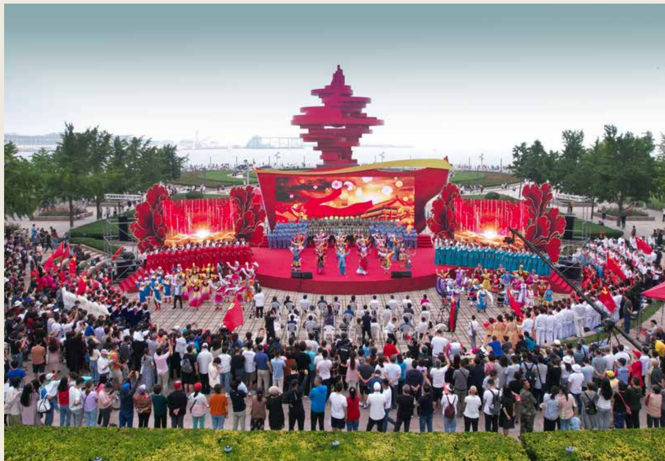
“颂歌献给党”青岛市庆祝中国共产党成立100周年大型广场文艺演出在青岛五四广场举行。Qingdao organizes a large-scale square performance at May Fourth Square in celebration of the 100th-year anniversary for the founding of the Communist Party of China under the theme “Odes Dedicated to the Party”.