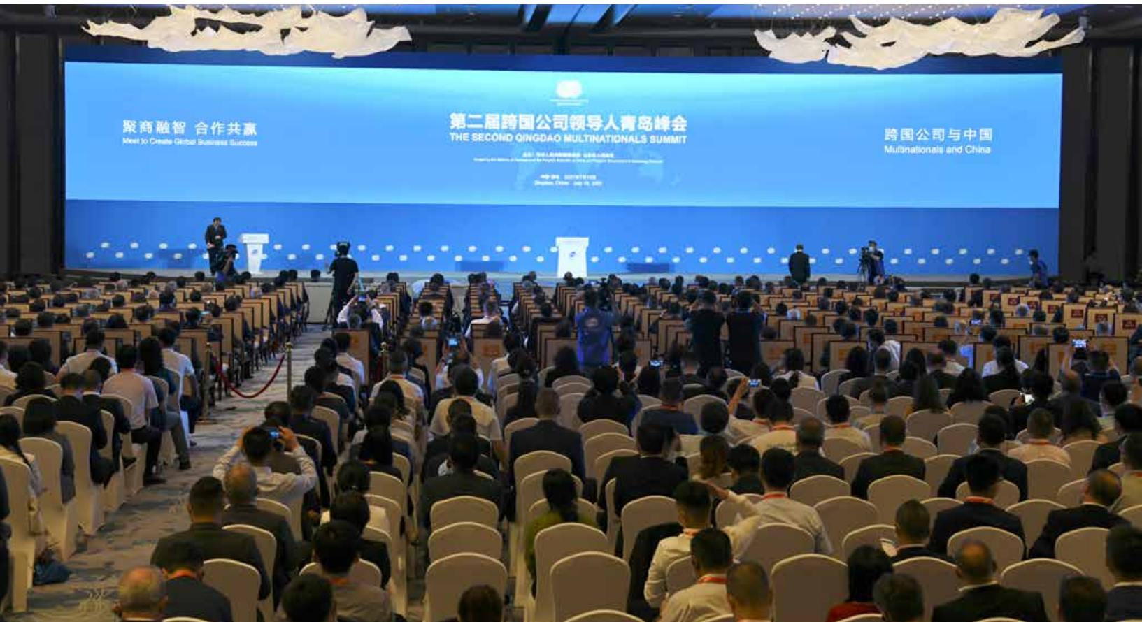
由商务部和山东省人民政府举办的第二届跨国公司领导人青岛峰会于近日在青岛召开。 The 2 nd Qingdao Multinationals Summit (QMS), organized by the Ministry of Commerce and Shandong Provincial People's Government, was held in Qingdao.