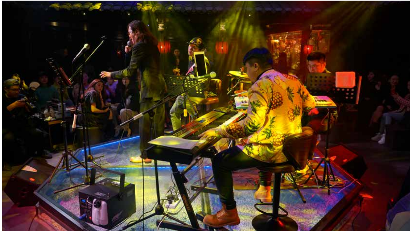
光影氤氲中，伴随着驻唱乐队和歌手肆意挥洒，空气中弥漫着活力与时尚的气息。 Amidst the captivating lighting, the atmosphere teems with dynamics and fashion thanks to the fantastic performance of resident bands and singers.

有全国乃至世界唯一一家建造在啤酒城内的精酿啤酒加工厂——青西金啤精酿馆。市民和游客不仅能亲眼目睹和了解精酿啤酒的生产过程和工艺，还可以亲身体验现酿精啤的醇厚和清爽。皮尔森、白啤、琥珀拉格、青稞艾尔、IPA、世涛等精酿品种应有尽有，为精酿爱好者提供最新鲜、最畅爽的体验。有时间，来酒吧街品一杯酒、听一首歌、读一本书、喝一杯咖啡或茶，感受西海岸夏夜的动静相宜，必会让你流连忘返。