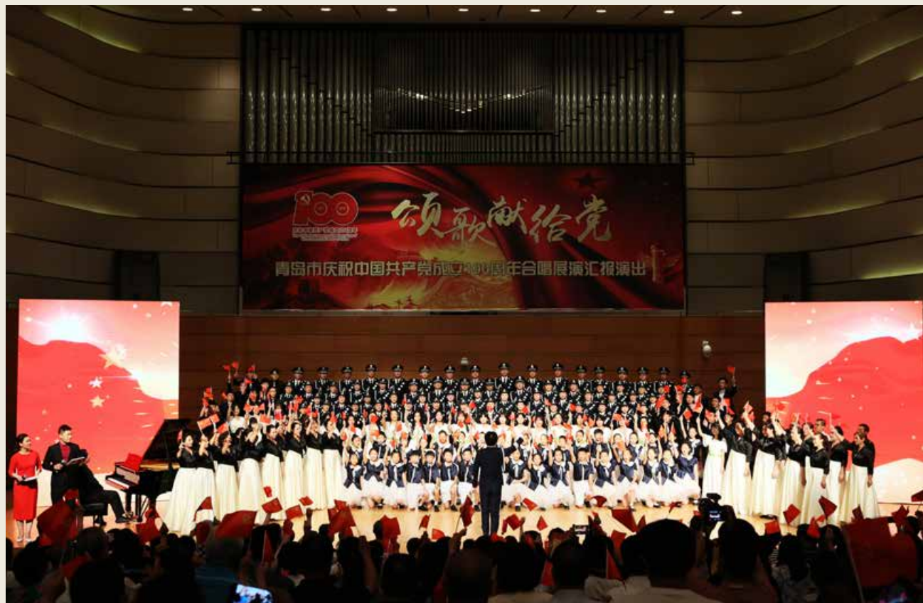
“颂歌献给党”青岛市庆祝中国共产党成立100周年合唱展演汇报演出在青岛大剧院音乐厅举行。(图片提供/中共青岛市委宣传部文艺处) Qingdao organizes a chorus report-back performance at the Concert Hall of Qingdao Opera House in celebration of the 100th-year anniversary for the founding of the Communist Party of China under the theme “Odes Dedicated to the Party”.

作为人民网“我和我的信仰”大型融媒传播活动之一，“启程吧！人民红”快闪车活动全面铺开——6月22日晚，“启程吧！人民红”快闪车第4站来到美丽的青岛，在奥帆中心上演“青岛之夜”，展开系列党史学习教育。据介绍，该活动以青岛为核心辐射全国新生代年轻群体，聚焦青春正能量，讲述新时代青年故事和爱国主义精神。