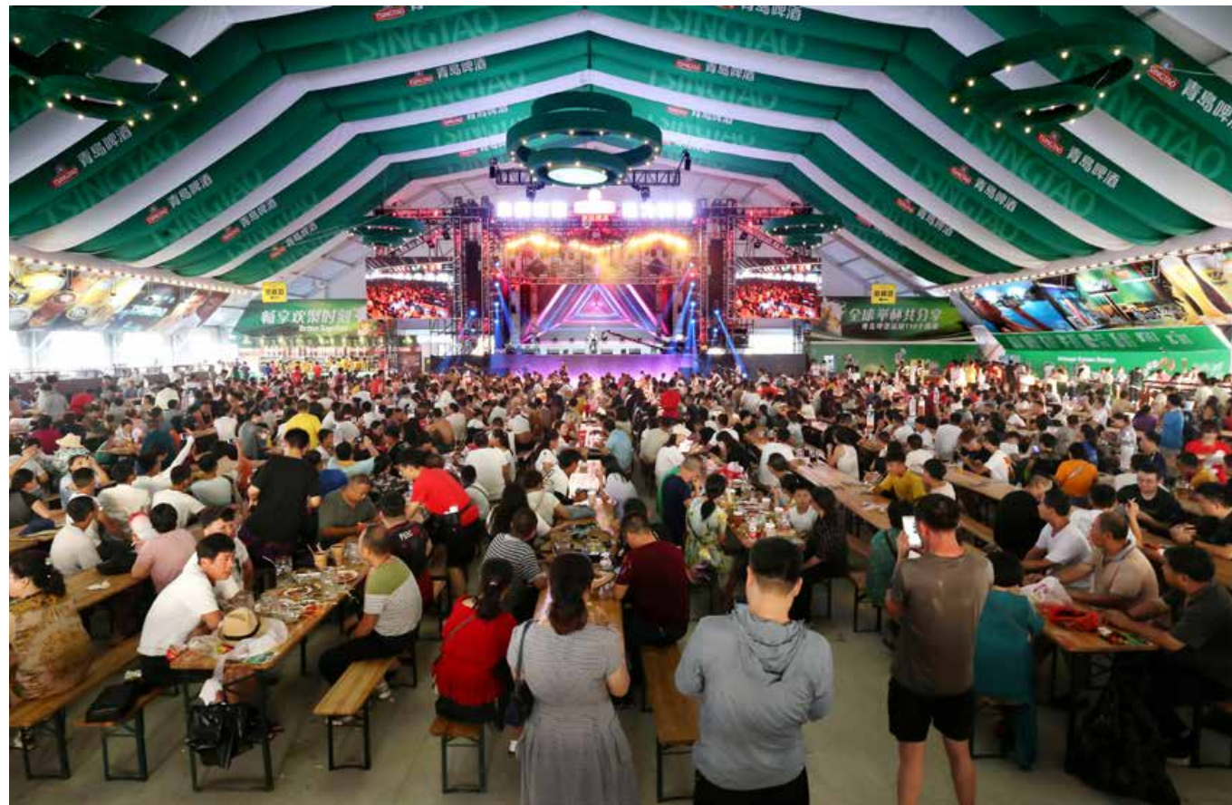
今年，青岛国际啤酒节即将迎来第31届。 This year, we will be witnessing the 31st Qingdao International Beer Festival.

期17天。该会场按照“亲民惠民、传承创新”的原则，打造精致化、品质化、商务化的特色节庆。延续“一主、三辅、六区、全域”的整体框架，营造欢动格局的大场景。在组织饮酒大赛、艺术巡游、模特走秀、歌舞表演等传统节目的同时，创新举办特色主题活动。值得一提的是，崂山会场突出“亲民、活力、时尚”，首次联合国内时尚产业的领军企业对啤酒节进行策划，将时尚、艺术元素融入其中，打造国内一流水平的时尚演艺、舞美灯光和艺术陈列。同时，以“建党一百周年——奋斗百年路，千杯新时代”“啤酒全民节庆——燃爆城市引力场”“崂山文化魅力——千年崂山，少年共建”为设计导向，打造以