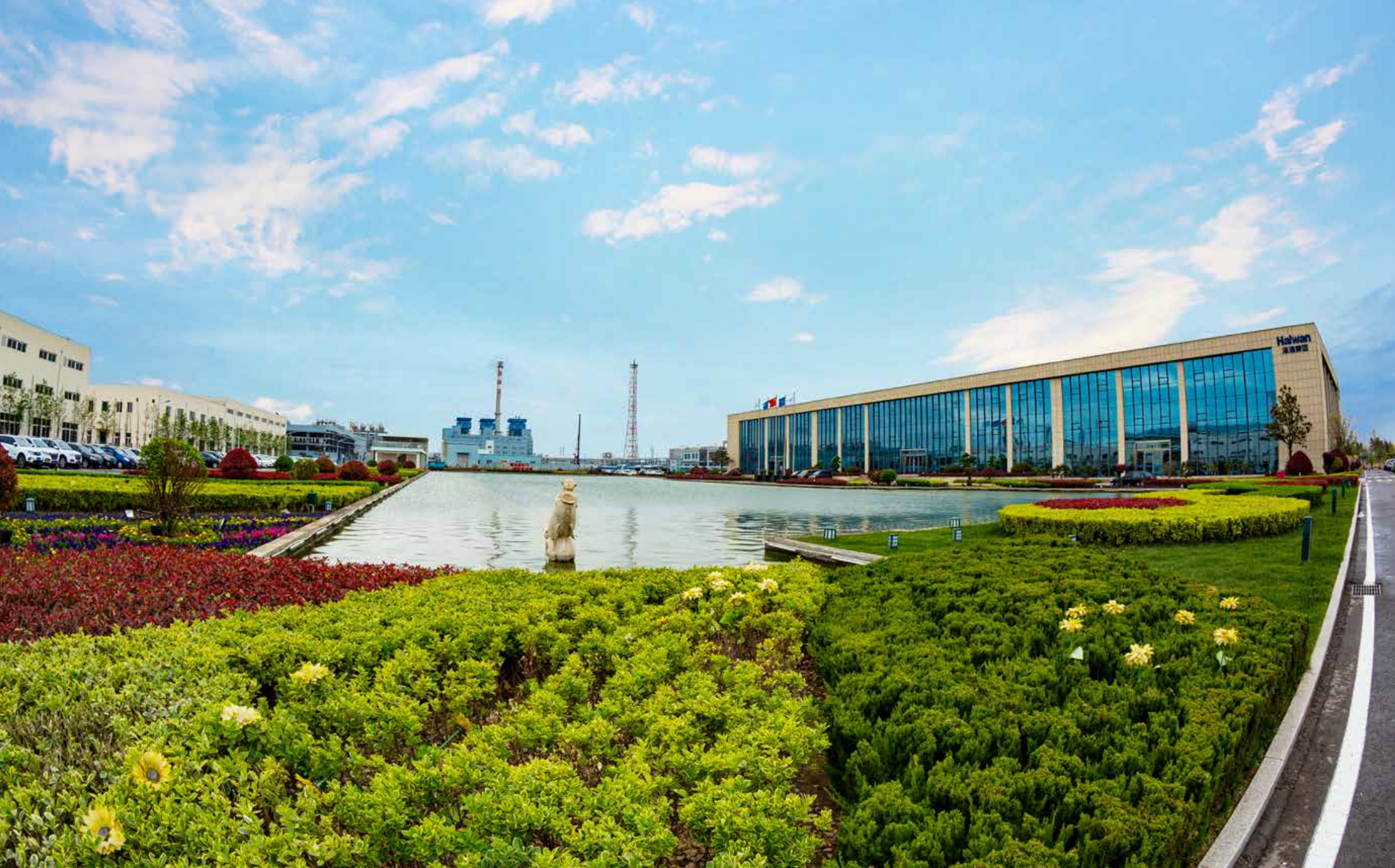
夏日的海湾化学园区。 Haiwan Chemical industrial park in summer

Carrying Forward Craftsmanship and Original Aspirations