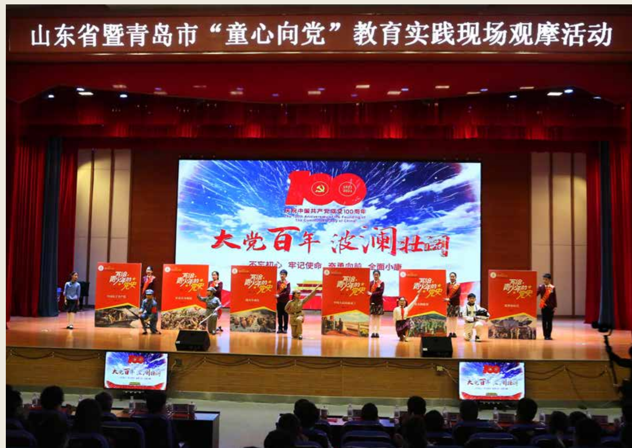
青岛市组织未成年人开展了“我向党旗敬个礼”“唱支红歌给党听”“党的光辉照我心”主题突出、特色鲜明、形式多样的教育实践活动。 Qingdao organized minors to carry out education practice activities with distinctive features, various forms and prominent themes such as “I Salute the Party Flag”, “Sing a Red Song to the Party” and “The Glory of the Party Shines on My Heart”.