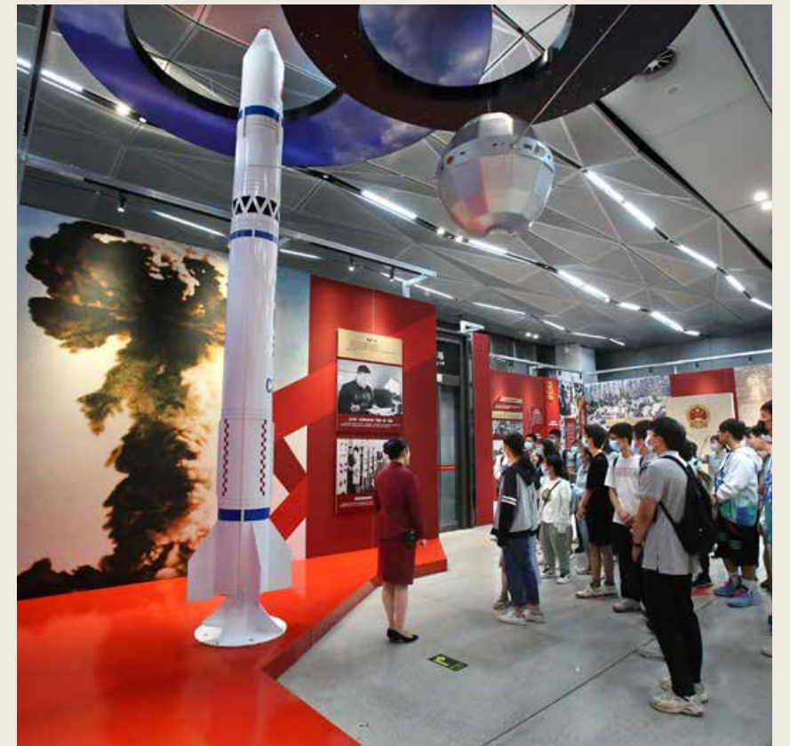
青岛港全自动化码头模型、时速可达600公里的磁悬浮列车模型……主题展生动展示了中国共产党百年来逐步实现救国、兴国、富国、强国奋斗目标的辉煌历程。 Fully automated container terminals at the Port of Qingdao, maglev trains with the speed up to 600km/h... Those models at the theme exhibition vividly depict the grand journey the Communist Party of China has taken for one hundred years towards the goal of saving, rejuvenating, enriching and strengthening the country.

庆祝中国共产党成立100周年青岛主题展气势恢宏、内容详实，运用了上千幅照片、300多套珍贵实物、多种数字化科技手段，全面展现了中国共产党百年来逐步实现救国、兴国、富国、强国奋斗目标的辉煌历程，生动展示了中共青岛地方组织和青岛人民在党中央领导下同心奋斗取得的巨大成就。据了解，庆祝中国共产党成立100周年青岛主题展筹备工作自今年3月启动后，实行专班化运作，青岛国际新闻中心展览工作室与文案策划、照片实物征集、展陈3个工作小组同时推进，与时间赛跑。除了现场展陈，此次主题展还推出了青岛主题展网上展厅、VR展厅，市民可以通过扫码进行观看，感悟党的梦想和追求、情怀和担当、牺牲和奉献。