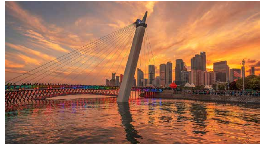
青岛市明确重点任务，研究有效措施，推动全市创建工作取得新突破、再上新台阶。 Qingdao defines key tasks and researches into effective measures, with the aim to achieve new breakthroughs in this endeavor for the city and attaining a higher level.

近日，青岛市全国文明城市创建动员部署会召开，对今年全国文明城市创建工作进行动员部署，解读测评体系，剖析问题短板，明确重点任务，研究有效措施，推动全市创建工作取得新突破、再上新台阶。中共青岛市委常委、宣传部部长、市文明委副主任、市创建全国文明城市联席会议副总召集人孙立杰出席会议并讲话。