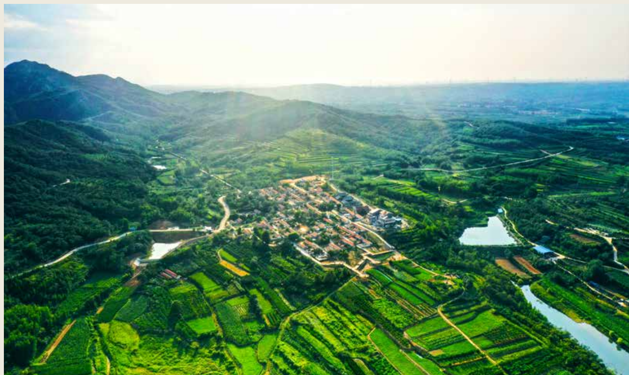
三山环抱一河穿梭的“杨家山里”，并非一个独立的村庄，而是一个“群落”。 Yangjiashanli, with three surrounding mountains and one river crossing over, is more than an independent village; it's more like a “community”.