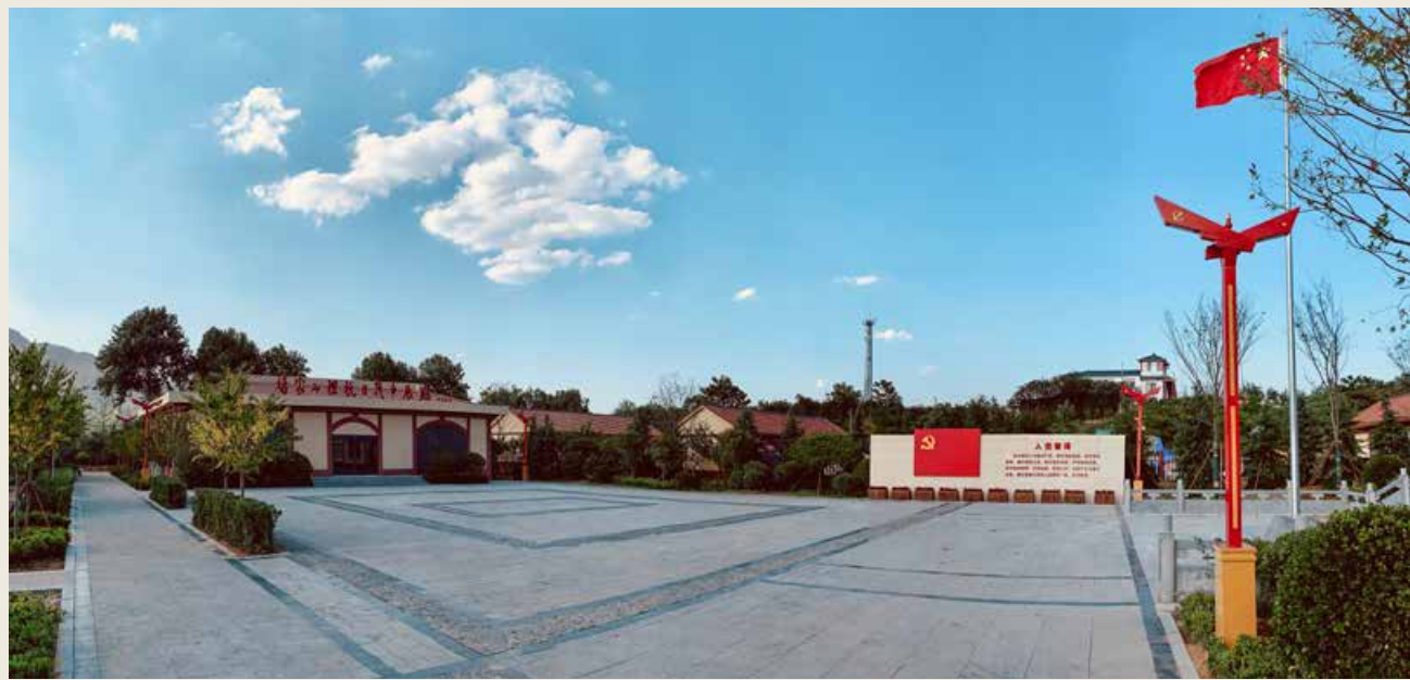
杨家山里红色教育基地。 Yangjiashanli Red Education Base

而大沽河作为胶州的母亲河，更是见证了历史发展的脉络。走进大沽河博物馆，在古代文明展厅、民俗风情展厅、胶州历史展厅、胶州党史馆等展馆内，感历史之沧桑，品文化之风韵。