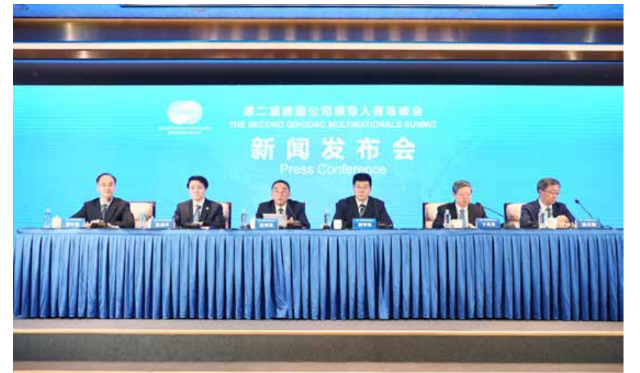
本届峰会成果尤为丰硕，对话交流成效显著。 This summit has achieved remarkable results in dialogue and exchanges.