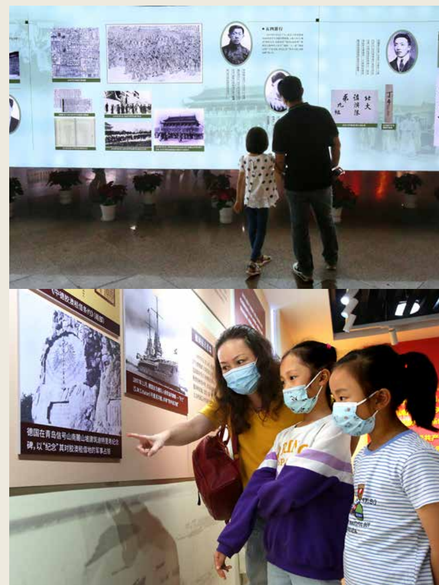
主题展举办时间持续到10月10日，面向全市党员干部群众免费开放。（组图） The theme exhibition will last until October 10, and is open to all the Party members, cadres and the masses in Qingdao free of charge.

This exhibition consists of 4 components - “Homeland Invasion