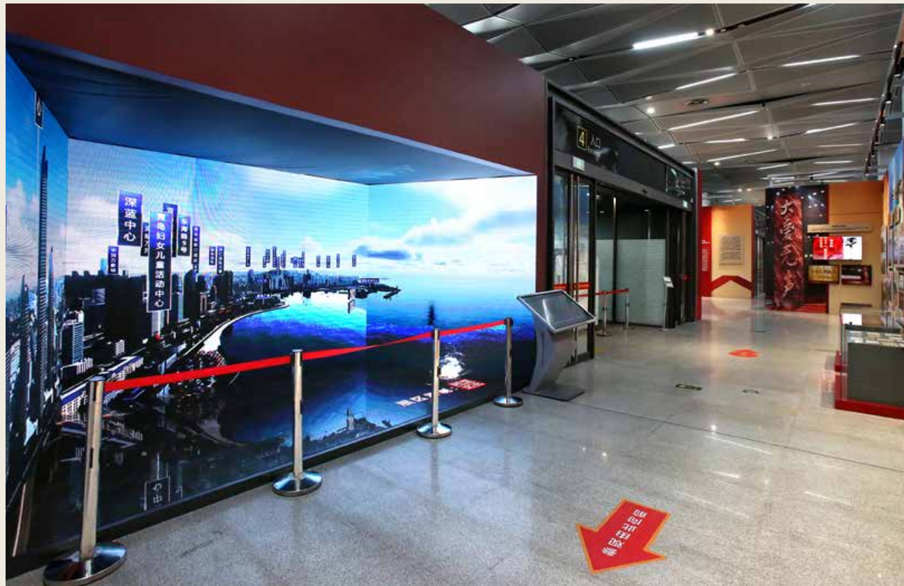
主题展运用先进的数字科技，再现青岛浮山湾百年变迁。 The theme exhibition adopts advanced digital technology to reproduce the vicissitudes of Fushan Bay over one hundred years.