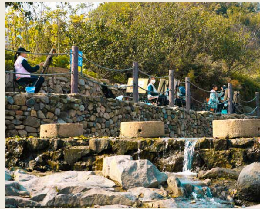
在杨家山里，随处可见写生爱好者用画笔记录美好。 Fans of sketching who record the beauty with their hands are spotted everywhere in Yangjiashanli.

邻铁山水库，三面环山，一面向水。1975 年，电影《库区人民学大寨》在此拍摄后，这里便有了光影印记。借助青岛西海岸新区打造“影视之都”的发展契机，其所在街道投资 2400 万元建成后石沟村乡村影视基地，对村里的老街、老巷、老房子进行修缮改造，打造了影视步行街、大槐树、阳光超市、谷仓、老宅等影视场景和