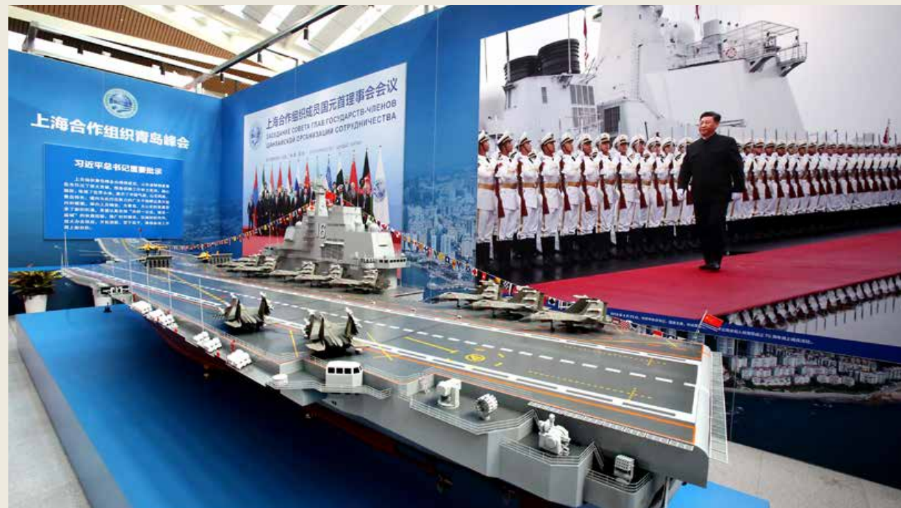
1: 48 超大号辽宁号航空母舰模型，做工精细、气势恢宏，配以VR虚拟沉浸式体验，让观者身临其境体验航母出航，感受大国力量。 The model of Liaoning aircraft carrier on a scale of 1:48 is showcased at the venue, featuring exquisite workmanship solemnly and magnificently. The VR immersive experience accompanying the model make visitors feel personally on the scene of the carrier setting out, extending a feeling of the great power of our nation.