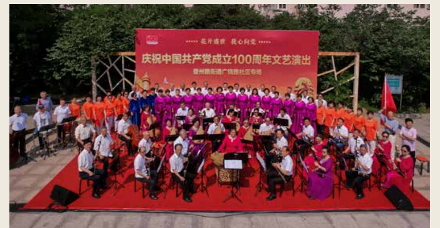
青岛各区各街道广泛开展庆祝中国共产党成立100周年文艺演出。 Cultural and artistic performances to celebrate the 100th anniversary of the founding of the Communist Party of China were widely held in the streets of all districts in Qingdao.

为人知的付出，彰显了文明与道德的力量，激发了观众的共鸣，精彩的节目得到了观众们的一致好评和称赞。除此之外，现场还增加了党史知识和文明城市创建提问抢答环节。台下观众积极互动，激发了活动现场“学党史、知党情、敬模范、争先锋”的浓厚氛围。