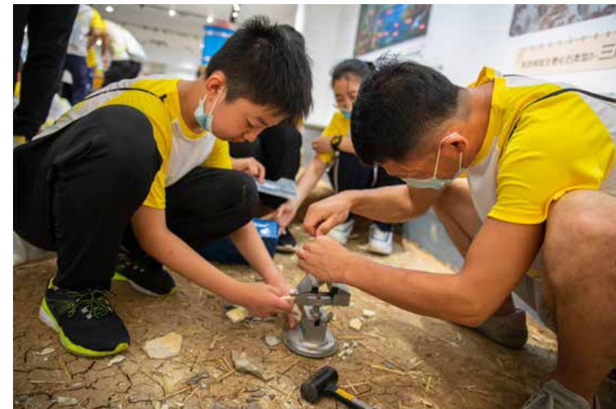
往期的城市定向赛十分精彩。 The city orienteering tournaments in the past were quite exciting.

经典的景区、热门的商圈、新晋的网红地标，还有游戏和表演相结合的竞技秀……正在编织新的“赛道”，给敢于挑战的你48个崭新的奔跑方向。特别值得一提的是，赛事打卡点位由各区市特荐，再进行二轮选拔，覆盖青岛超过300个文化、时尚、旅游、历史、人文、红色线路、地标建筑等。这一次，“发现·青岛”的视角更加开阔，城市的景深也更加丰富，而参与其中的你，将与更多强劲的对手相遇。2021“发现·青岛”城市定向赛让你在炎炎夏日中感受青岛的魅力，在浓浓凝聚力中收获无尽的成就感。