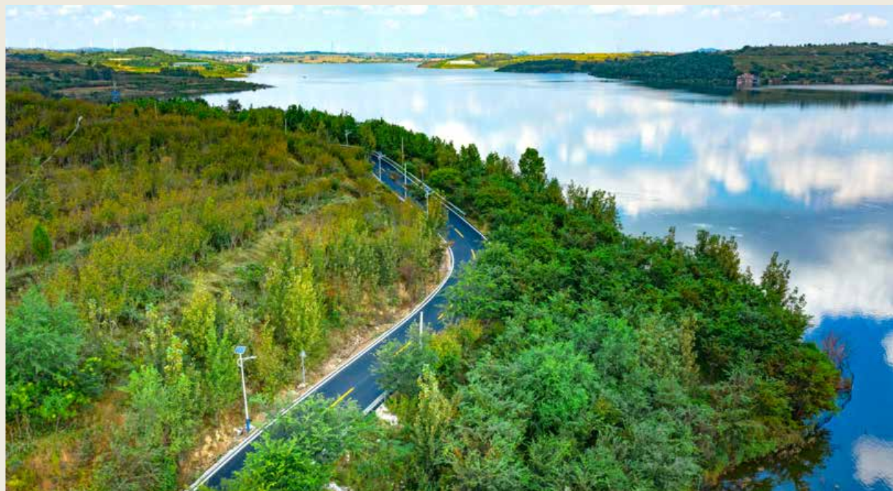
“原山原水原生态、原汁原味原生活”的乡间景色让人留恋忘返。 The countryside view described as “Original mountains, waters and ecology, as well as authentic taste, flavor and life” makes everyone linger on without any thought of leaving.