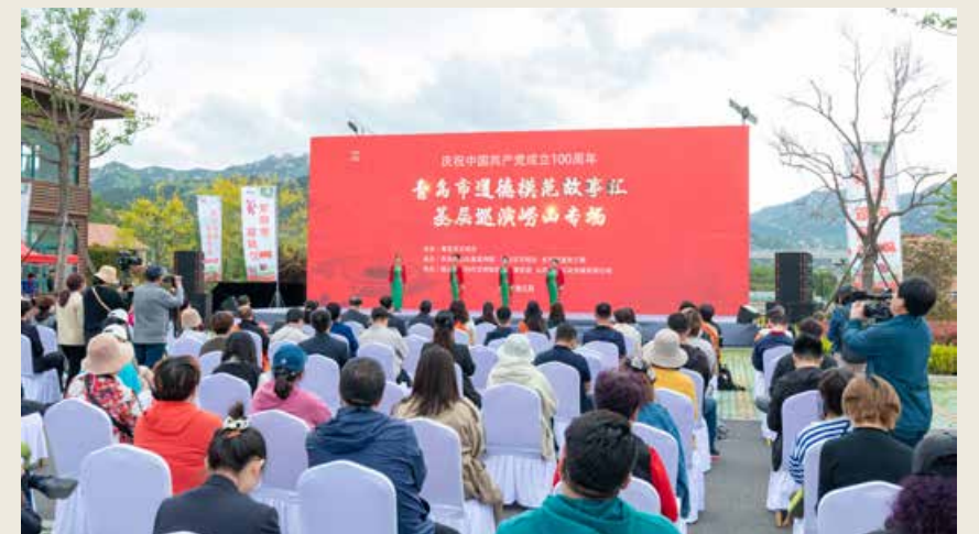
近日，庆祝中国共产党成立100周年青岛市道德模范故事汇基层巡讲崂山专场在崂山区北宅街道举行。（图片提供/青岛市文明办） Recently, Qingdao has launched the Grass-roots Tours for Moral Model Stories to celebrate the 100th-year anniversary for the founding of the Communist Party of China at Beizhai Community, Laoshan District.

在崂山专场，一个个原创作品将感人的故事用艺术的方式呈现给观众，生动诠释了道德模范的担当和不