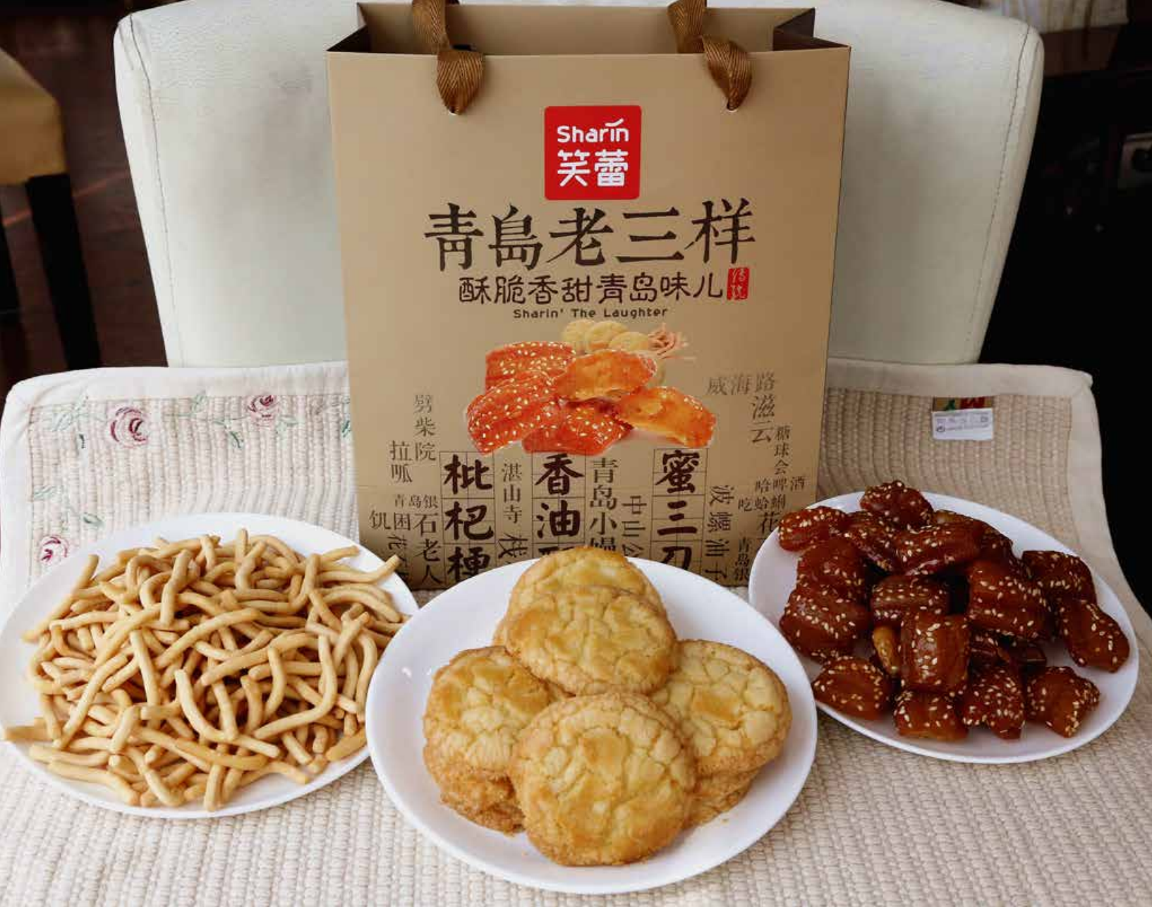
笑蕾食品推出的岛城知味·“老三样”点心礼盒，勾起了很多老青岛人的回忆。 Sharing Food offers Taste of Qingdao: “Traditional Trio” Snack Gift Box, which has brought back many old Qingdao people’s memories.

Qingdao “Traditional Trio” Snacks: Crispy and Sweet Qingdao Flavor