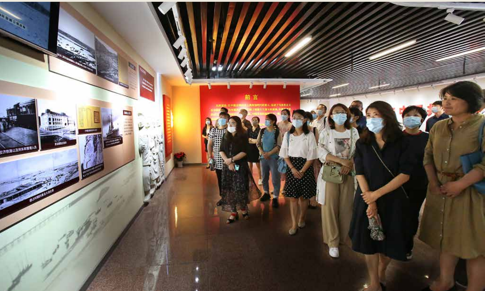
主题展旨在缅怀五四先驱崇高的爱国情怀和革命精神，引导广大党员干部群众坚定理想信念，凝聚奋斗力量。 The theme exhibition aims to cherish the memory of the lofty patriotism and revolutionary spirit in the forerunners of May 4th Movement, uniting the broad Party members, cadres and the masses as one to stand firmly in support of their ideals and principles and gather strength.