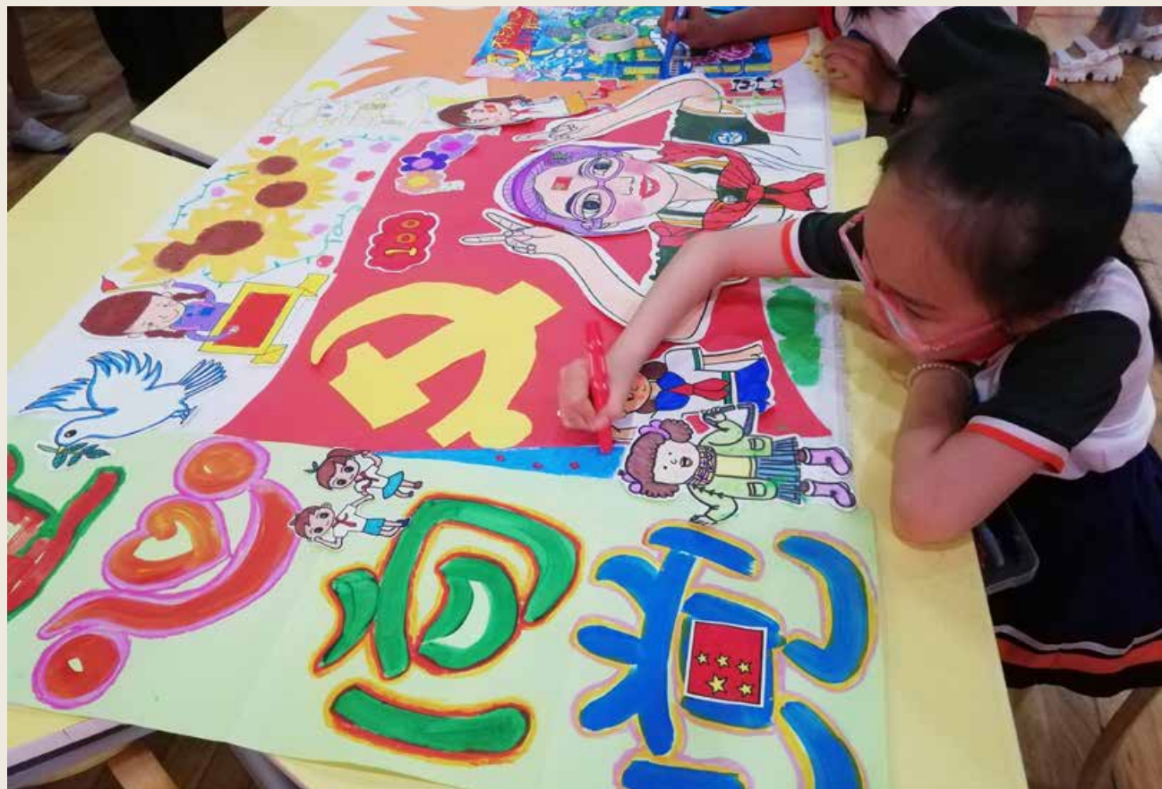
全市各区开展了丰富多彩的“童心向党”主题活动。 All districts of the city have carried out a variety of activities with the theme of “Children’s Hearts Devoted to the Party”.

文明与道德的力量；舞蹈《绣红旗》表演者以优美的舞姿，表达了始终坚持中国共产党的领导，永远跟党走的信心和决心；一首《五星红旗》电声乐队歌曲点燃了现场激情，将演出推向了高潮。