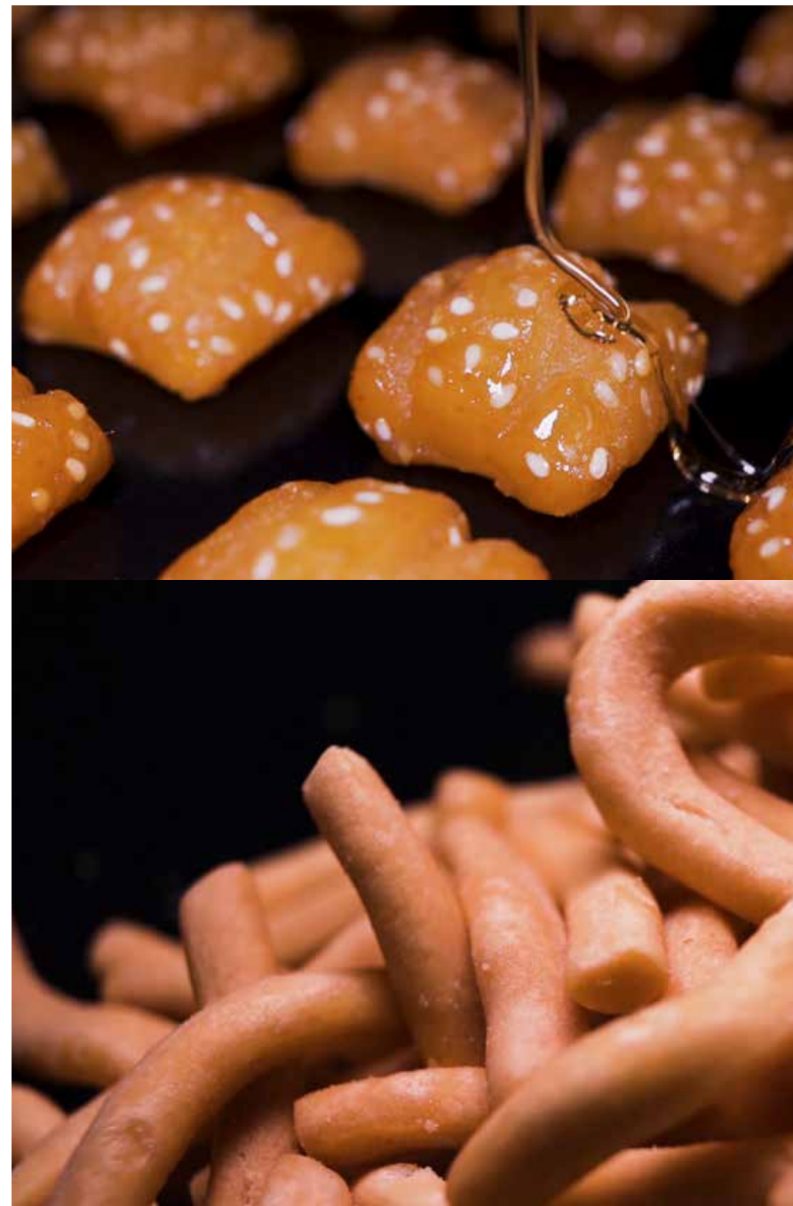
甜蜜的蜜三刀、酥脆的枇杷梗让人垂涎欲滴。（组图） The sweet honey dough squares and loquat stalk-shaped pastry are mouthwatering.

随着时代的进步和发展，种类繁多的点和甜品出现在人们的生活中，“老三样”的竞争力似乎真的“老了”。在笑蕾看来，青岛的美食记忆不该被磨灭。因此，笑蕾食品启动了“青岛