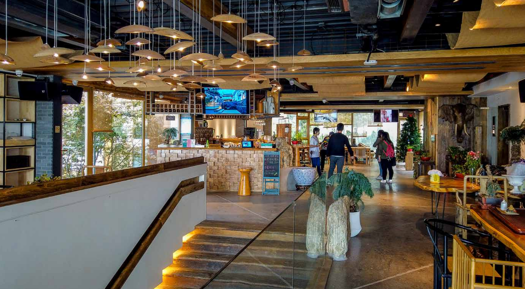
东麦窑拥有特色的“山—海—村”乡村空间布局。Dongmai Yao has the unique countryside space layout described as “mountain-sea-village”.

Looking for a Sense of Home at Mount Lao