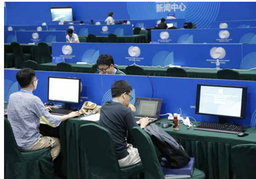
本届峰会得到境内外媒体的高度关注，20 个国家和地区的 117 家媒体报道峰会。 The summit has attracted great attention from the media at home and abroad, with 117 media outlets from 20 countries and regions covering the summit.