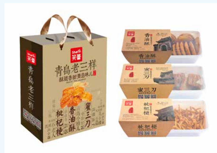
蜜三刀、枇杷梗、香油酥组成了极具青岛特色的“老三样”点心。 Honey dough squares, loquat stalk-shaped pastry and sesame oil crispy cookie are the “Traditional Trio” snacks with Qingdao characteristics.