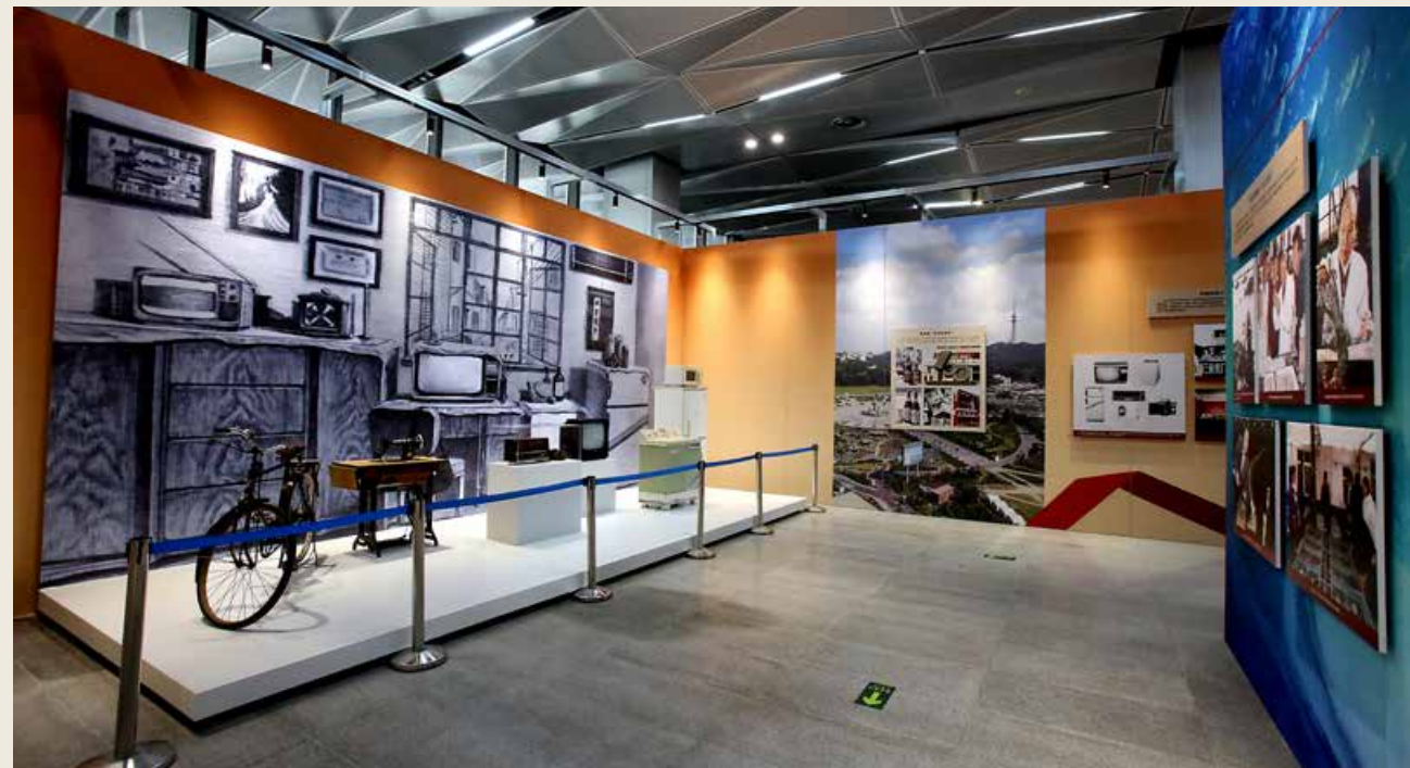
主题展运用了上千幅照片、300多套珍贵实物以及多种数字化科技手段。 The theme exhibition adopts thousands of photos, more than 300 sets of precious physical exhibits and a variety of digital means of display based on high technology.