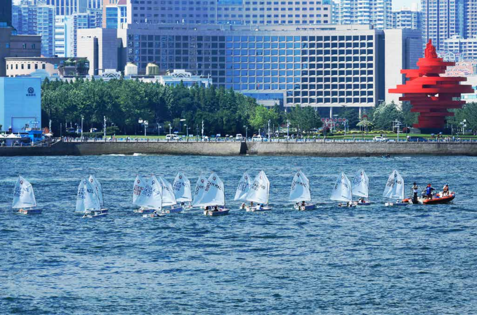
帆船给青岛带来了更多的魅力和活力。 Sailing has brought more charm and vitality to Qingdao.