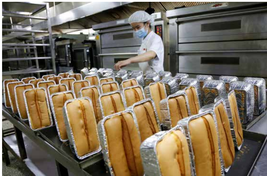
“老三样”在制作过程中严格把控食品安全和质量，为人们提供高品质的产品。 Food safety and quality in the production process of the “Traditional Trio” snacks are strictly controlled to provide people with high-quality products.

花生油，炸出来香味能飘半条街；香油要用小磨香油，那叫一个浓香细腻；当然，添加剂是真的没有。百次尝试，千次试吃，味道一步步走向正宗。这一年，“老三样”有了新模样。