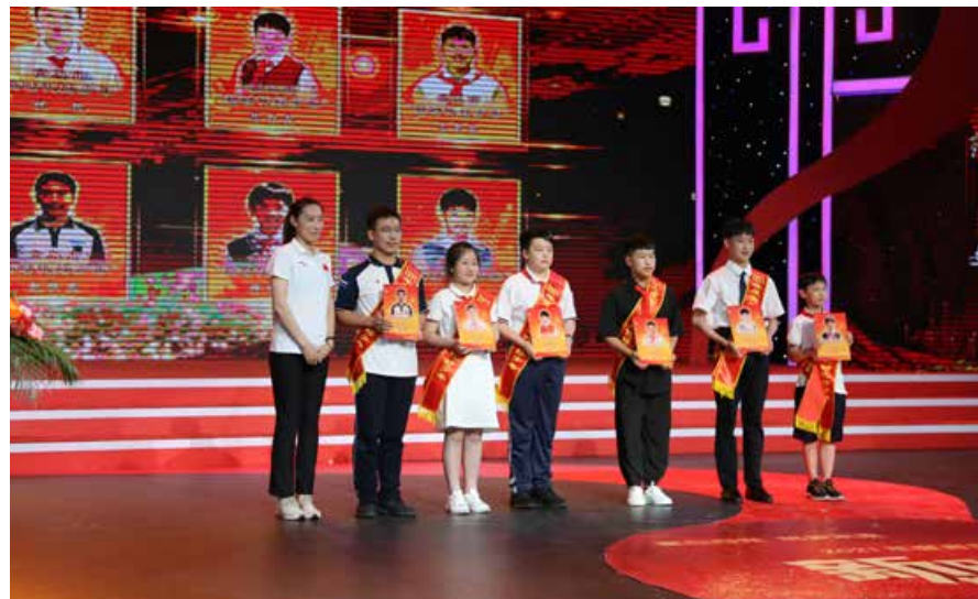
现场聆听这些“好少年”的精彩事迹，让人十分动容。Listening to the outstanding deeds of these “moral teenagers”, the audience were deeply moved.

活动现场，新时代好少年们与大家分享了自己的成长故事，他们优良的品德、昂扬的精神、真挚的话语深