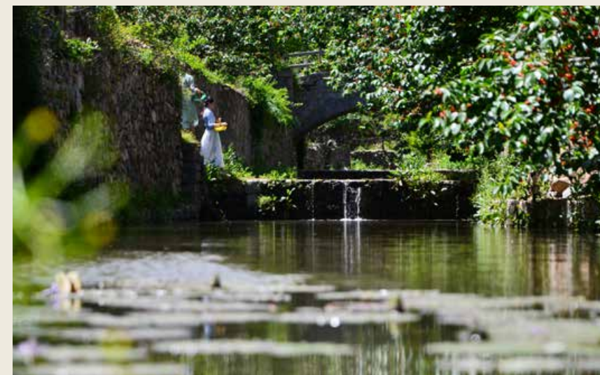
溪水潺潺傍村而流，增添了别样的风情。 A brook murmurs down by the village, adding to the unique charms here.

有春雨，更便有落英缤纷、杏花春雨的绝佳意境；夏秋时节，月季漫山遍野，五彩斑斓，点缀起这层层绿色叠嶂；冬日雪后的杨家山里，更是银装素裹，纯白静谧，似给这世间一分独有的清静。