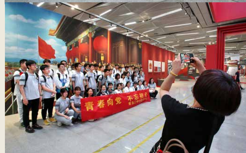
主题展举办时间持续到8月31日，面向全市党员干部群众免费开放。（组图） The theme exhibition will last until August 31, and is open to all the Party members, cadres and the masses in Qingdao free of charge.