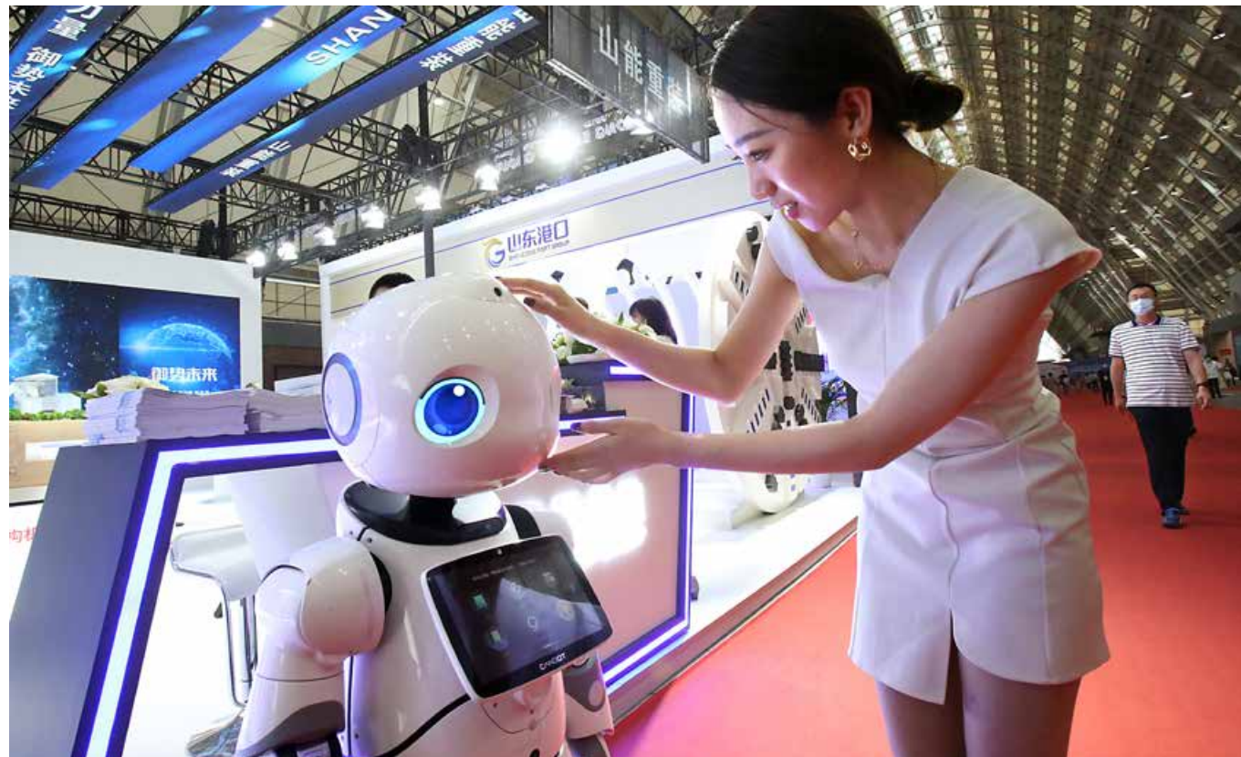
与峰会配套举办的 2021 新动能·青岛展览洽谈会吸引来自日本、德国、瑞士等国家和国内的一批 500 强企业和行业领军企业参展。 The 2021 New Growth Drivers Fair-Qingdao, held in parallel with the summit, attracted a number of top 500 enterprises and industry leaders from China, Japan, Germany, Switzerland and other countries to participate in the exhibition.

与首届相比，本届峰会活动内容更加丰富、议题更加广泛、形式更加多元。各项活动中，与会嘉宾围绕维护多边主义、融入 RCEP 大市场、碳达峰碳中和等重点议题领域，开展政策解读，进行深入交流，凝聚广泛共识；济南、青岛、烟台、滨州等市聚焦新旧动能转换、产业链协同、自贸试验区高质量发展等内容进行重点推介；大陆集团、林德集团、三菱日联银行、思爱普等世界 500 强企业，通过路演发布新技术新产品，阐释了行业发展新方向。