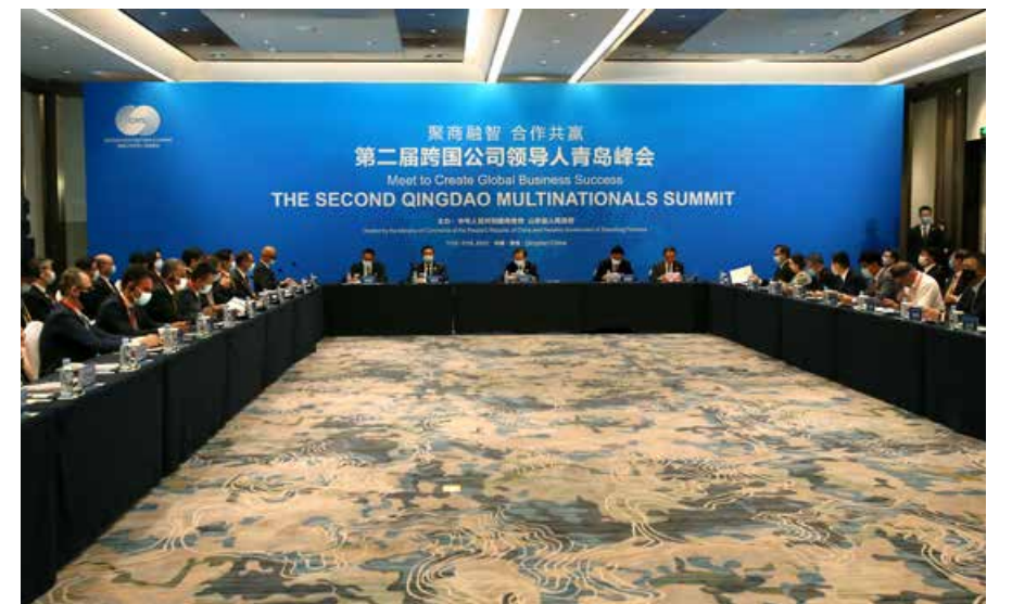
本届峰会举行了 12 大类 28 场活动。 The summit held 28 events in 12 categories.

会影响力迅速扩大，体现了中国发展的速度之快、开放程度之深；日本住友会长中村邦晴说，峰会有力推动了山东省、中国乃至世界市场环境不断向好。