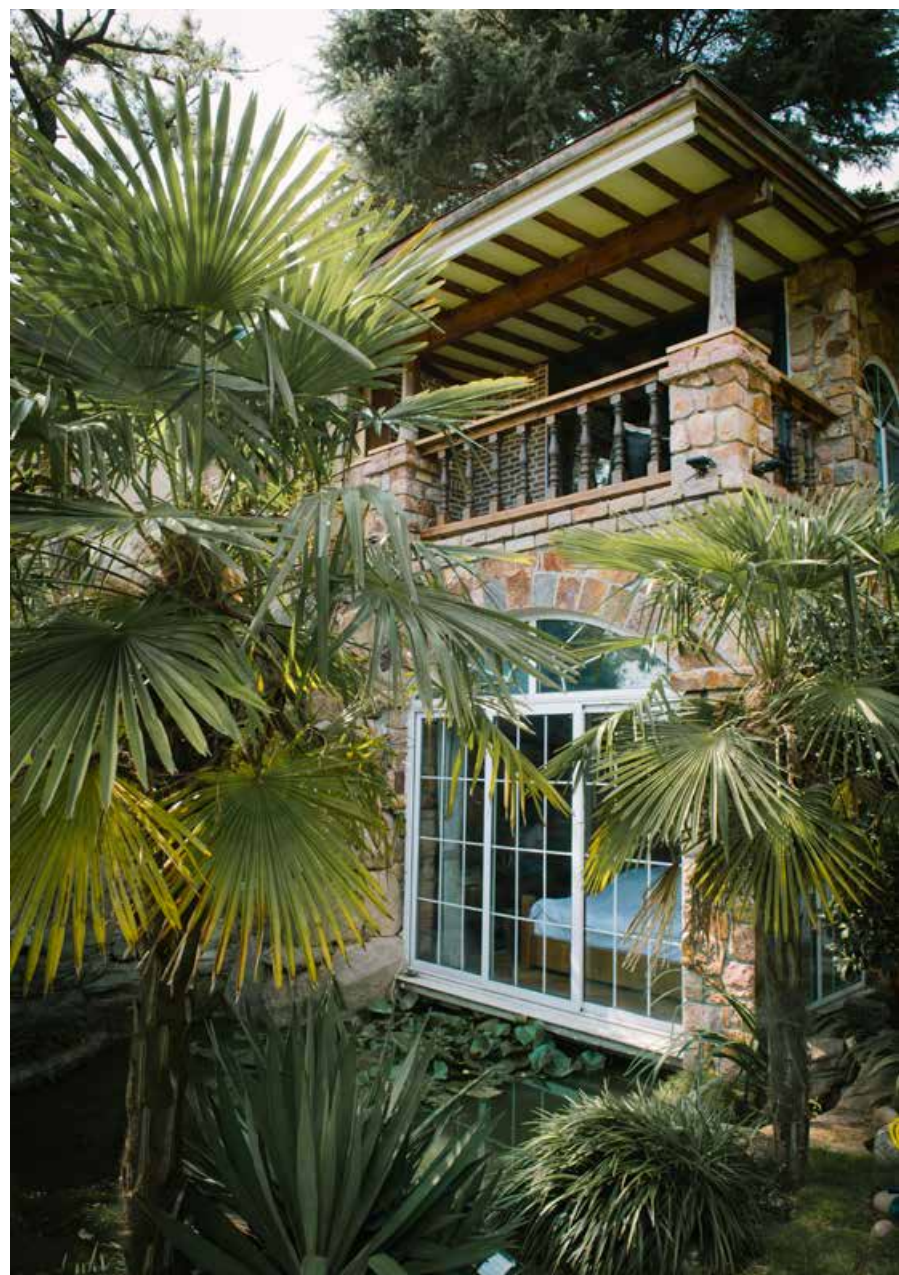
一半是山居、一半是海景的石壩城堡。The Shiyong Castle, which translates into half mountain residence and half sea view.