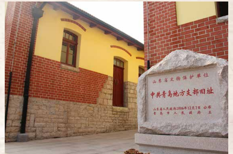
中共青岛党史纪念馆院内一景，特色鲜明。 A unique scene in Qingdao Party History Memorial Hall.

主题为《光辉历程——中共青岛历史展》的基本陈列，展示青岛党组织自1923年建立以来艰苦卓绝的奋斗史和辉煌历程，展出历史文献、实物和照片800余件；专题展厅，紧密结合党员集中教育，举办专题展览。据青岛党史纪念馆的工作人员介绍，党史馆先后设计制作“保持共产党员先进性教育”“党的群众路线教育”“三