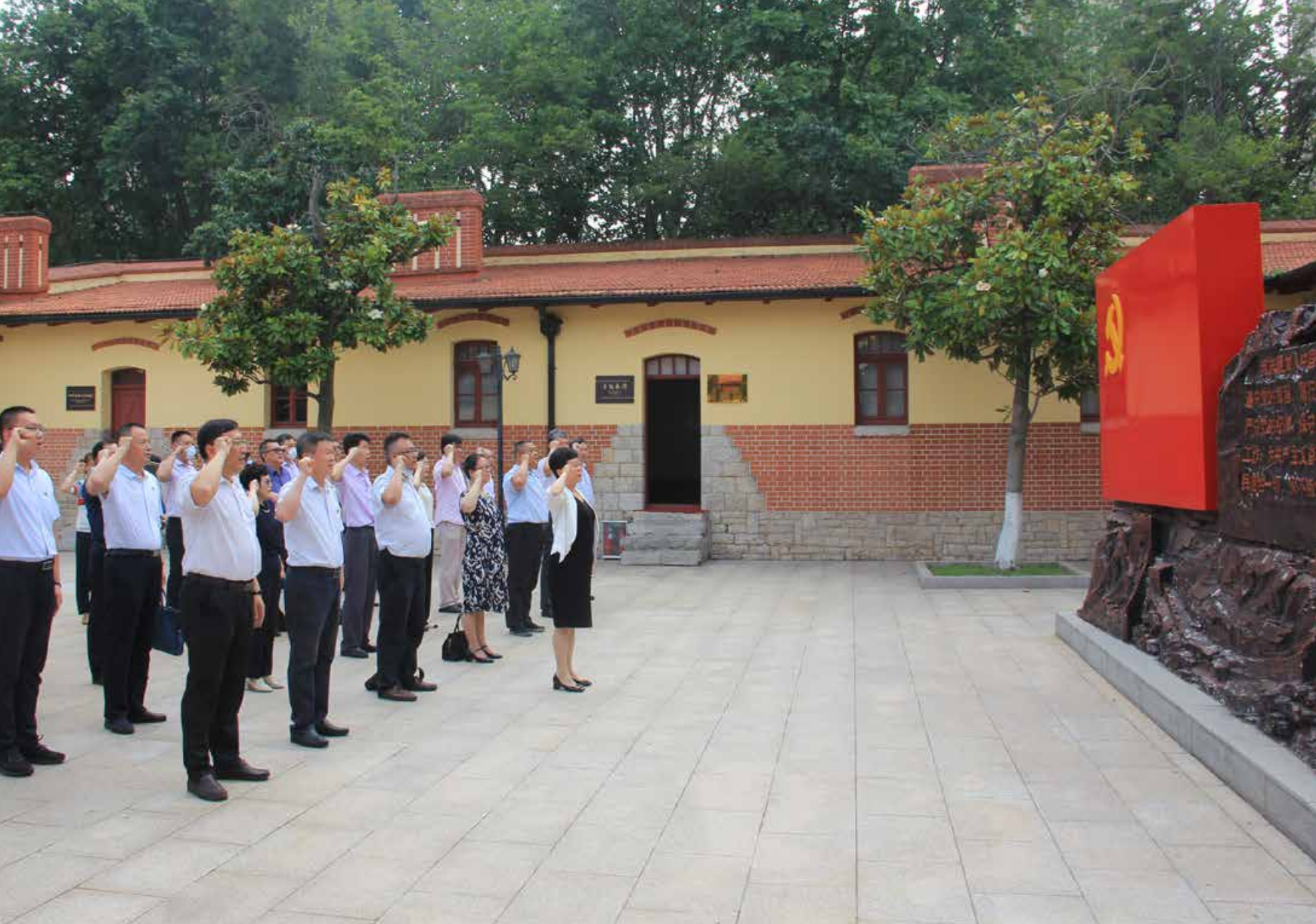
青岛市直机关各单位和各企业党员在“七一”期间，纷纷到中共青岛党史纪念馆进行宣誓，共同庆祝中国共产党成立100周年。 During the Party's Birthday, Party members from all units directly under the municipal government and enterprises took an oath in Qingdao Party History Memorial Hall to celebrate the 100th anniversary of the founding of the Communist Party of China.