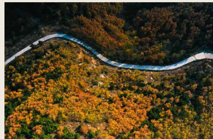
三山环抱的杨家山里，自然而浪漫。 Yangjiashanli, surrounded by three mountains, is full of natural beauty as well as romantics.