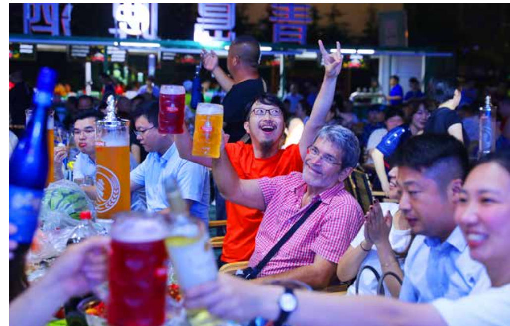
7月中旬至8月底，青岛将开启“全城欢动、激情共享”的节庆模式。Qingdao will be in the holiday mode described as “Joys across the City, Passion Shared Everywhere” from mid-July till the end of August.