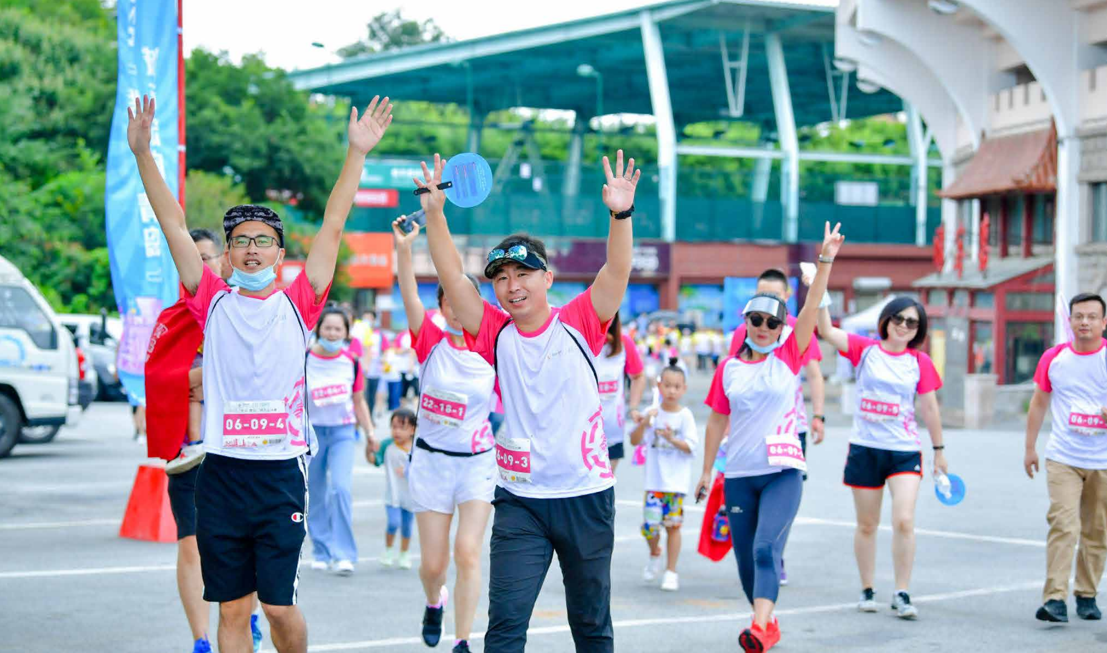
2021“发现·青岛”城市定向赛让你在炎炎酷暑中感受青岛的魅力，在凝聚力中收获无尽的成就感。 The 2021 “Discovery - Qingdao” City Orienteering Tournament allowed you to feel the charm of Qingdao in the hot summer and gain endless sense of achievement in the strong cohesion.