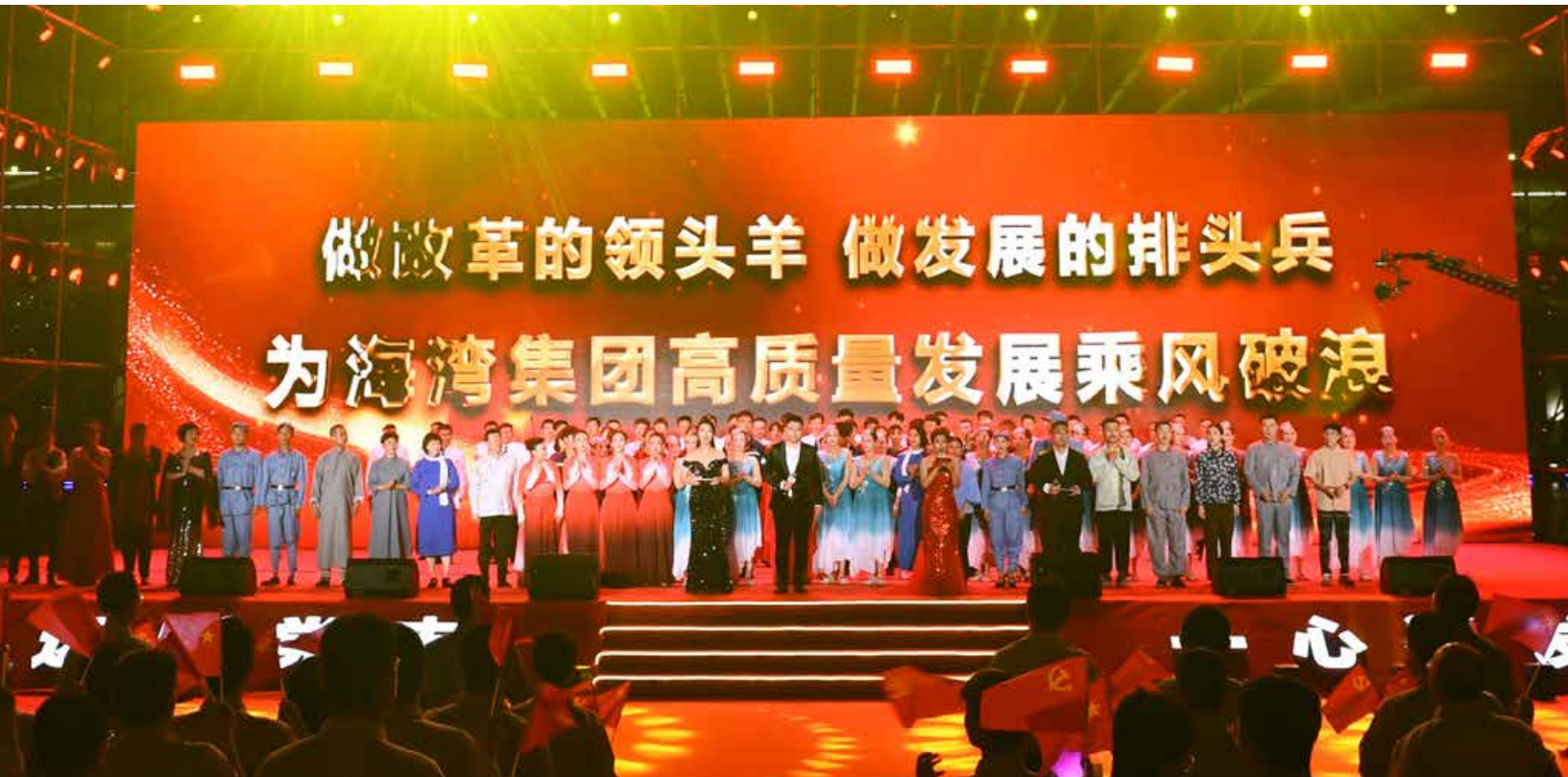
日前，一场庆祝建党 100 周年暨“七一”表彰大会在海湾化学园区内上演。 A Celebration of the 100th Anniversary of the Founding of the Communist Party of China & July 1 Commendation Conference was held recently in the Haiwan Chemical Industrial Park.