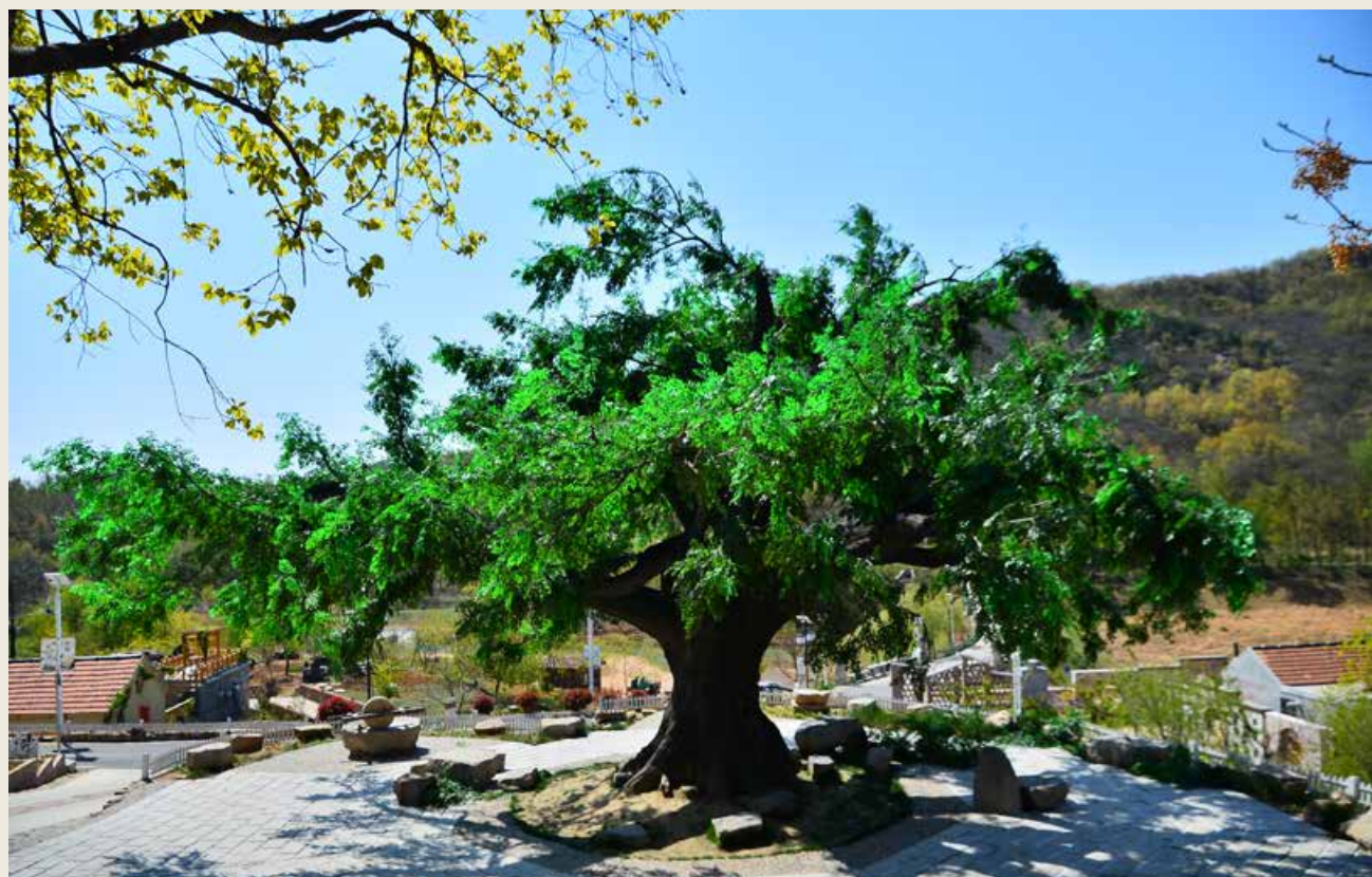
热播剧《温暖的味道》中“后石沟村”村口的大槐树。 The big Chinese scholar tree has been featured at the entrance to “Houshigou Village” in the hit TV series The Warm Taste .