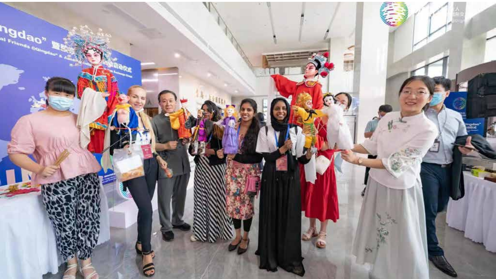
来自北京、上海、南京、昆明、太原、扬州、青岛等 10 个城市的文旅界代表以及 40 多个国家的 100 余名国际友人共同参加 2021“国际友人 @Qingdao”暨胶东文旅交流活动启动仪式。