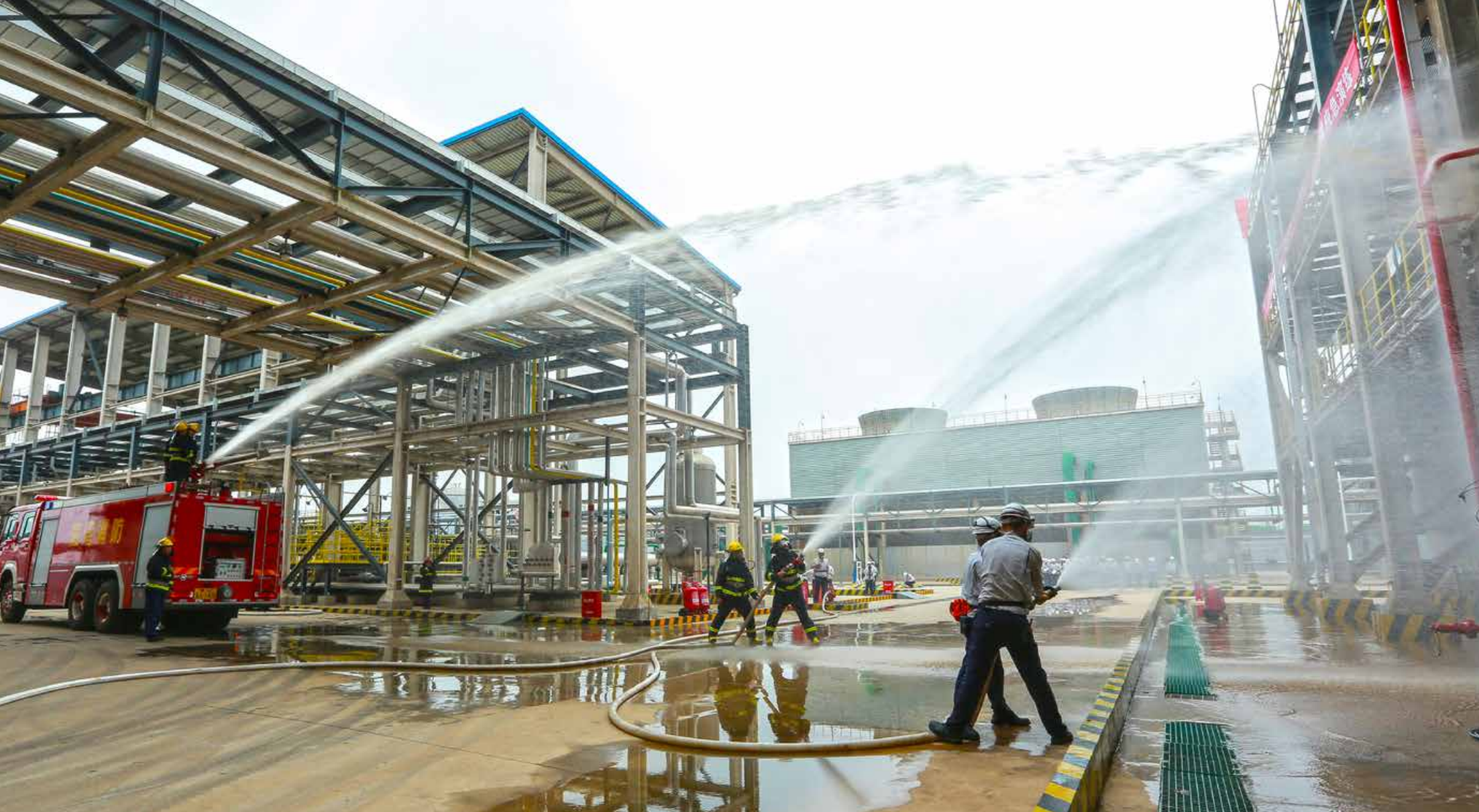
夏日的海湾化学园区。 Haiwan Chemical industrial park in summer.

Fulfilling Safety Responsibilities, Promoting Safe Development