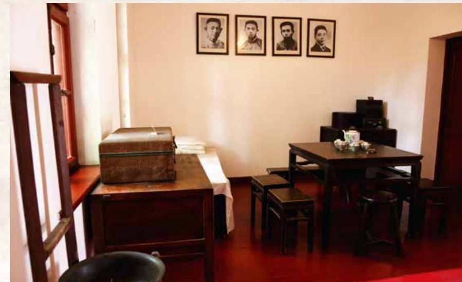
中共青岛地方支部旧址复原场景。 The restored former site of the local branch of the Communist Party of China in Qingdao.

时光虽不停，但历史值得铭记。过去，中国历经了一次次战争与磨难，再看如今的国泰民安、繁荣昌盛，总让人感慨来之不易。追寻革命足迹，重温红色记忆，一次参观、一次红色之旅是当下最为流行的行程，也是最有意义的经历。