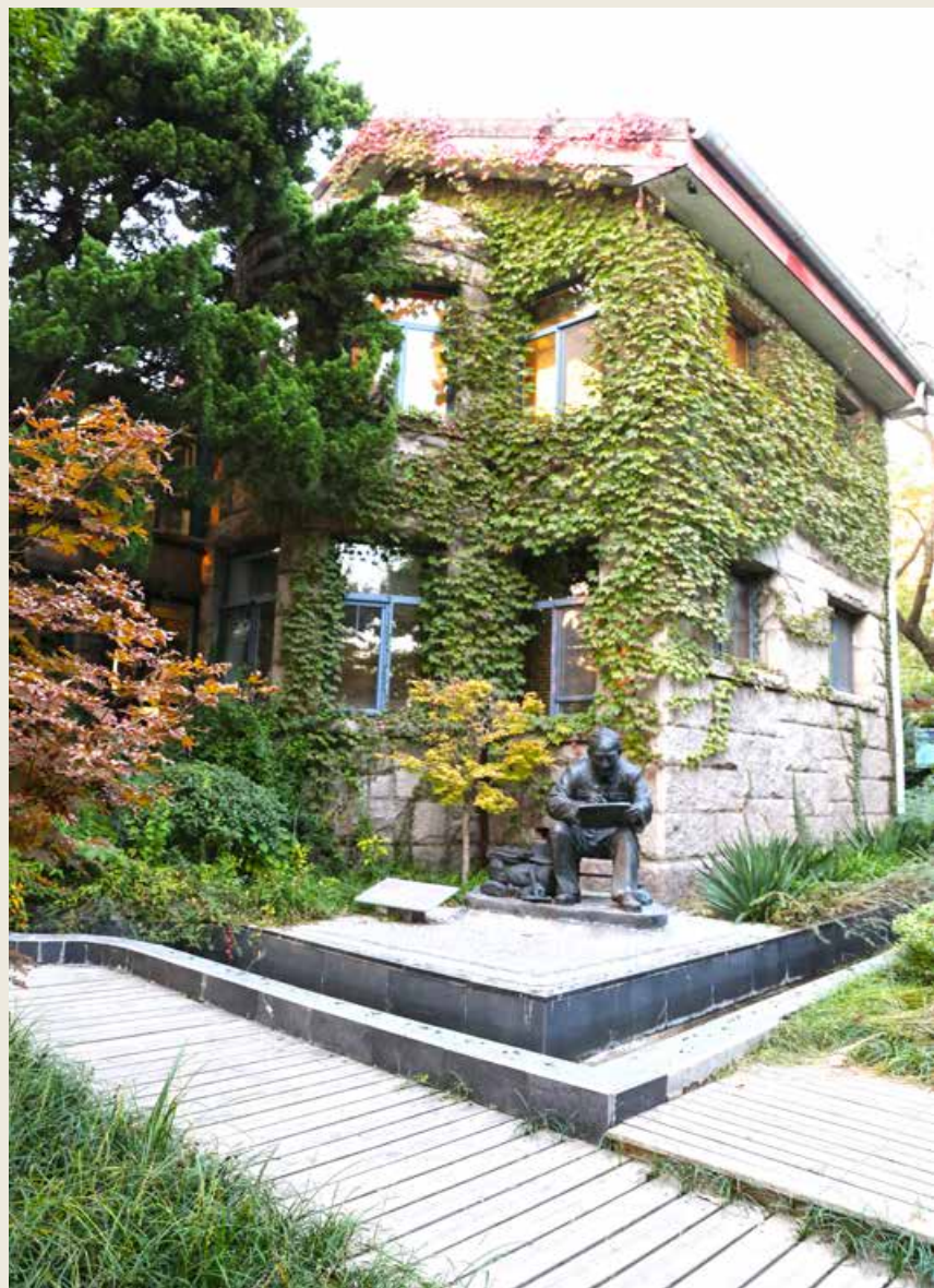
地质之光展览馆。 Di Zhi Zhi Guang Exhibition Hall

市库区移民文化展览馆—大沽河岸绿道—青岛蟾公酒文化博物馆—花园头抗战教育基地(展馆)