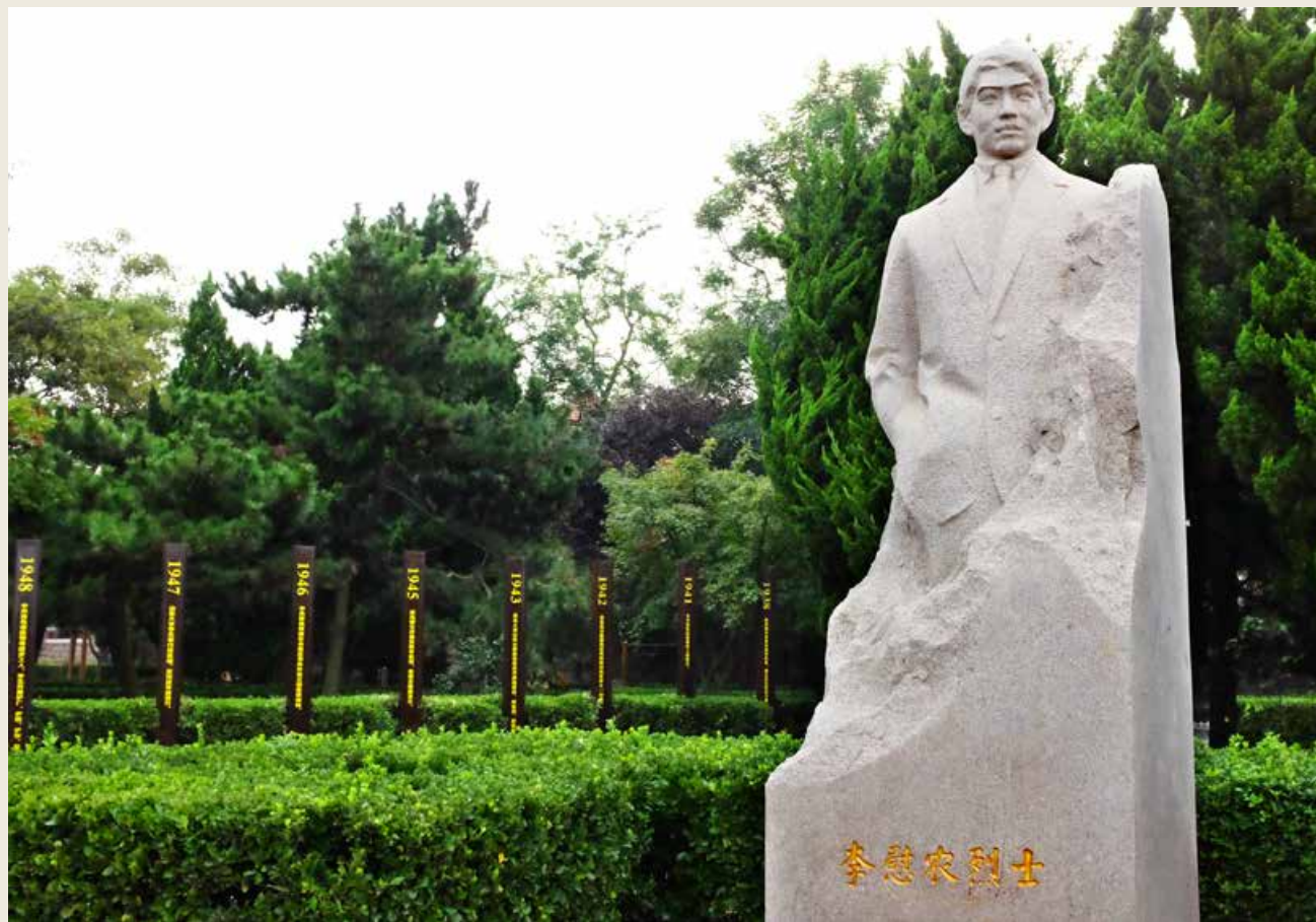
李慰农公园。 Li Weinong Park