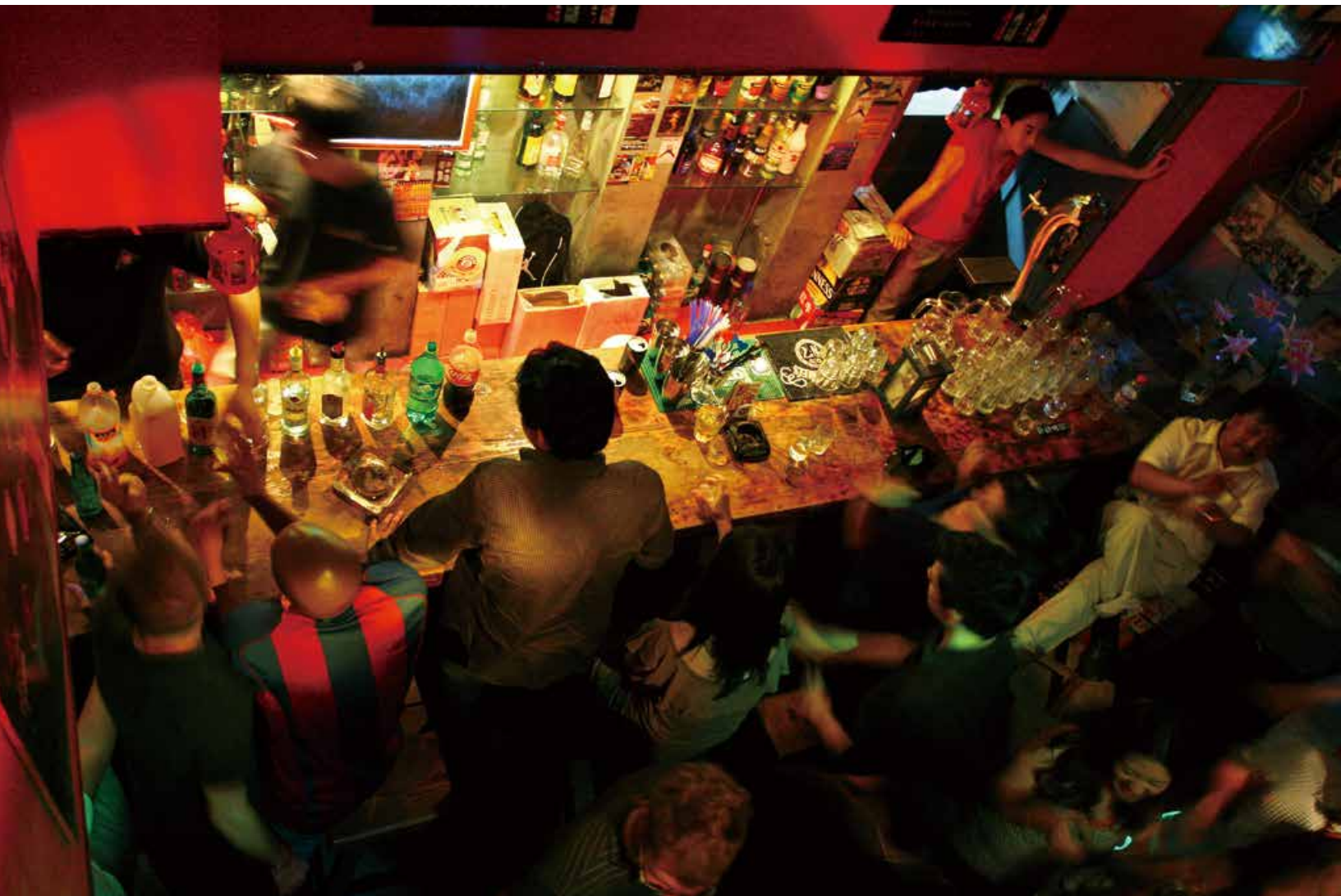
夜色下，青岛的酒吧绚丽多彩。 Qingdao boasts of wonderful bar streets for unforgettable nightlife.