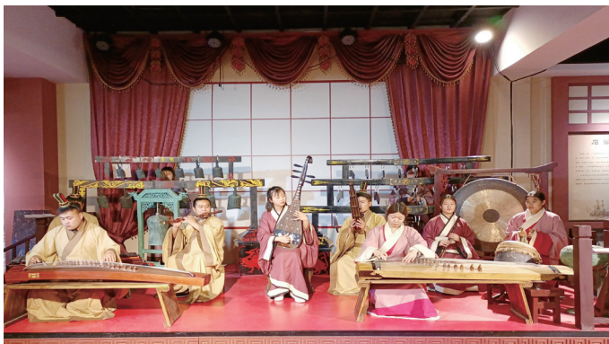
▲ 莱夷文化礼乐博物馆