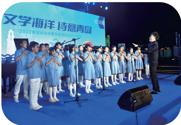
▲ 首届青岛诗歌节暨国际海洋文学周活动现场

日积月累，海洋文学成为这座城市的一个符号，丰富了城市文化面貌，增强了人文吸引力。