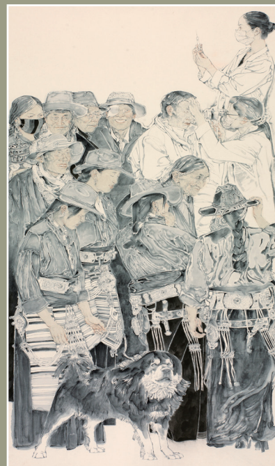
▲《雪域高原的光明使者》